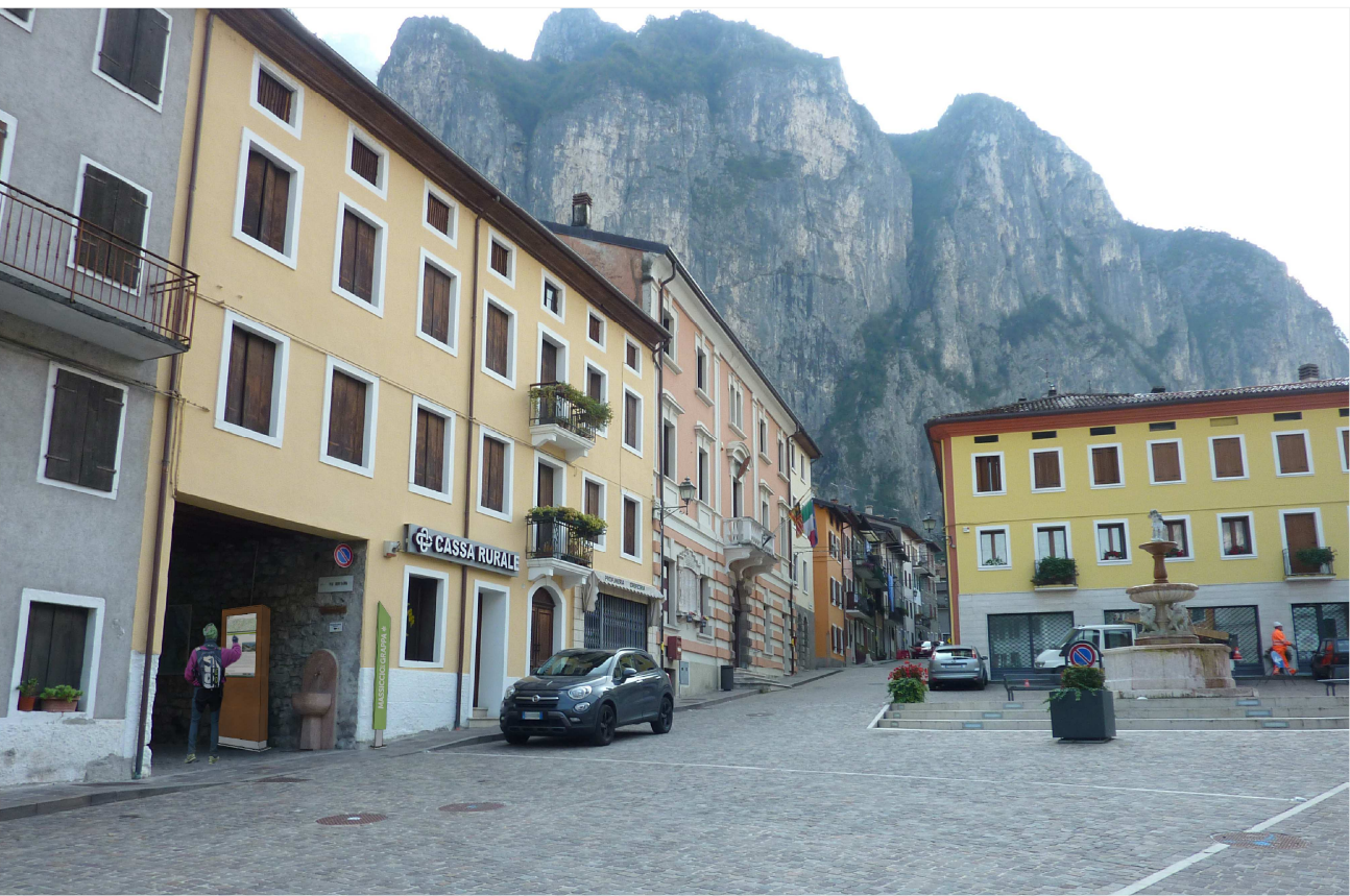
PUNTO 1 e 2: inserimento stele e totem interattivo – PROGETTO