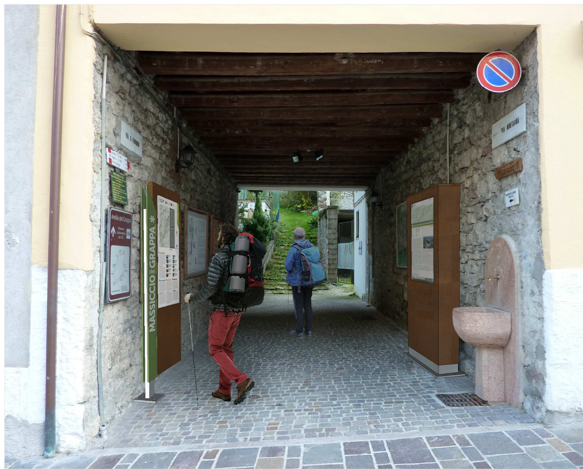
PUNTO 2 e 3: pannello informativo e totem interattivo – PROGETTO