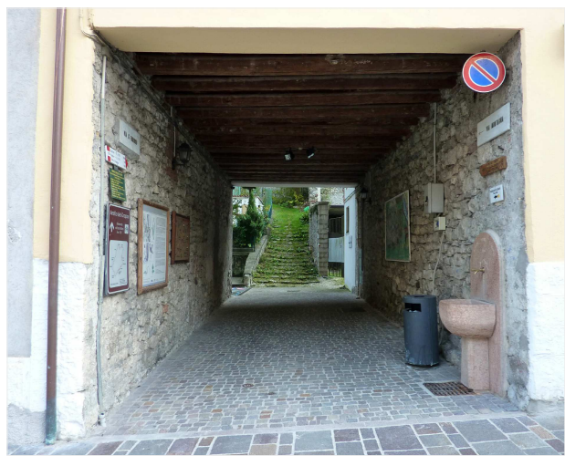
PUNTO 2 e 3: stato di fatto