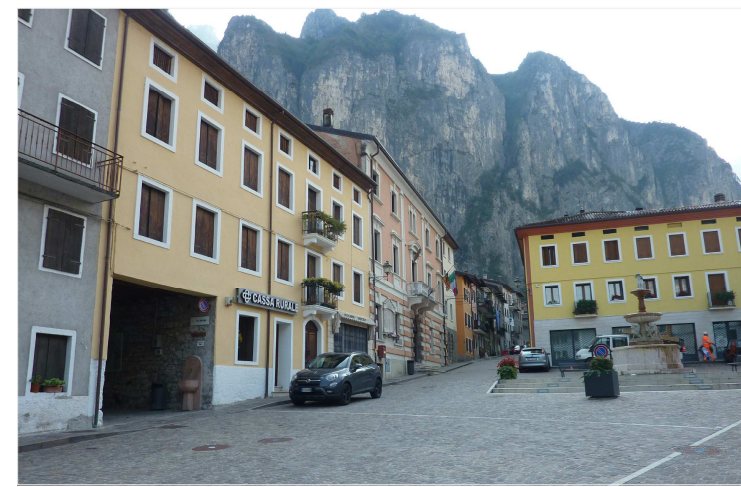
PUNTO 1 e 2: stato di fatto