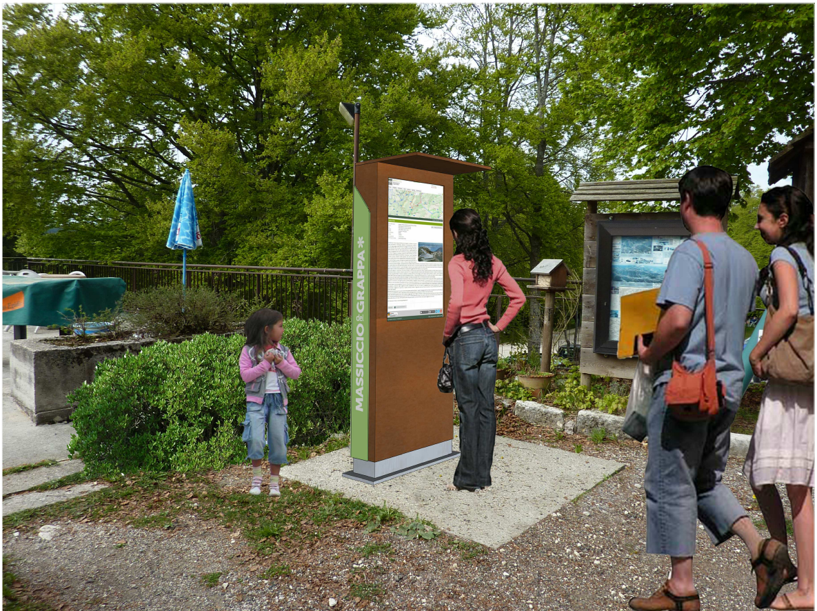
PUNTO 3: Totem interattivo PROGETTO