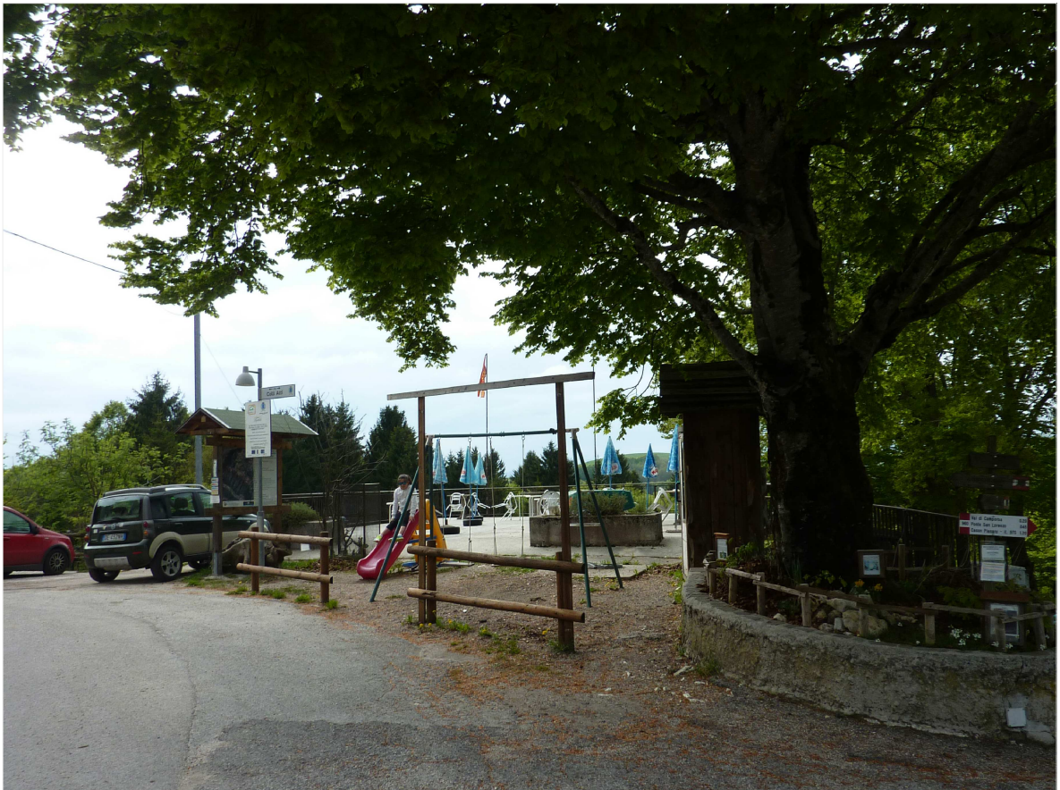
PUNTO 4: STATO DI FATTO