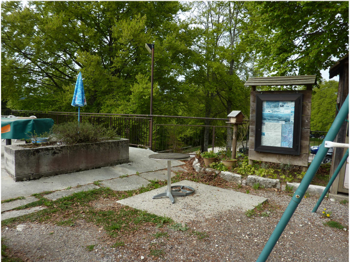
PUNTO 3: STATO DI FATTO