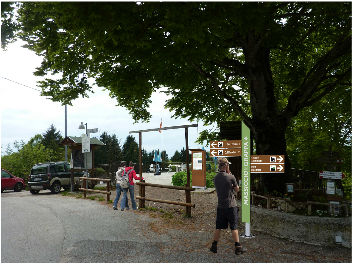
PUNTO 4: Segnaletica PROGETTO

PLANIMETRIA AREA TERRAZZA ALBERGO SAN GIOVANNI POSIZIONE TOTEM E RASTRELLIERA – SCALA 1:100