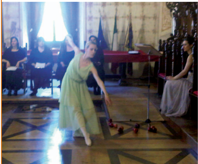
Teatro, danza e letteratura nell'ambito della rassegna "In ville e castelli con Fogazzaro" promossa dalla Provincia e iniziata nell'aprile 2011, con lo spettacolo itinerante "Le stanze di Piccolo Mondo Antico"