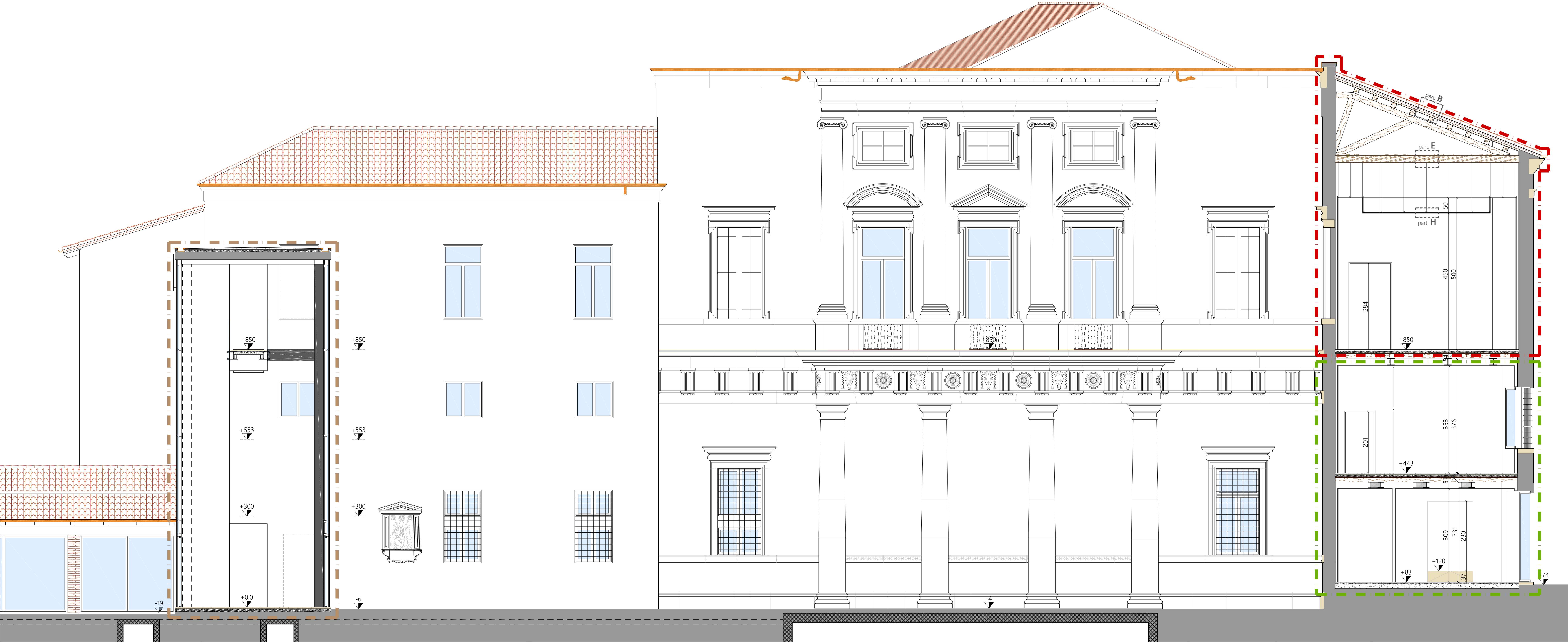
P R O S P E T T O L 1 - L 1 - Cortile Interno lato OVEST -

N.B. MISURE E QUOTE DA VERIFICARE IN SITO