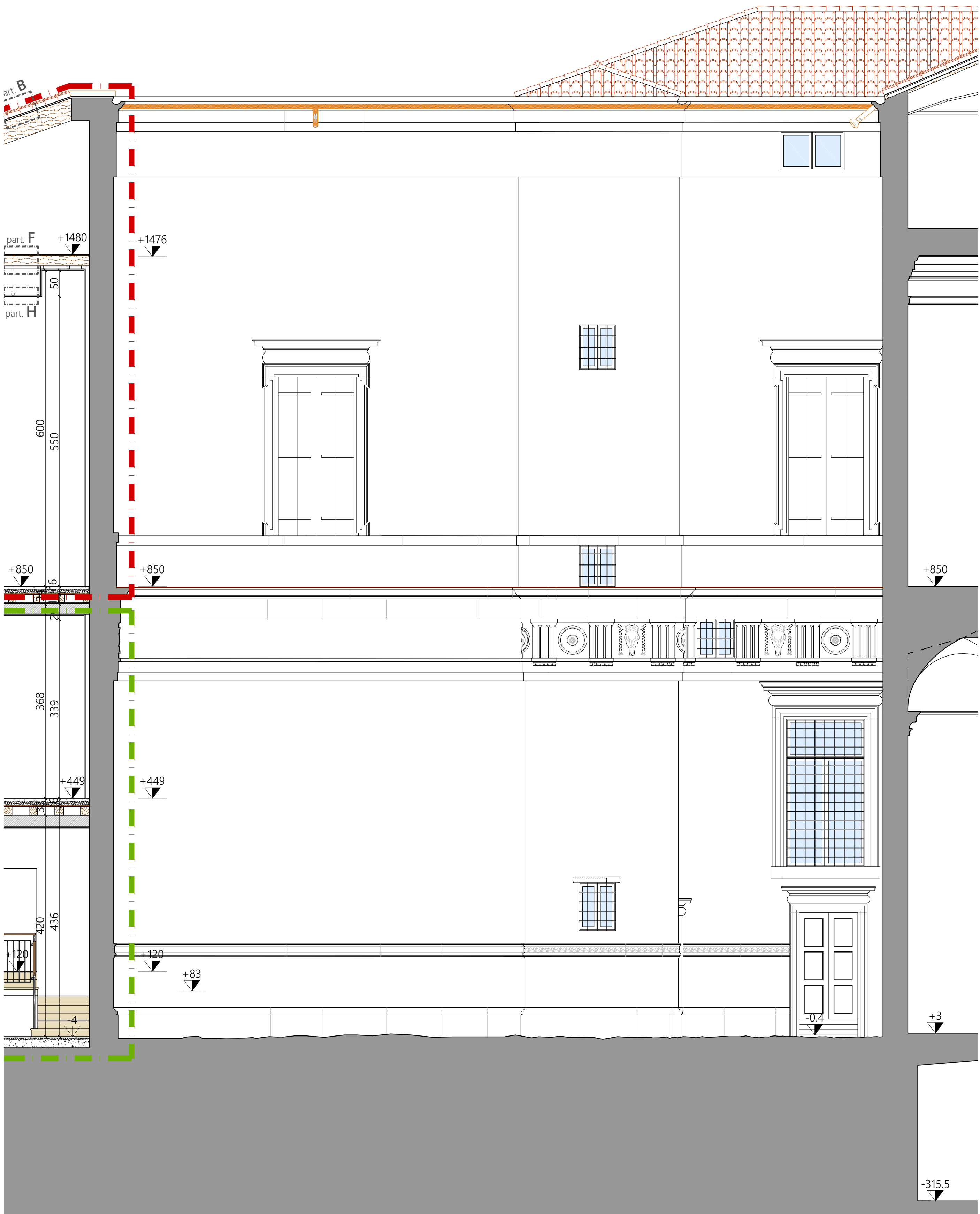
P R O S P E T T O T 5 - T 5 - Cortile Interno lato NORD -