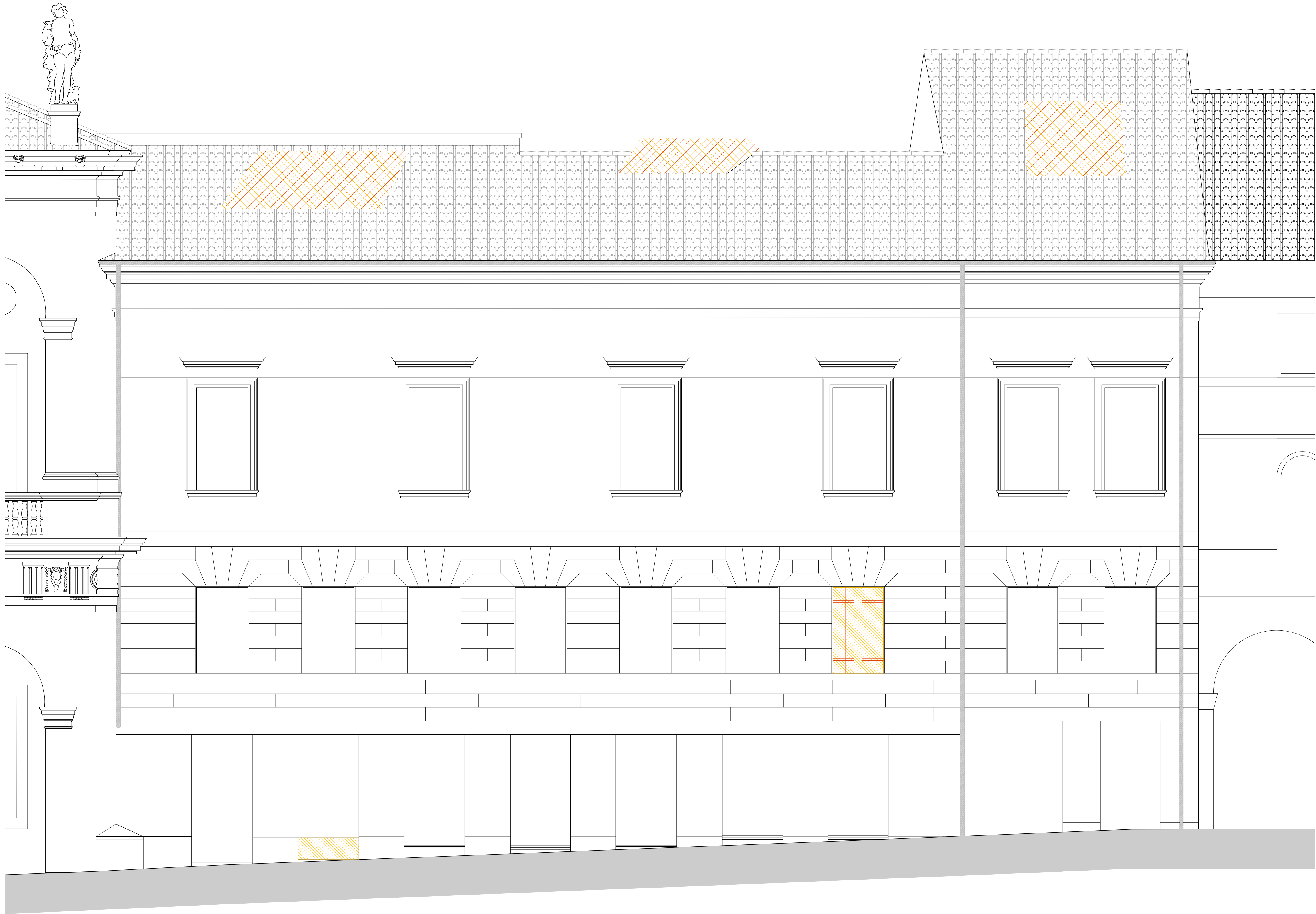
P R O S P E T T O T 1 - T 1 - C o r s o P a l l a d i o -