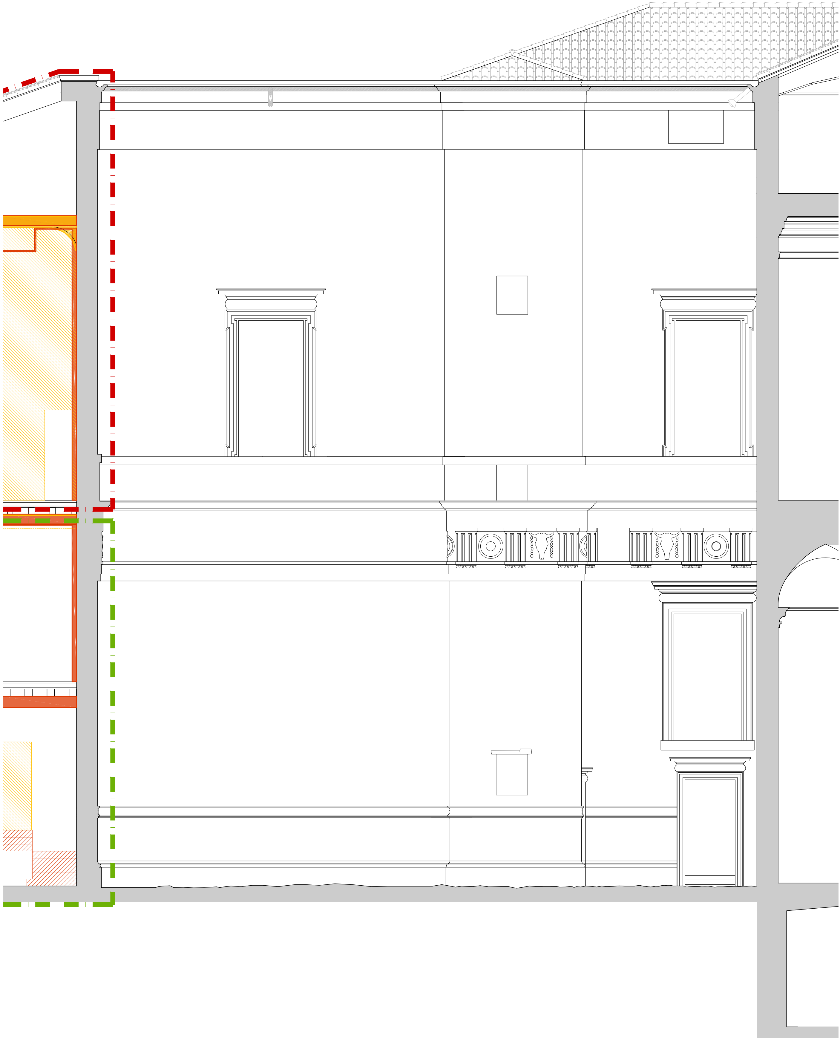
PROSPETTO T 5 - T 5 - Cortile Interno lato NORD -