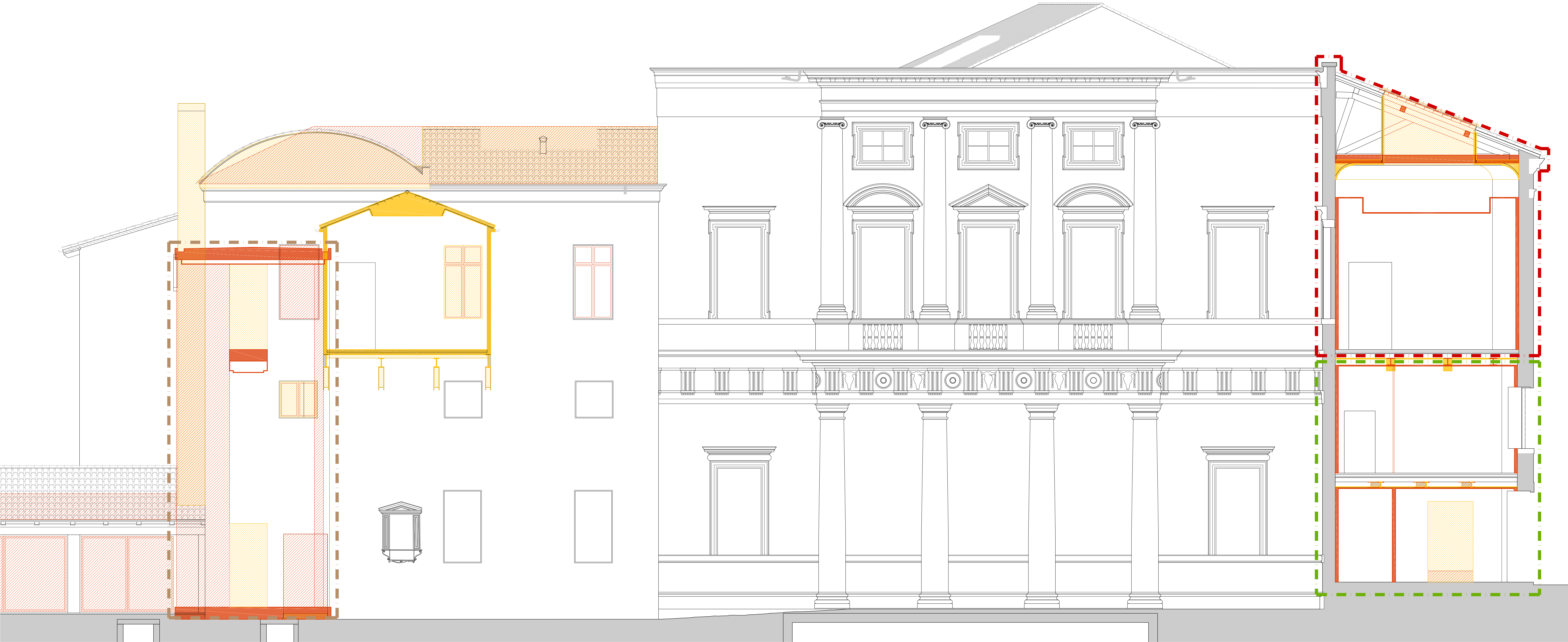
P R O S P E T T O L 1 - L 1 - Cortile Interno lato OVEST -

DEMOLIZIONI COSTRUZIONI DEMOLIZIONI e RICOSTRUZIONI