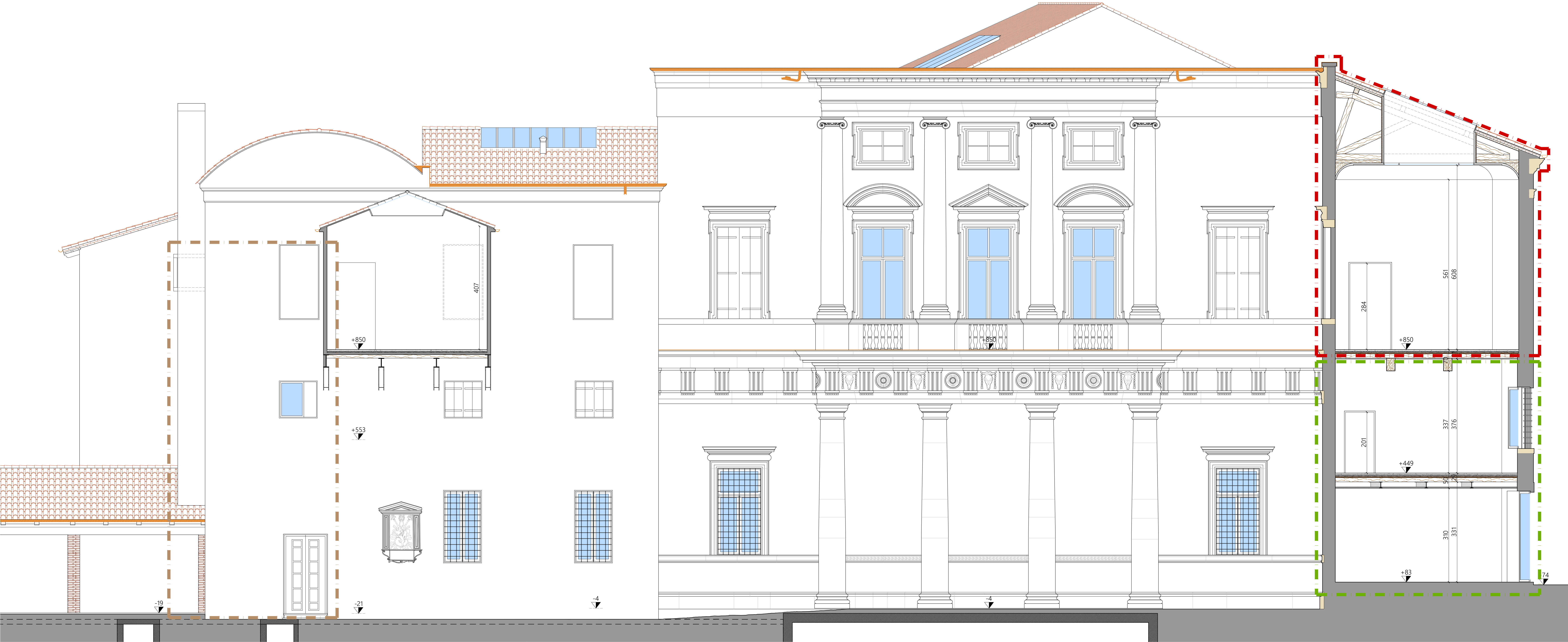
P R O S P E T T O L 1 - L 1 - Cortile Interno lato OVEST -