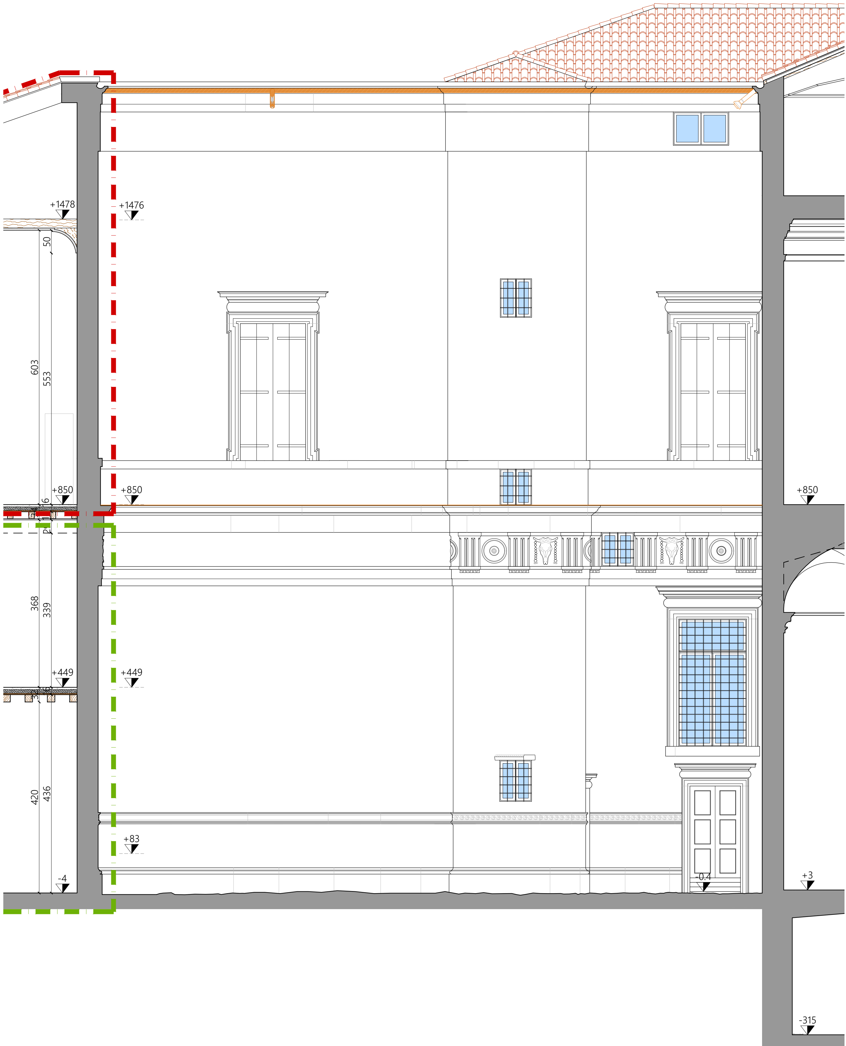
P R O S P E T T O T 5 - T 5 - Cortile Interno lato NORD -