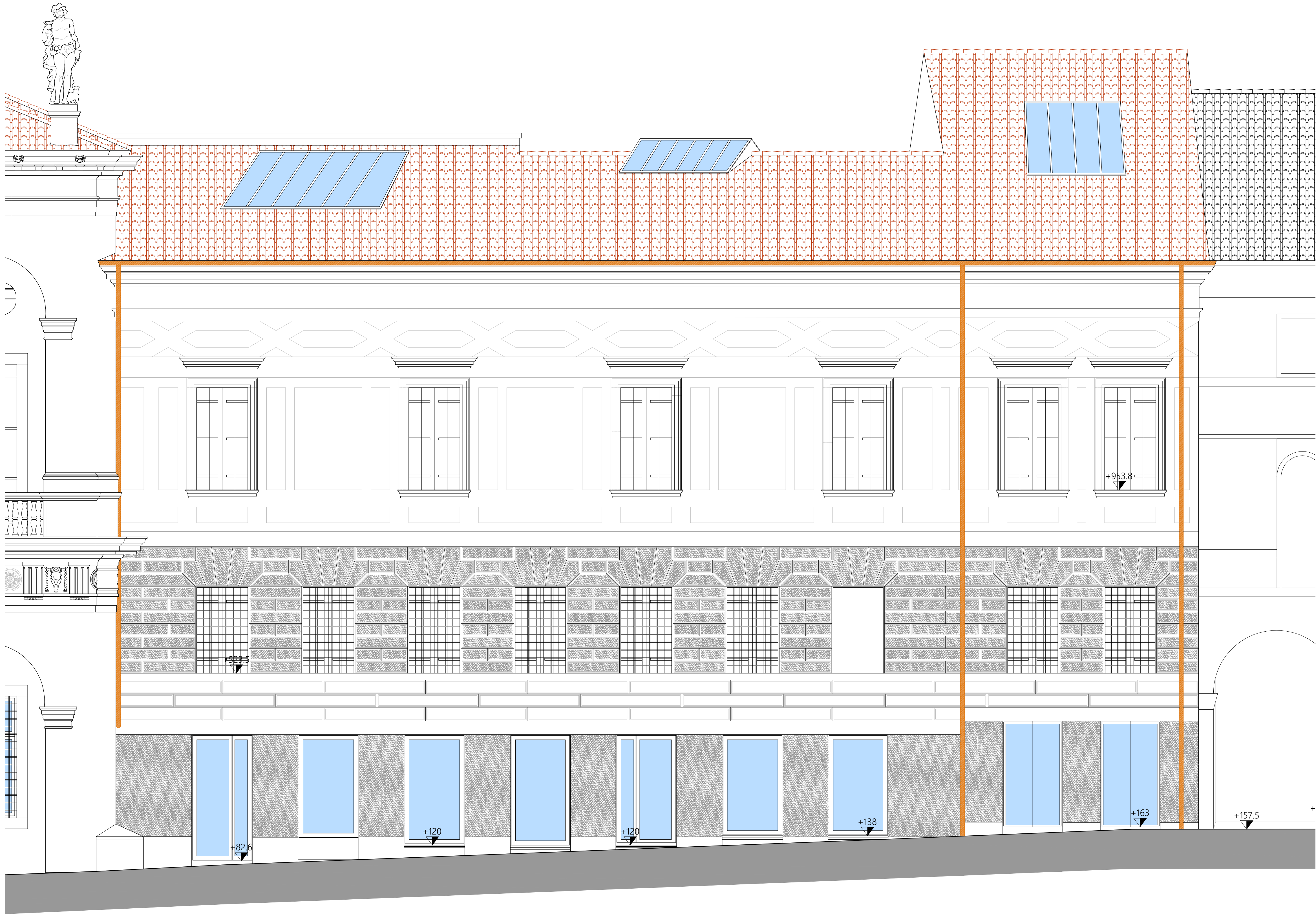
P R O S P E T T O T 1 - T 1 - C o r s o P a l l a d i o -

MUSEI CIVICI DI VICENZA E CONSERVATORIA PUBBLICI MONUMENTI - DIRETTORE SCIENTIFICO: PROF. GIOVANNI C. F. VILLA