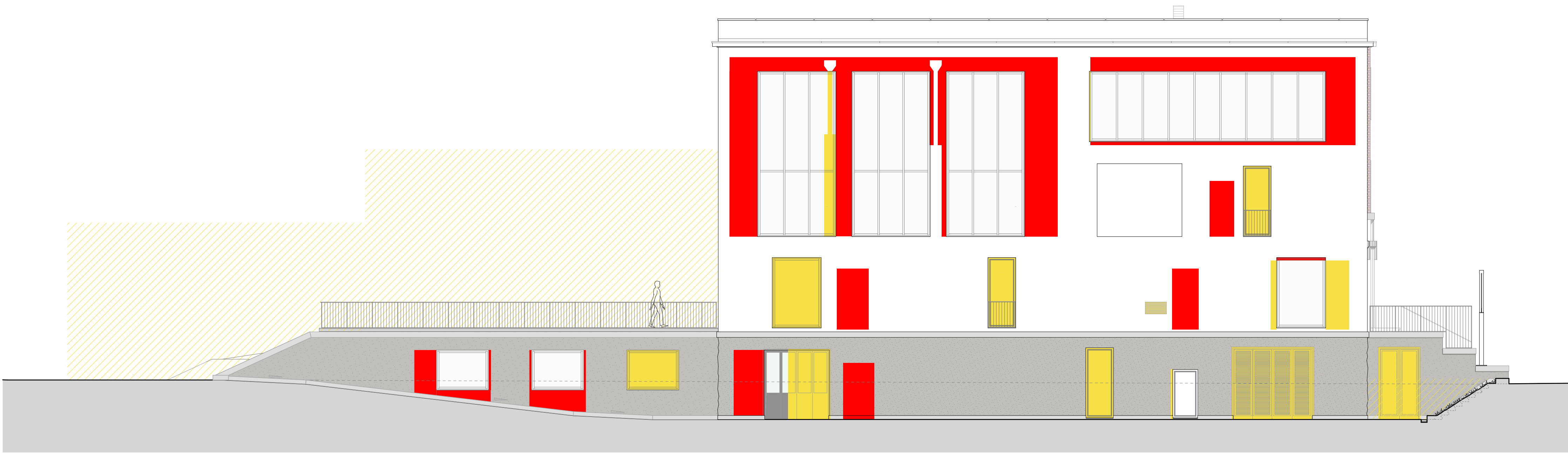
Prospetto nord scala 1:100