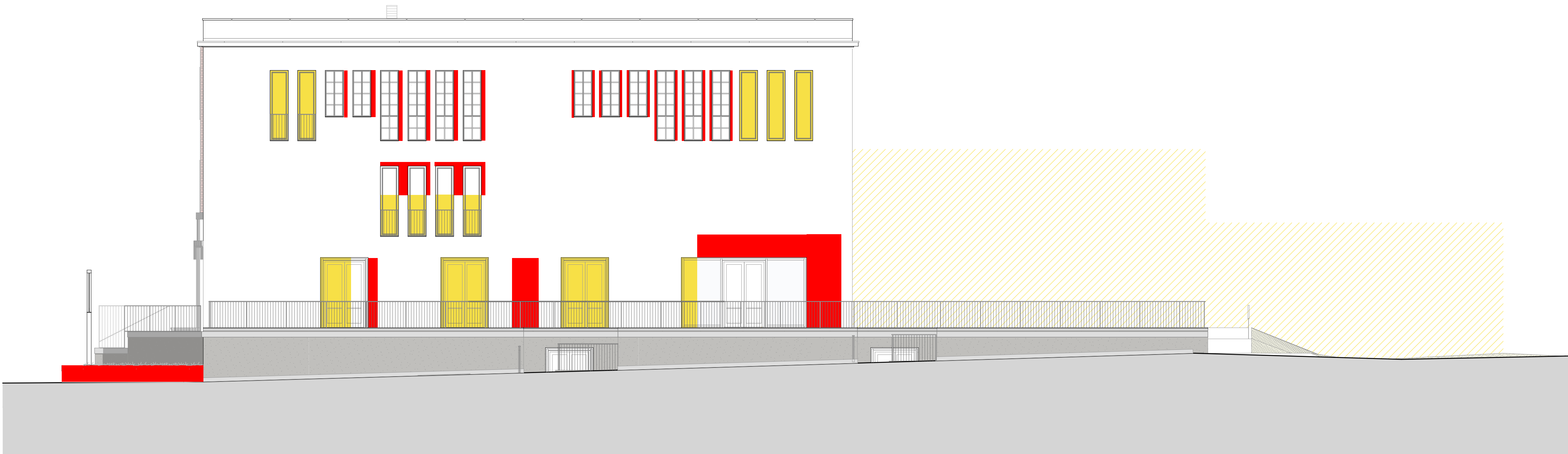
Prospetto sud scala 1:100