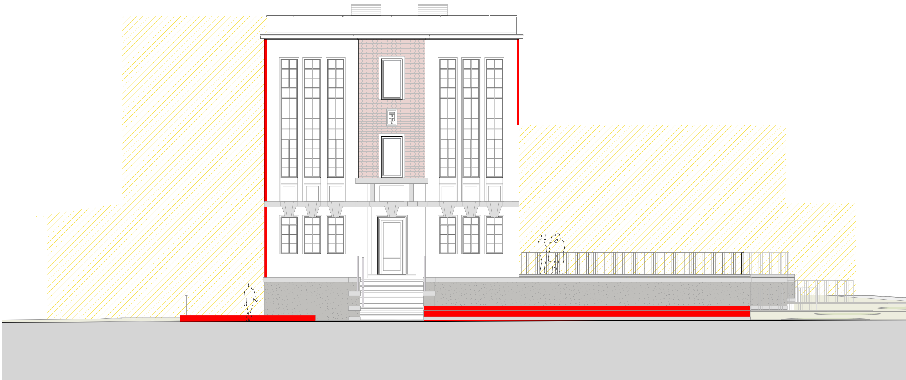
Prospetto ovest scala 1:100