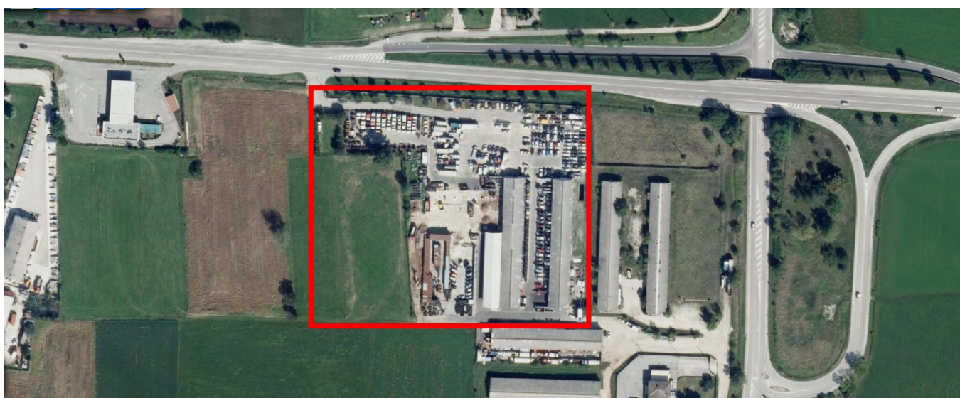
Ortofoto del sito