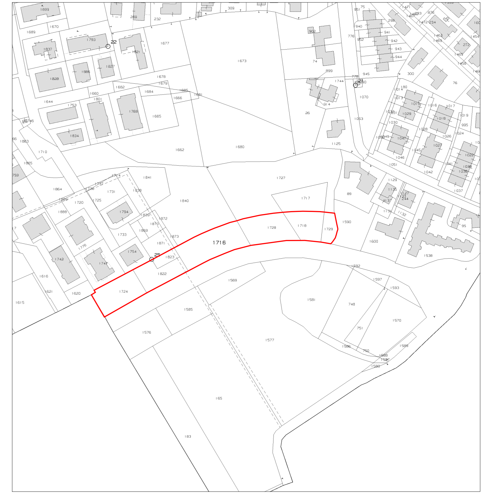
ESTRATTO CATASTALE SCALA 1:2000 Comune di Torri di Quartesolo Foglio 11 mappale 1724, 1822, 1823, 1716, 1728, 1718, 1729