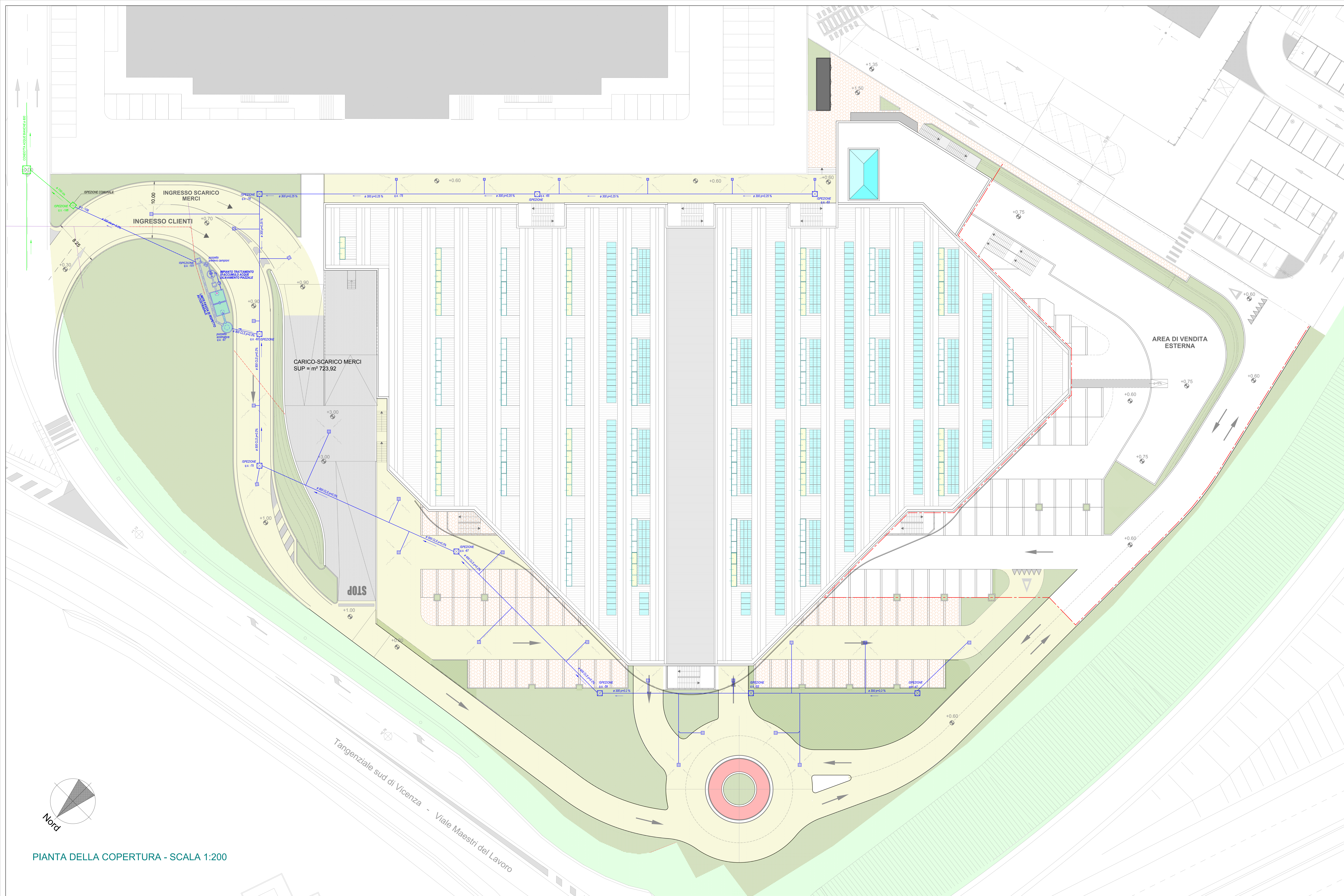
PIANTA DELLA COPERTURA - SCALA 1:200