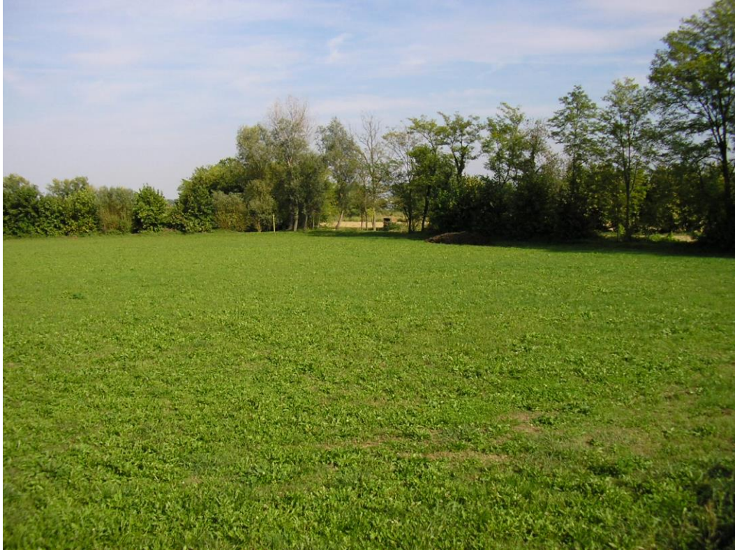
Foto B.4 Vista ad est della zona dalla quale si effettuerà un attraversamento sul Fiume Tesina.