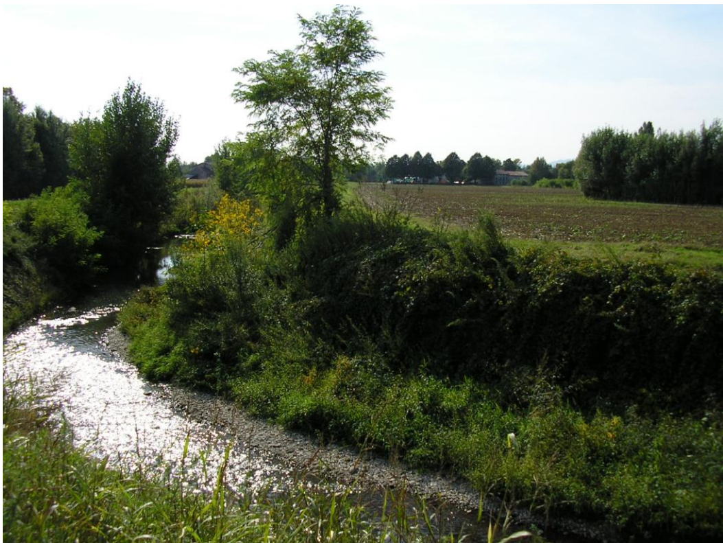
Foto B.5 Vista sul Fiume Tesina verso sud-ovest nel punto in cui si effettuerà un attraversamento con spingitubo.