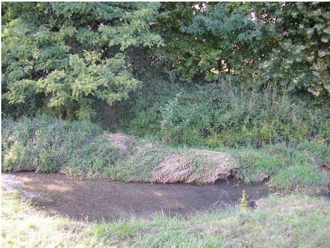
Foto B.9 Punto nel quale si effettuerà un attraversamento della Roggia Longhella.