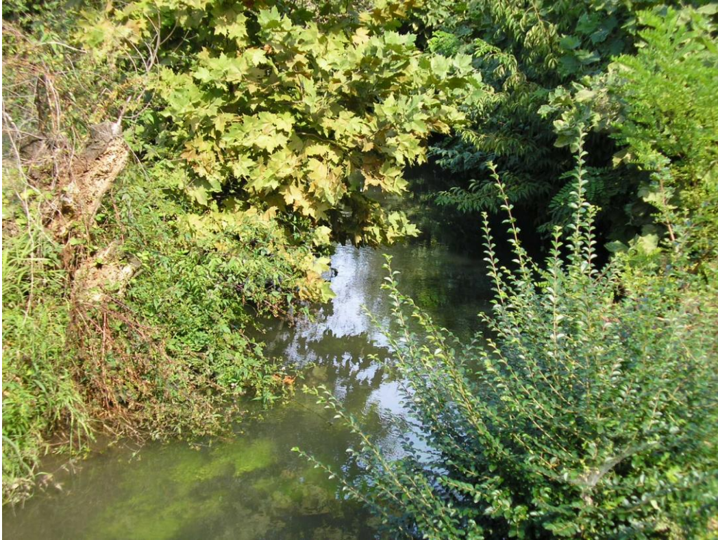
Foto B.2 Attraversamento di un canale di scolo in prossimità della strada comunale Poianella nei pressi della stazione di pompaggio.