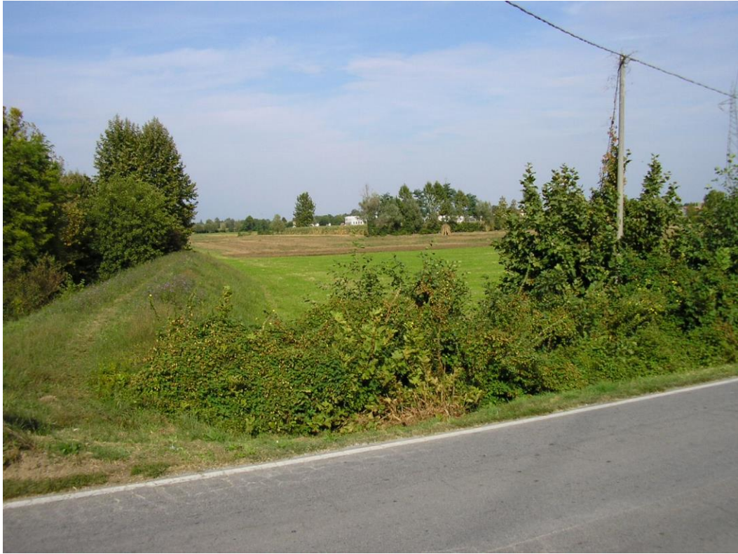
Foto B.8 Punto nel quale si effettuerà un attraversamento della strada comunale di Lupia in corrispondenza dell'incrocio con la Roggia Longhella.