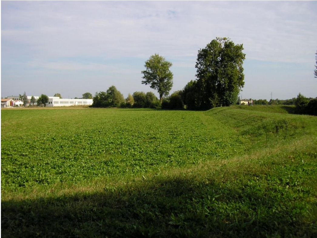
Foto B.10 Punto nel quale si effettuerà un attraversamento della Roggia Longhella, si notino gli argini della roggia.