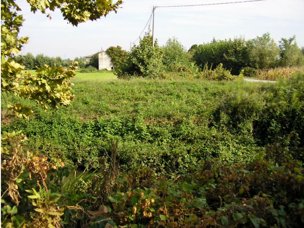
Foto B.7 Punto nel quale si effettuerà un attraversamento della Roggia Longhella in corrispondenza dell'incrocio con la strada comunale di Lupia.