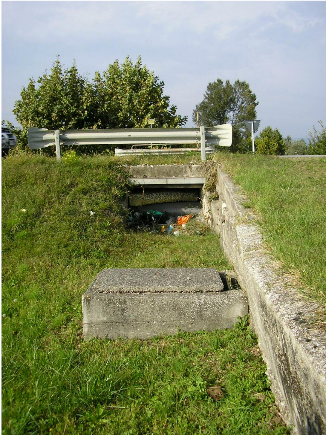
Foto B.13 Punto nel quale si effettuerà un attraversamento della strada comunale utilizzando la tubazione in calcestruzzo già posta in opera, vista verso nord.