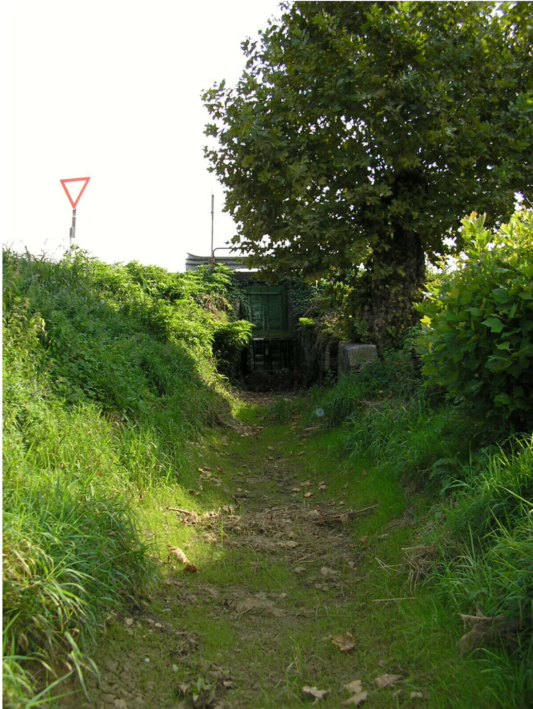
Foto B.14 Punto nel quale si effettuerà un attraversamento della strada comunale utilizzando la tubazione in calcestruzzo già posta in opera, vista verso sud.