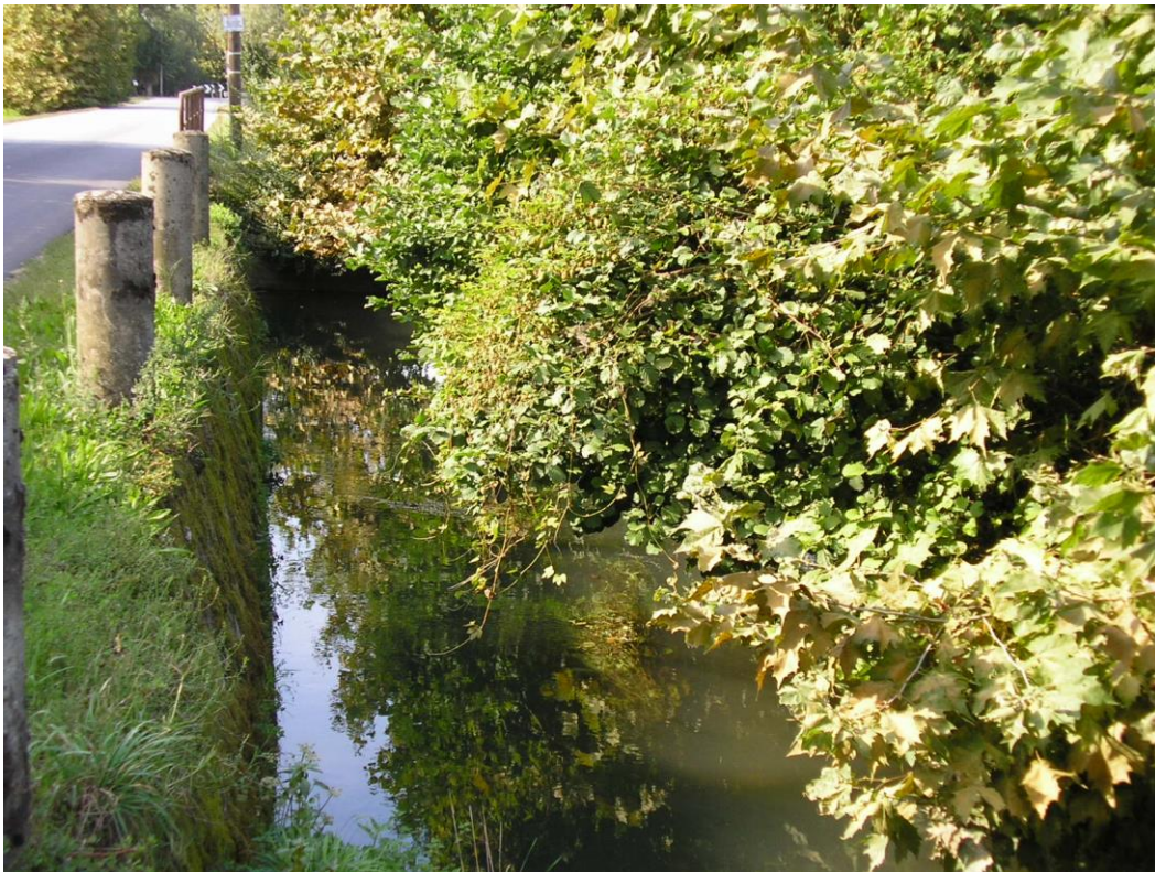
Foto B.3 Attraversamento di un canale di scolo in prossimità della strada comunale Poianella nei pressi della stazione di pompaggio.