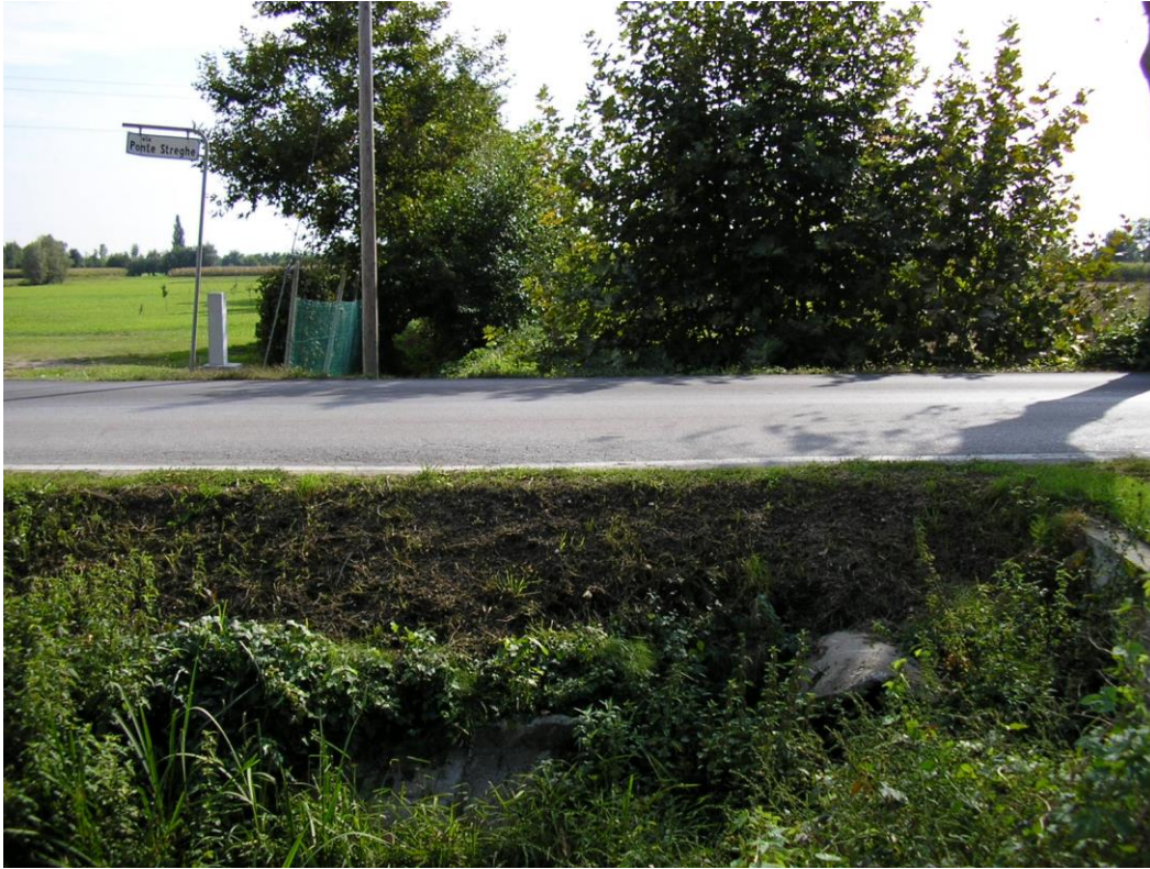
Foto B.6 Punto nel quale si effettuerà un attraversamento della strada comunale in via Ponte delle Strie.