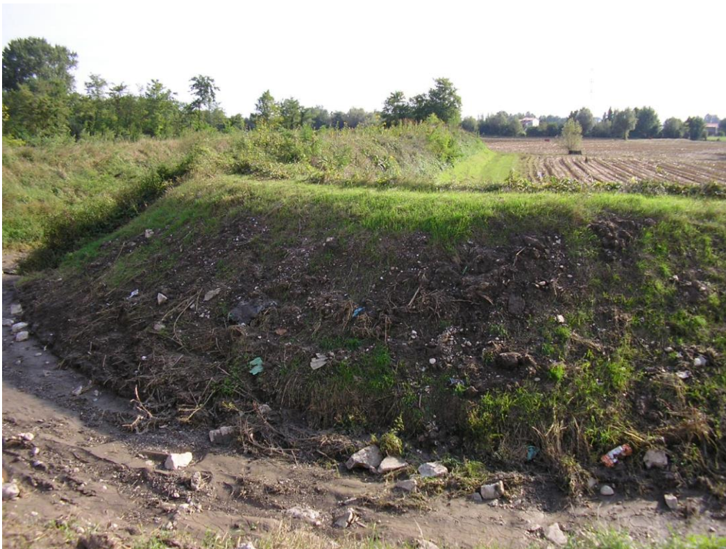
Foto B.11 Punto nel quale si effettuerà un attraversamento del Fiume Tesina a monte della diramazione della Roggia Comera. Il fiume è secco a causa di lavori di sistemazione fatti a monte.