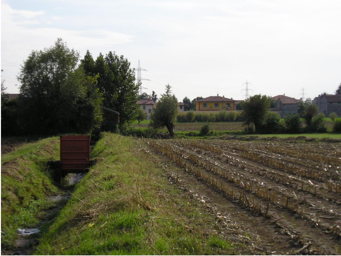
Foto B.15 Punto nel quale si effettuerà un attraversamento del torrente Cornera.