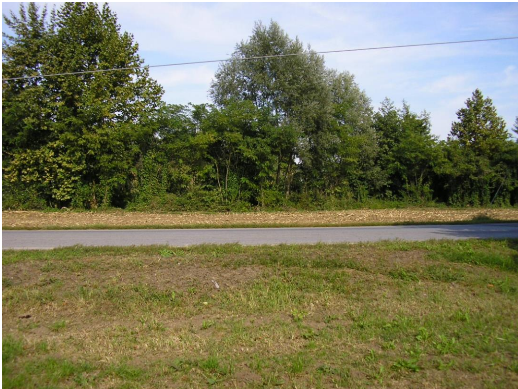
Foto B.1 Attraversamento della strada comunale di Poianella nei pressi della nuova stazione di pompaggio.

Per inquadrare maggiormente il territorio si propongono una serie di fotografie. Queste immagini sono particolarmente significative in quanto rappresentano punti particolari per la costruzione della rete, ossia attraversamenti di canali o strade.