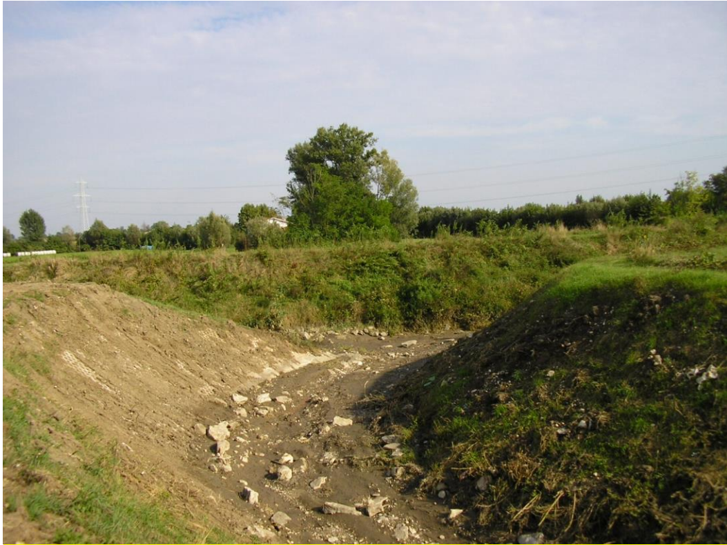
Foto B.12 Punto nel quale si effettuerà un attraversamento del Fiume Tesina a monte della diramazione della Roggia Comera. Il fiume è secco a causa di lavori di sistemazione fatti a monte.