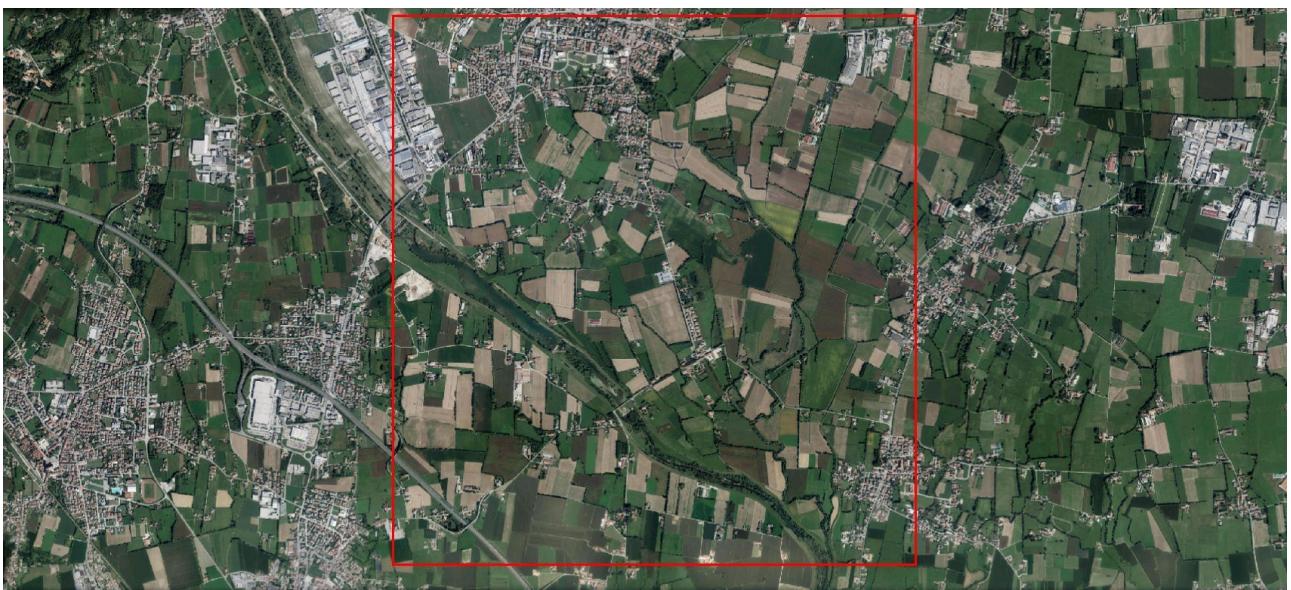
Ortofoto del sito