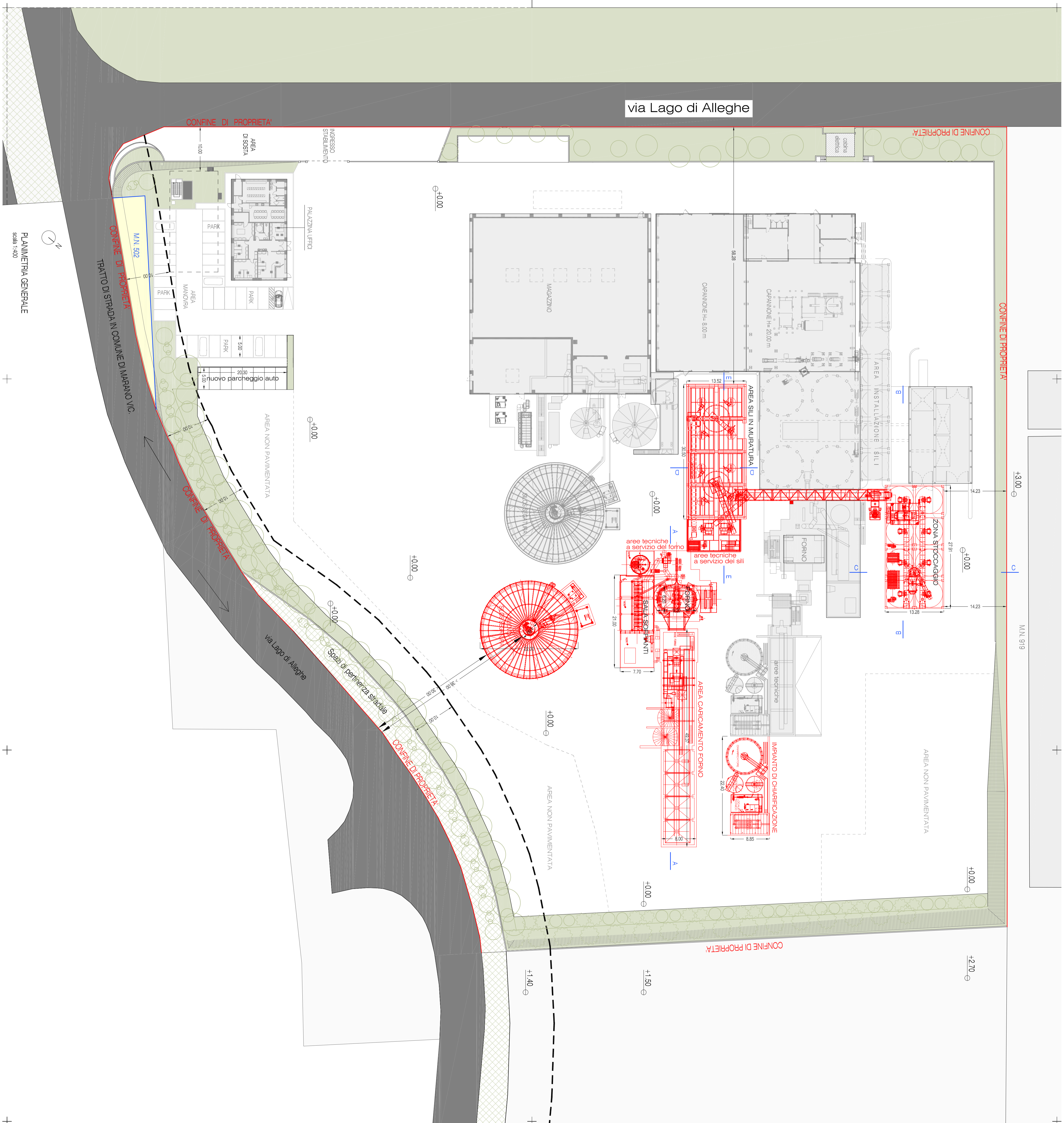
PLANIMETRIA GENERALE scala 1:400