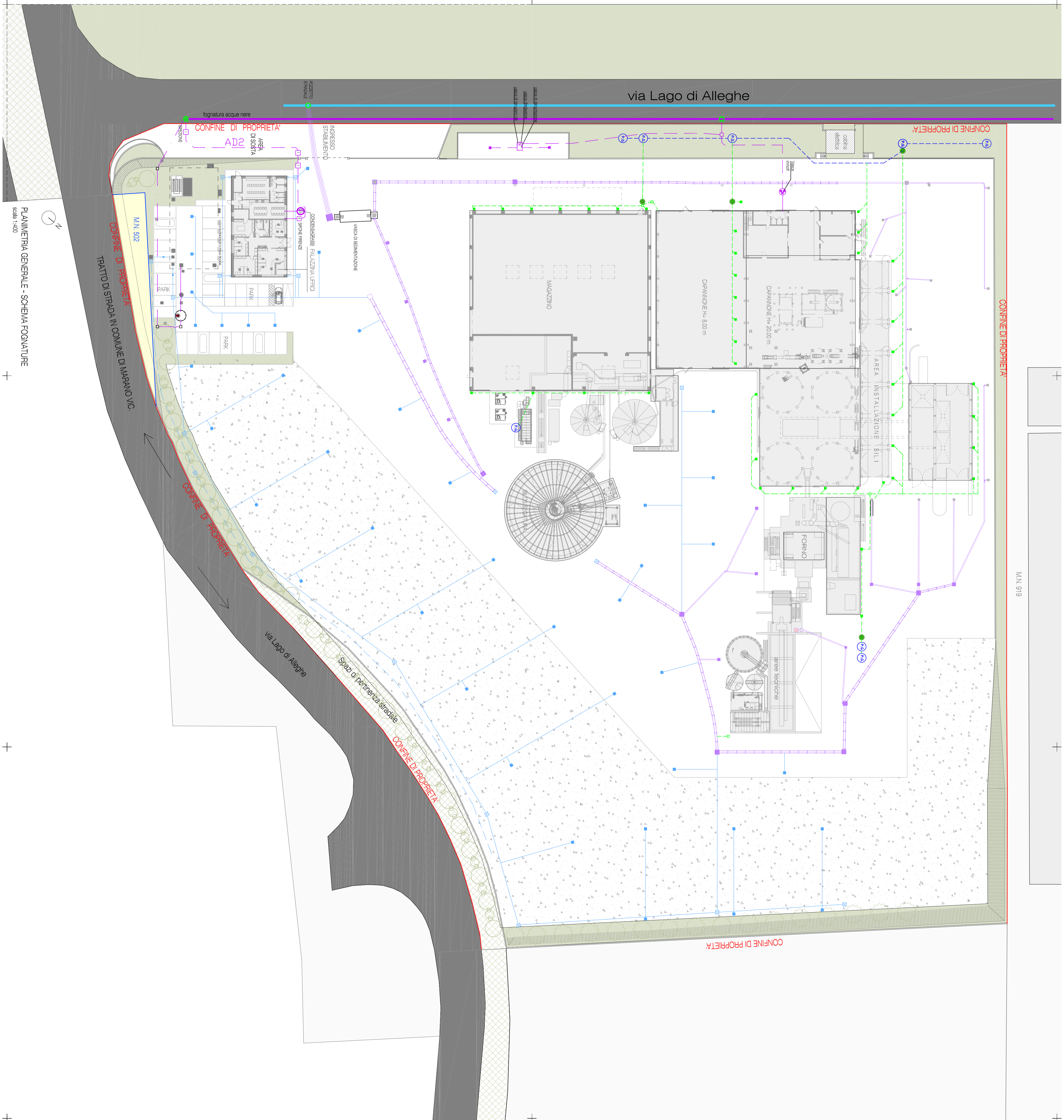
PLANIMETRIA GENERALE - SCHEMA FOGNATURE Scala 1:400