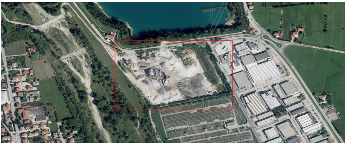
Ortofoto del sito