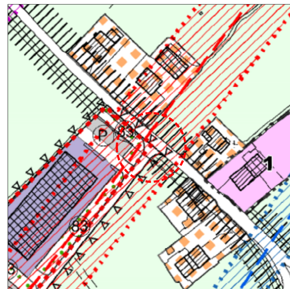
ESTRATTO PIANO DEGLI INTERVENTI N. 1 - Terza fase