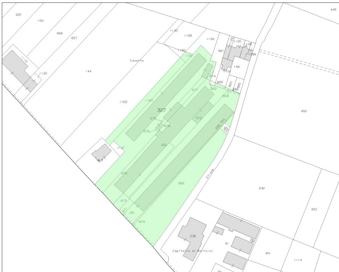
Estratto catastale centro zootecnico esistente