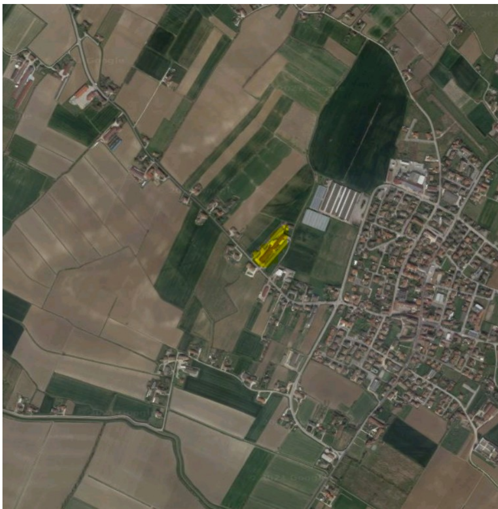
Foto aerea localizzazione allevamento – Comune di Pojana Maggiore (VI)

Come è possibile osservare dall'immagine sottostante, l'area in cui è presente l'allevamento è una zona E agricola, caratterizzata dalla presenza di coltivazioni di seminativi e di colture arboree. Inoltre, sono presenti altre realtà di allevamenti zootecnici, indice del fatto che la vocazionalità della zona è prevalentemente agricolo-produttiva.