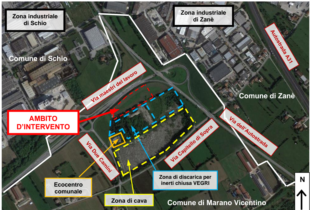
Figura 2: Aerofoto di inquadramento territoriale (Google Earth). Le linee bianche sono i confini comunali.

Nel Piano degli Interventi del Comune di Marano Vicentino, l'area è classificata come "zona FD) riservata agli impianti tecnologici e ai servizi ambientali".