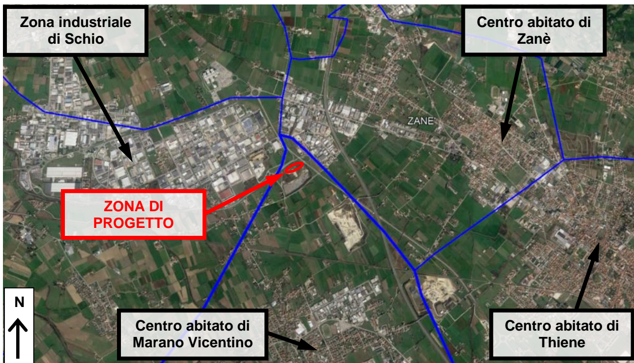
Figura 1: Aerofoto di inquadramento territoriale. Le linee blu rappresentano i confini comunali.

La superficie fondiaria complessiva della zona di progetto è pari a 10.910,20 m 2 , dei quali 3.078,42 m 2 saranno coperti.