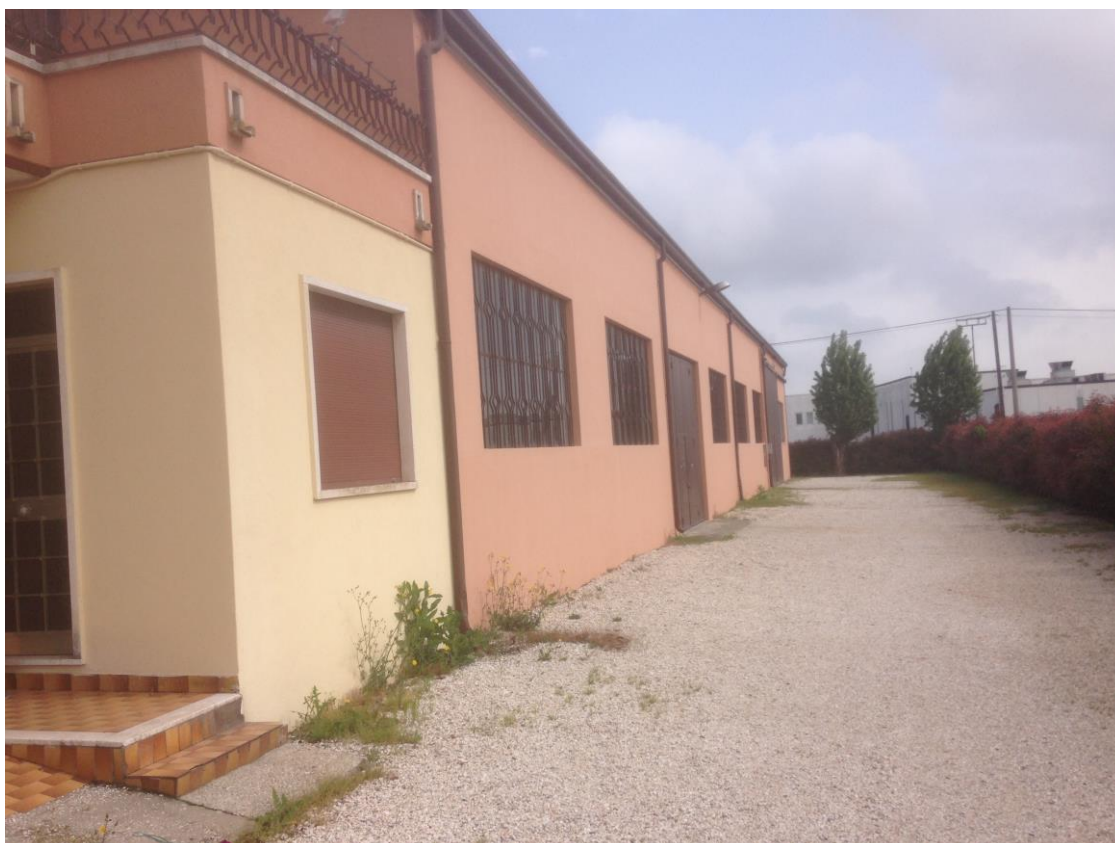
Figura 11: edificio Dalla Barba