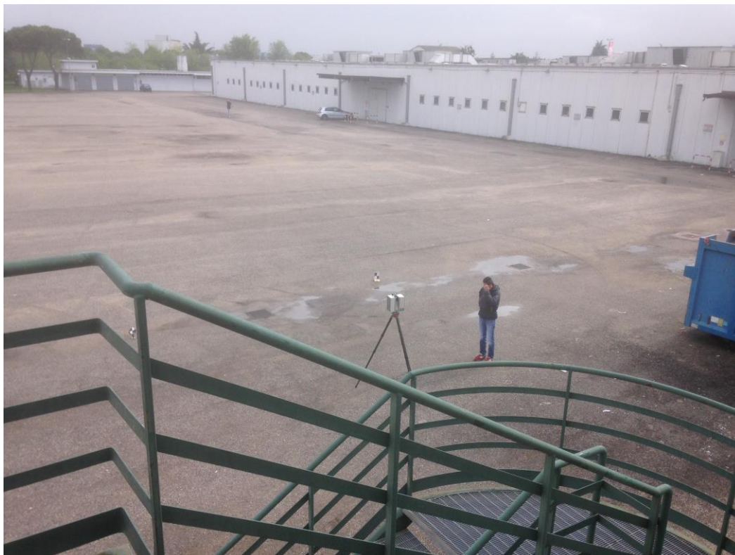
Figura 1: vista piazzale retrostante il negozio Ramonda