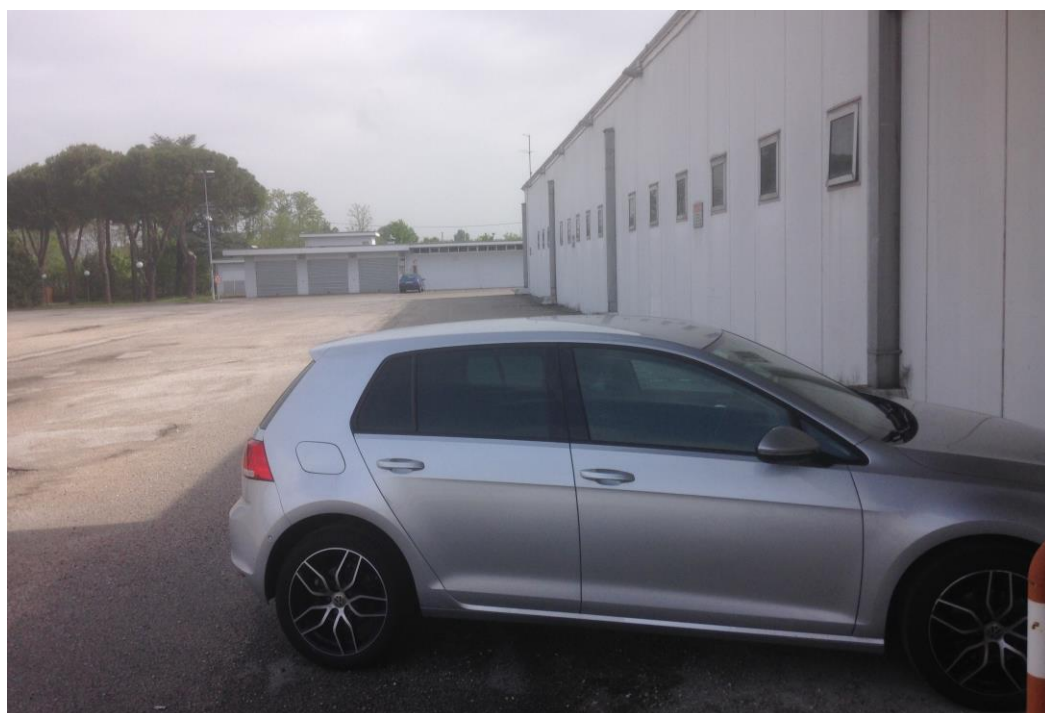
Figura 2: scorcio della facciata nord-ovest