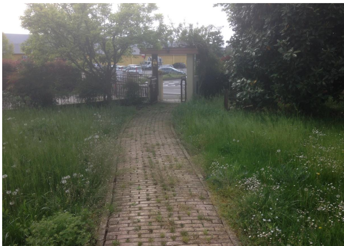
Figura 12: scoperto Dalla Barba su via Bruschi