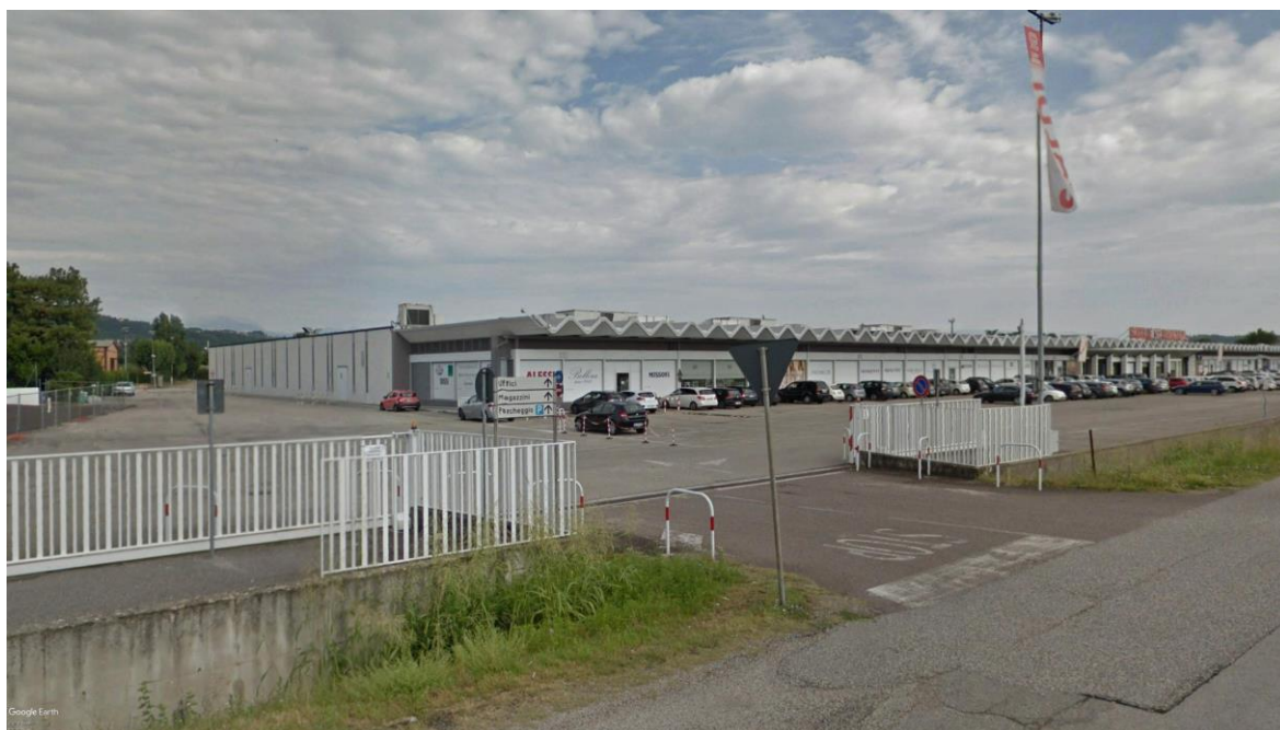
Figura 5: parcheggio antistante al negozio Ramoda