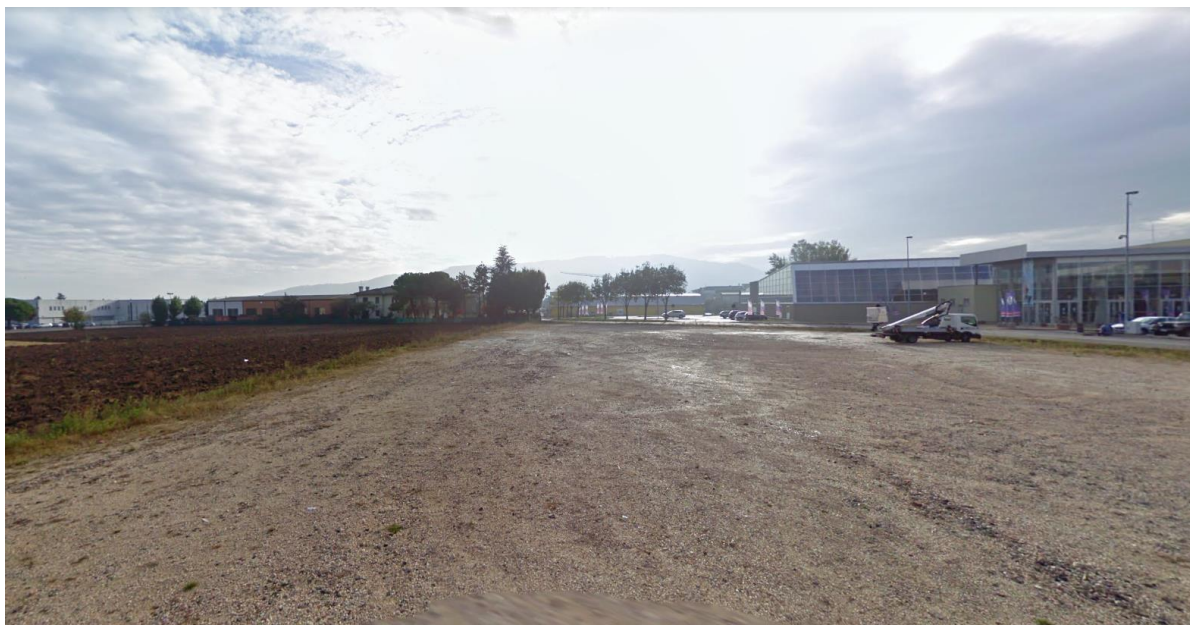
Figura 13: vista del terreno utilizzato attualmente a parcheggio della piscina