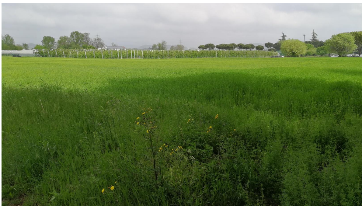
Figura 8: seconda vista sul lotto di terreno di via Bruschi