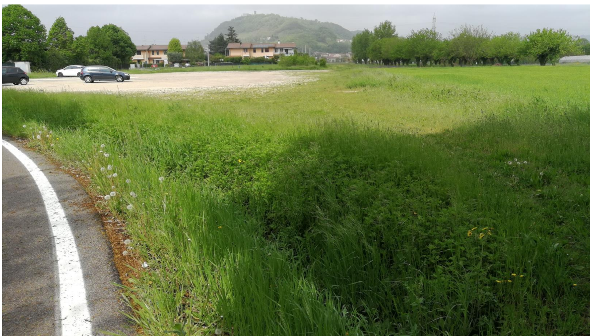
Figura 9: vista lotto di terreno