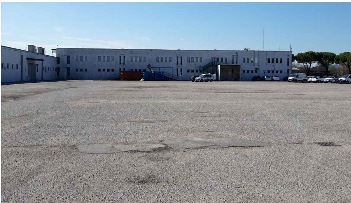
Figura 3: piazzale retrostante con prospetto uffici sullo sfondo