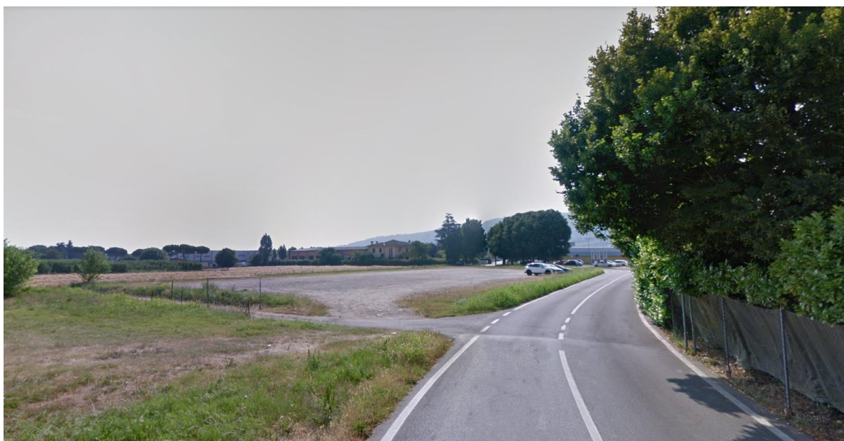
Figura 14: vista del terreno da via Bruschi