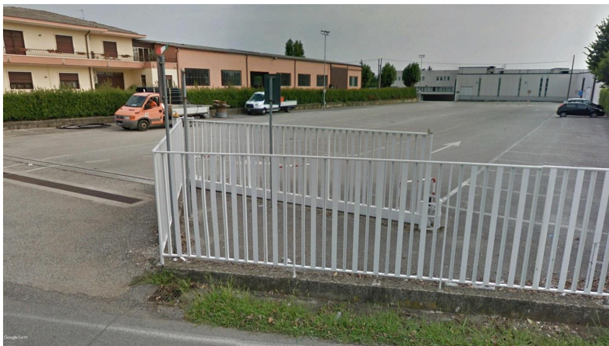
Figura 6: ingresso e piazzale laterale al negozio Ramonda da via Bruschi