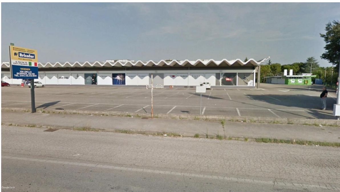
Figura 4: scorcio prospetto fronte strada S.R. 11