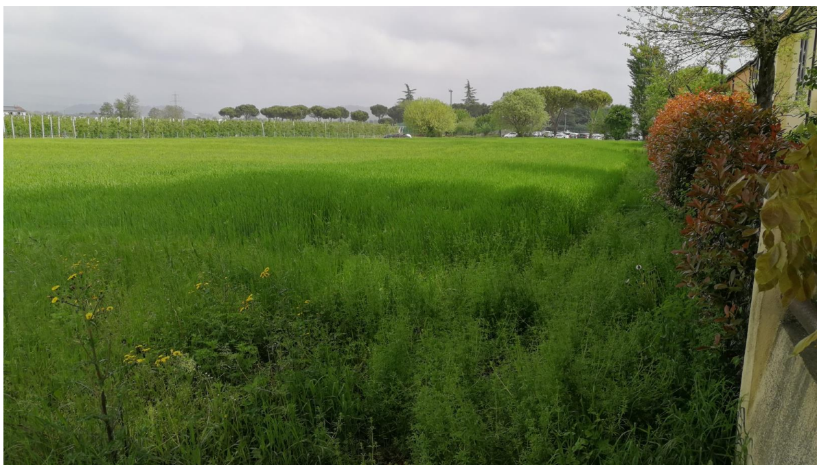
Figura 7: vista lotto di terreno in via Bruschi