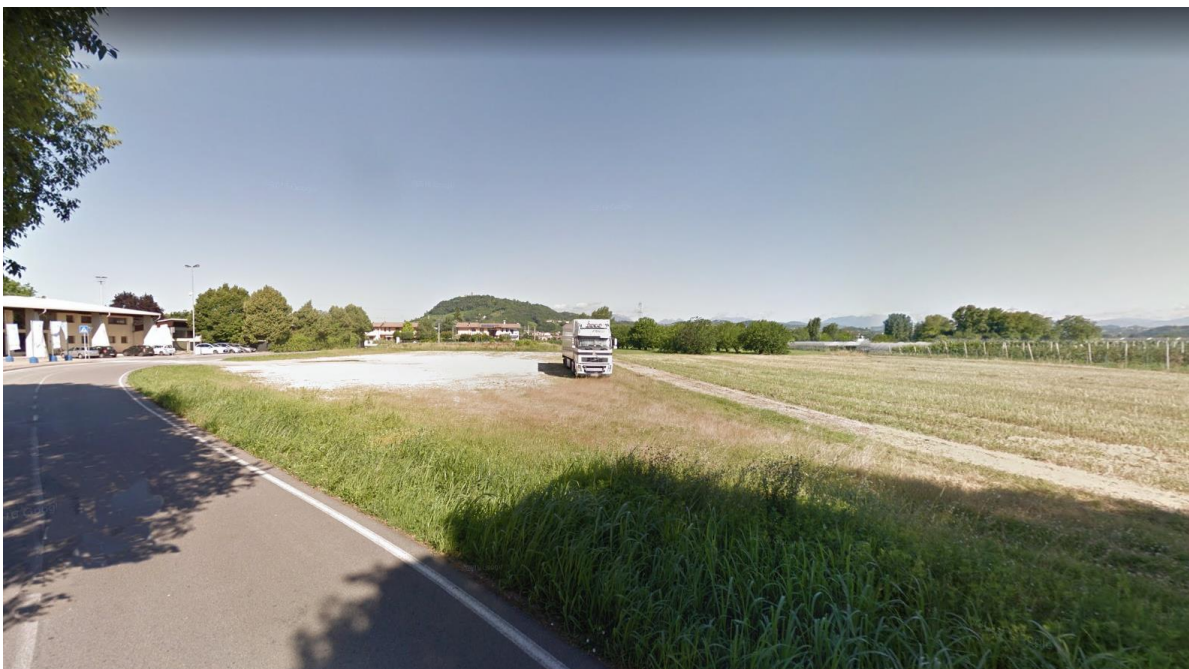
Figura 10: vista lotto di terreno utilizzato come parcheggio per la piscina