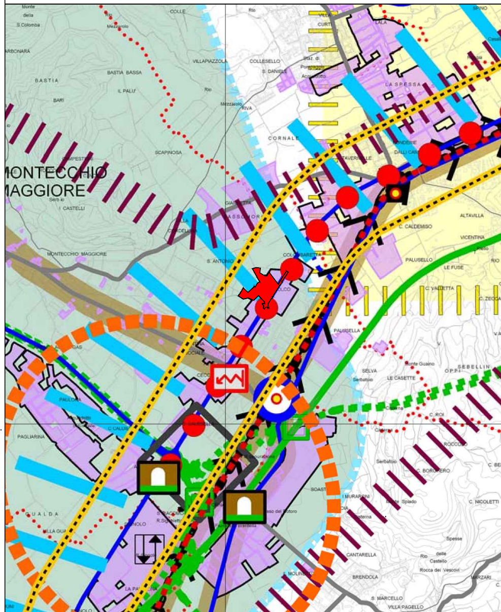
4.1.b - Carta del sistema insediativo infrastrutturale