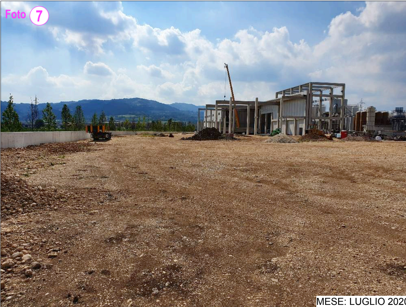
MESE: LUGLIO 2020