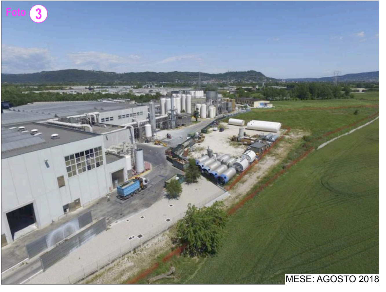
MESE: AGOSTO 2018