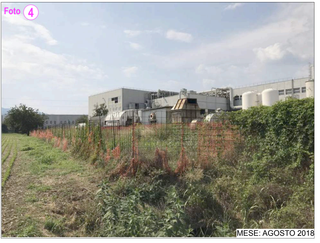
MESE: AGOSTO 2018