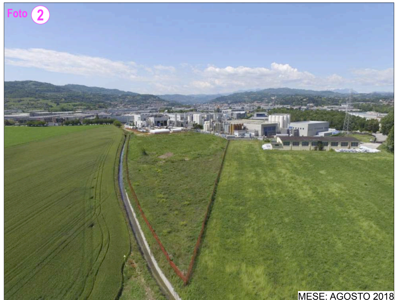
MESE: AGOSTO 2018