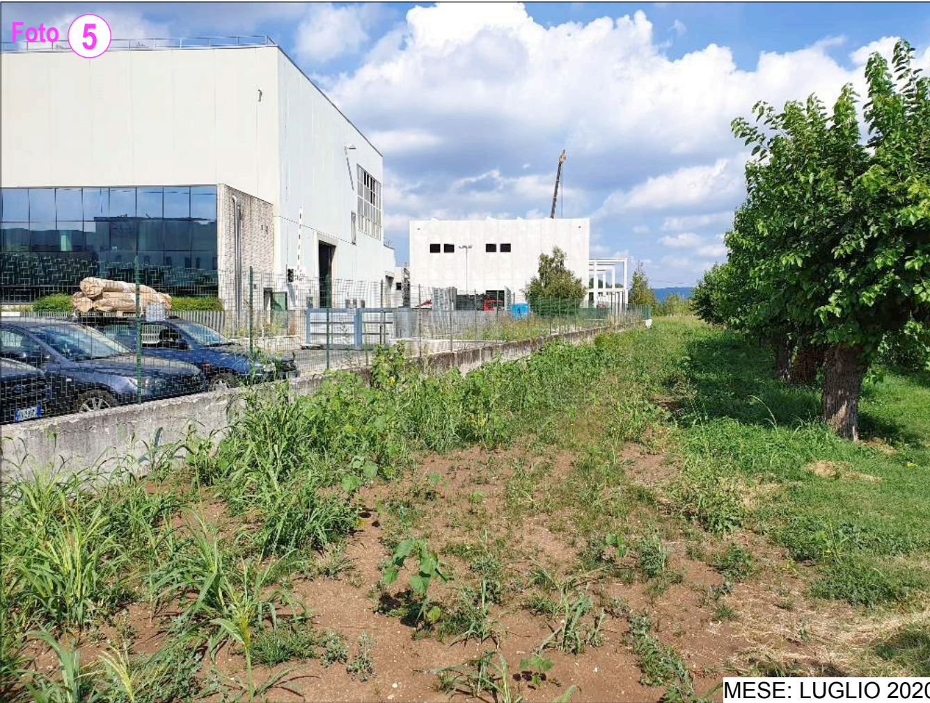
MESE: LUGLIO 2020