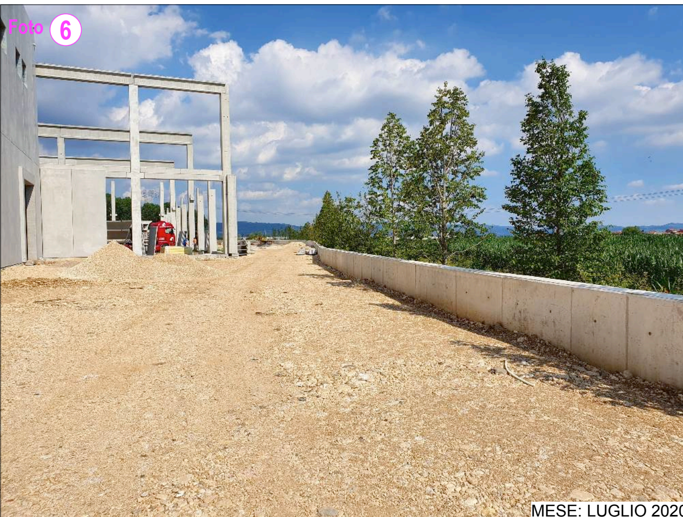
MESE: LUGLIO 2020