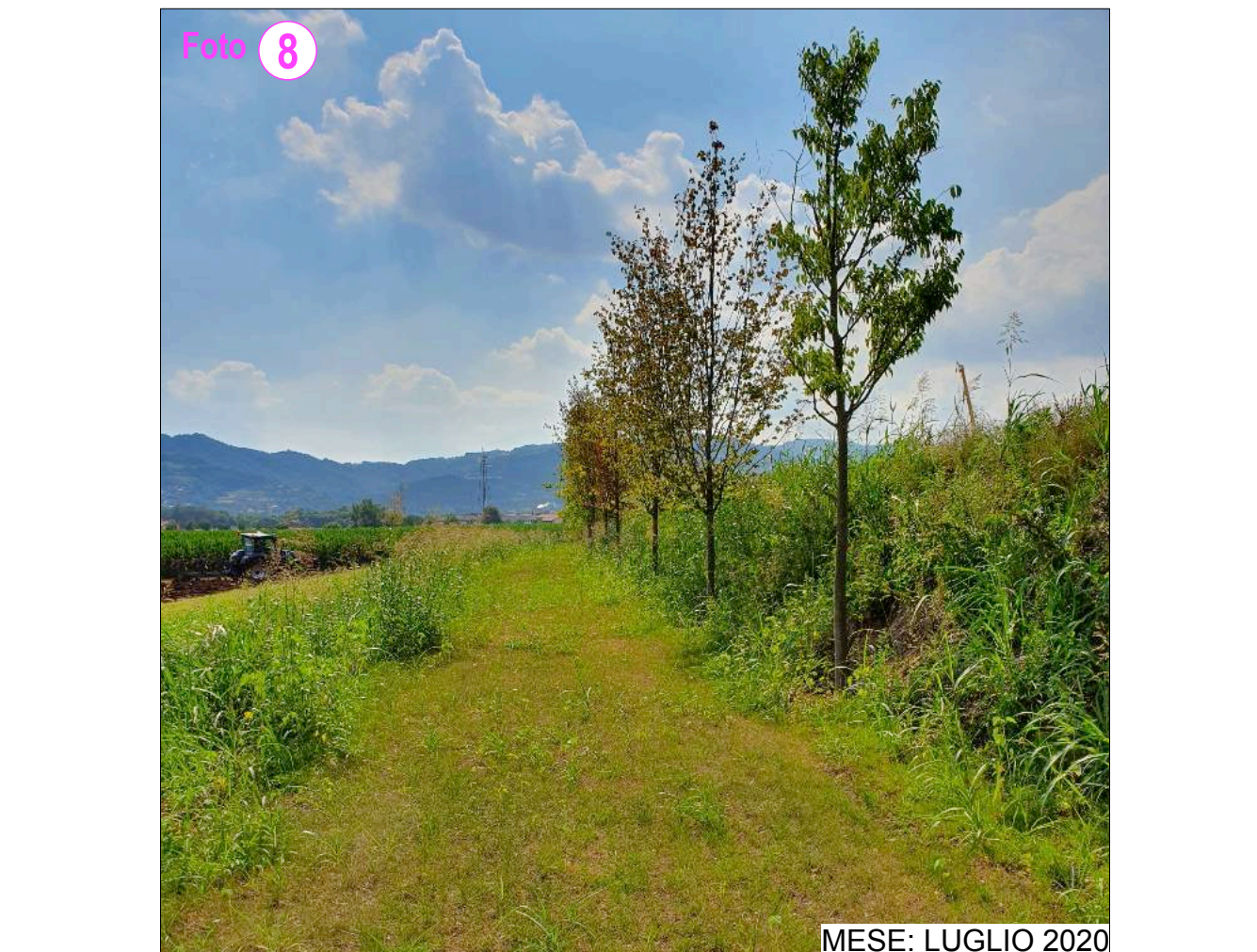
MESE: LUGLIO 2020