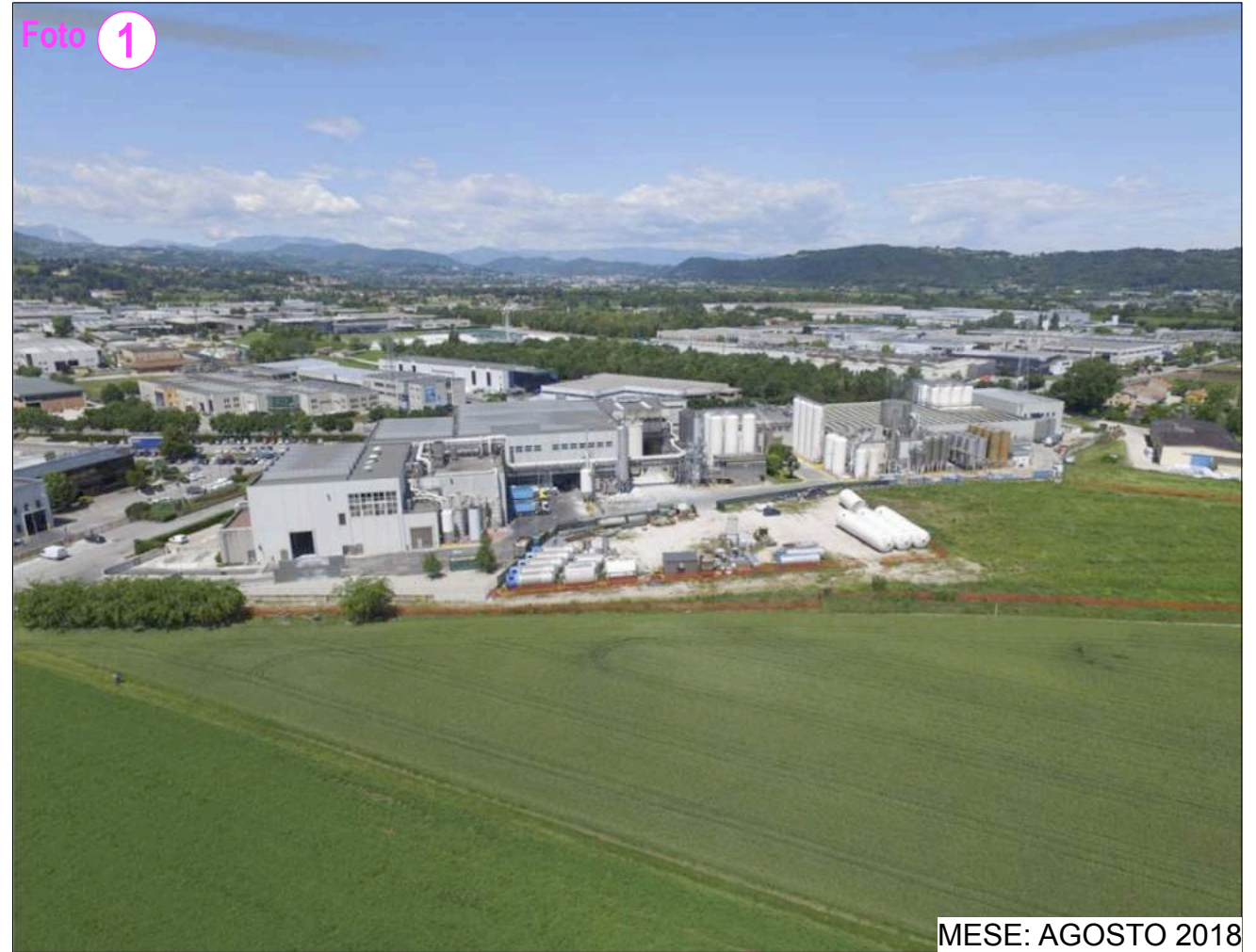
MESE: AGOSTO 2018