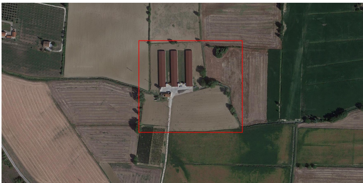
Ortofoto del sito