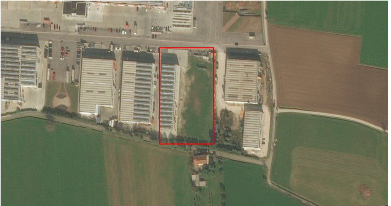
Ortofoto del sito

Domicilio fiscale e Uffici: Palazzo Godi - Nievo, Contra' Gazzolle 1 – 36100 VICENZA