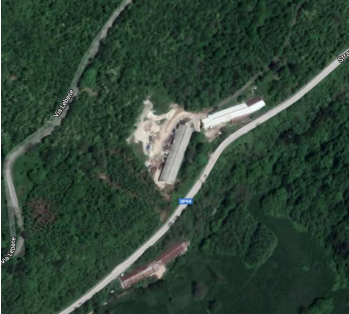
Fig. 1 Veduta aerea del centro zootecnico

Nell'analisi progettuale è stato scelto di utilizzare il color "bianco-grigio" per ridurre l'impatto cromatico del nuovo inserimento. Se la copertura venisse fatta di altro colore ad esempio rosso o testa di moro, comporterebbe un elevato contrasto di colore rispetto ai fabbricati limitrofi e si ritiene che il colore bianco/grigio si armonizzi al meglio con l'architettura circostante.