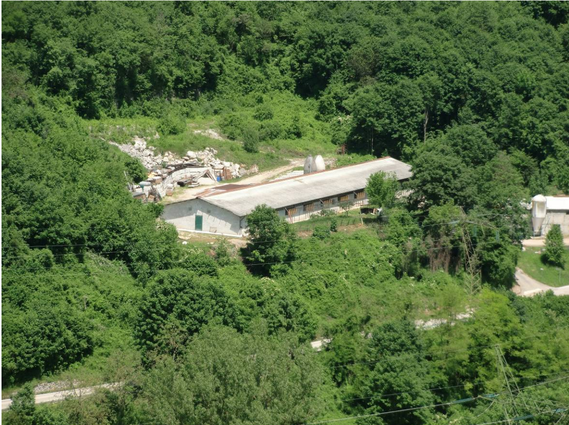
Foto panoramica della zona