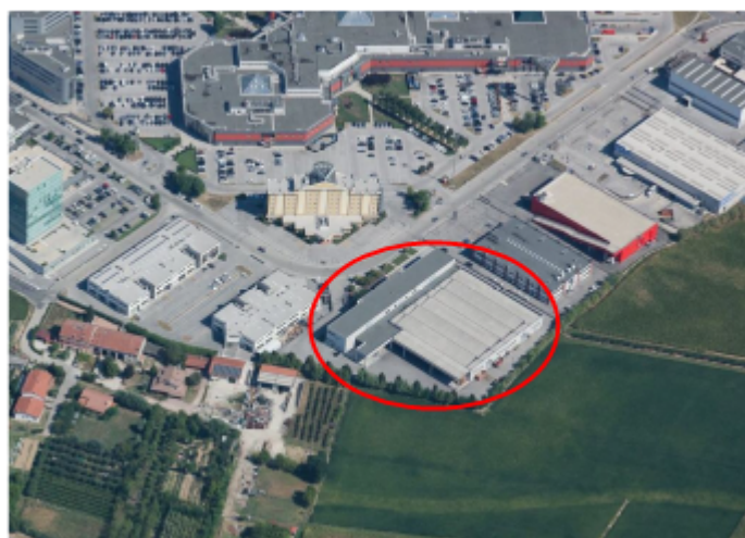
Vista da Sud verso Nord con evidenziato l'edificio oggetto di intervento.

di tutti i sottoservizi a rete, quali: linea acque nere/fognatura, metanodotto, e servizio acquedotto, energia elettrica.