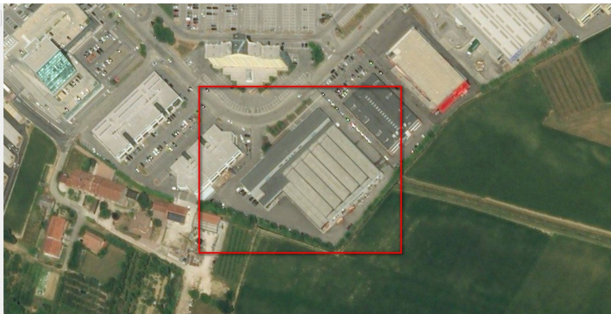
Ortofoto del sito

Domicilio fiscale e Uffici: Palazzo Godi - Nieve, Contra' Gazzolle 1 – 36100 VICENZA