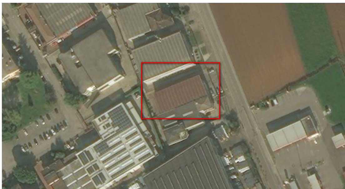
Ortofoto del sito