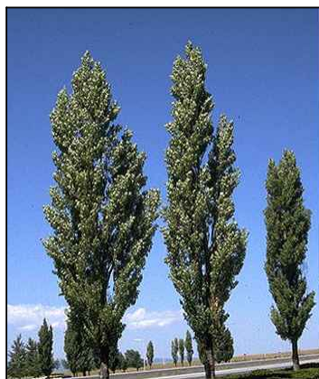
PIOPPO CIPRESSINO "POPULUS NIGRA"