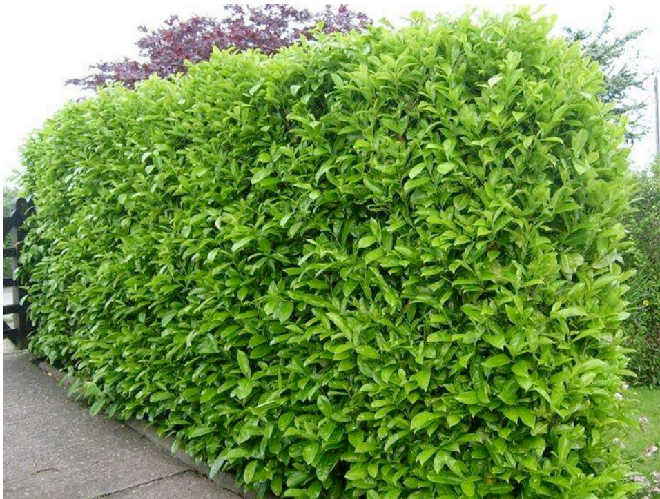
Esempio di siepe di lauro ben sviluppata

L'intervento sarà realizzato nella fascia verde perimetrale dell'impianto (sulla quale insiste il filare alberato) lati sud ed ovest affacciati sull'aperta campagna che hanno uno sviluppo lineare complessivamente pari a circa 150 m.