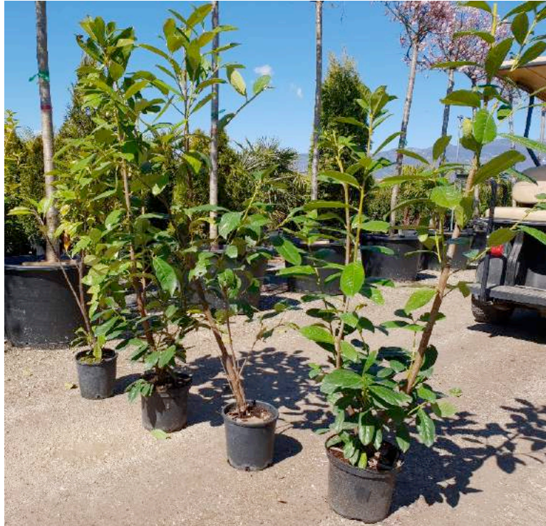
Esemplari di lauro dell'età di 2 anni

L'intervento prevede pertanto la piantumazione di circa 300 esemplari complessivamente. A distanza di 2 anni dall'impianto si otterrà una siepe ben sviluppata dell'altezza di 170÷180 cm, ideale per ottenere l'effetto di mascheramento voluto.