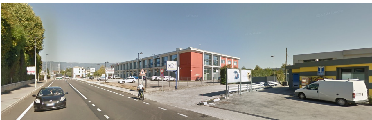
Vista sud-ovest del fabbricato esistente da Via Mazzini