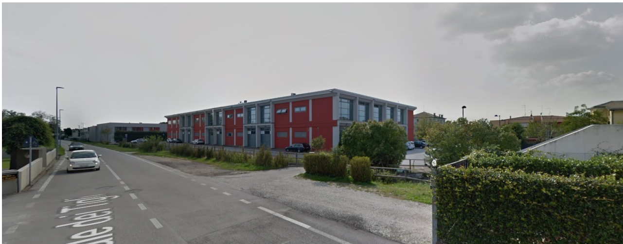
Vista nord-est del fabbricato esistente da Viale dei Tigli