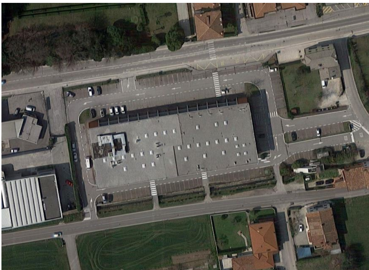
Ortofoto del fabbricato esistente – non in scala

Arch. Carmen Gazzola via Marzarotto n. 6 - 36061 Bassano del Grappa (VI) PIVA 03754250243 - tel. 3286823466