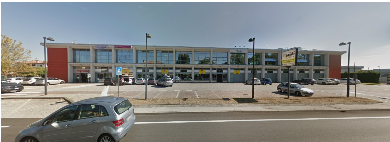
Vista ovest del fabbricato esistente da Via Mazzini – ampliamento della superficie di vendita al piano terra