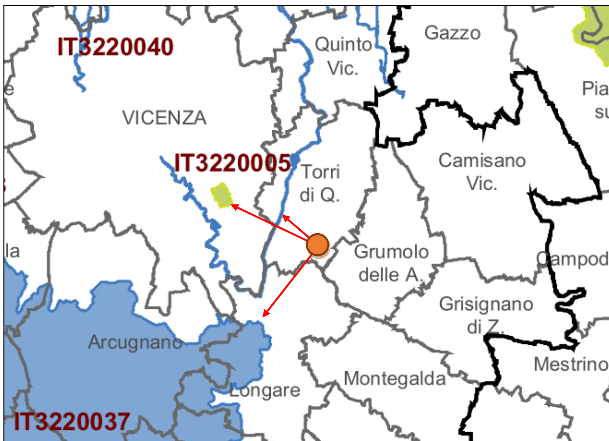
Individuazione dei S.I.C. e delle Z.P.S. a livello regionale"

Si ritiene che l'area risulta già completamente antropizzata e considerata la media distanza sia dai S.I.C. che dalle Z.P.S., l'intervento proposto non possa comportare incidenze sul grado di conservazione di habitat e specie tutelati dalle direttive 92/43/CEE e 2009/147/CE.