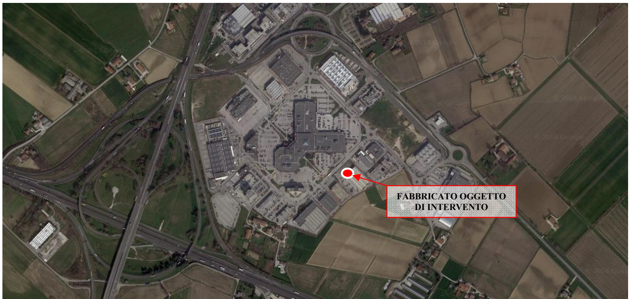
Ortofoto del Parco Commerciale e indicazione dell'intervento

Zona altimetrica: pianura Altitudine 30 m s.l.m.