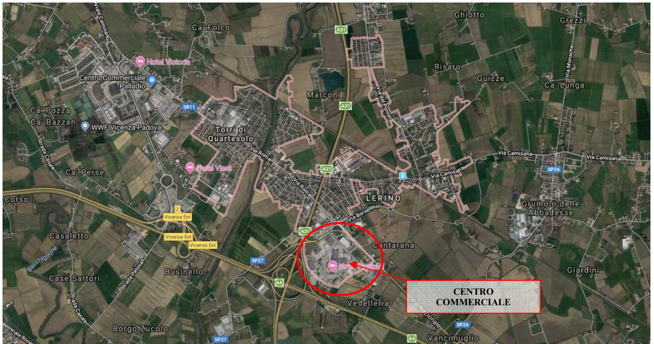
Ortofoto del Parco Commerciale