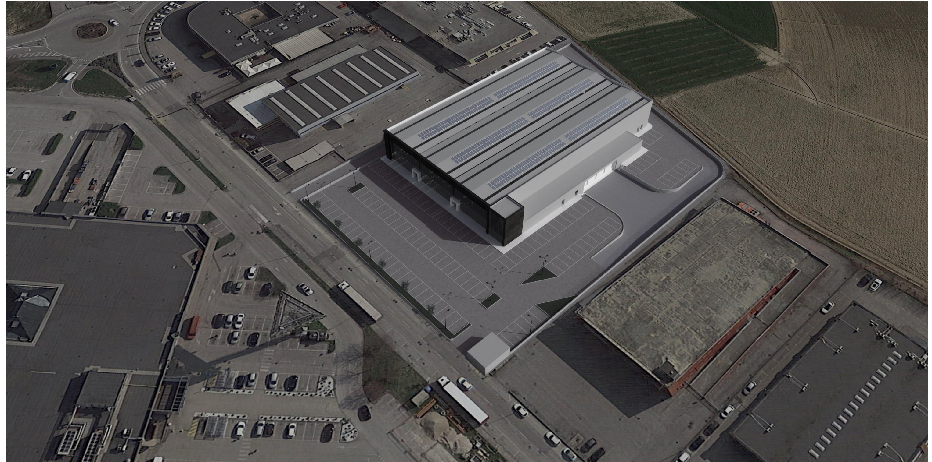
Vista dall'alto 1:1

elaborazioni grafiche a cura della "Net Project S.r.l." piazza Modin, 12 - 35129 PADOVA - tel. 0498935081 - fax. 0498935137 ai termini delle vigenti leggi in materia, questo elaborato NON può essere copiato, riprodotto o divulgato ad altri senza l'autorizzazione dell'autore