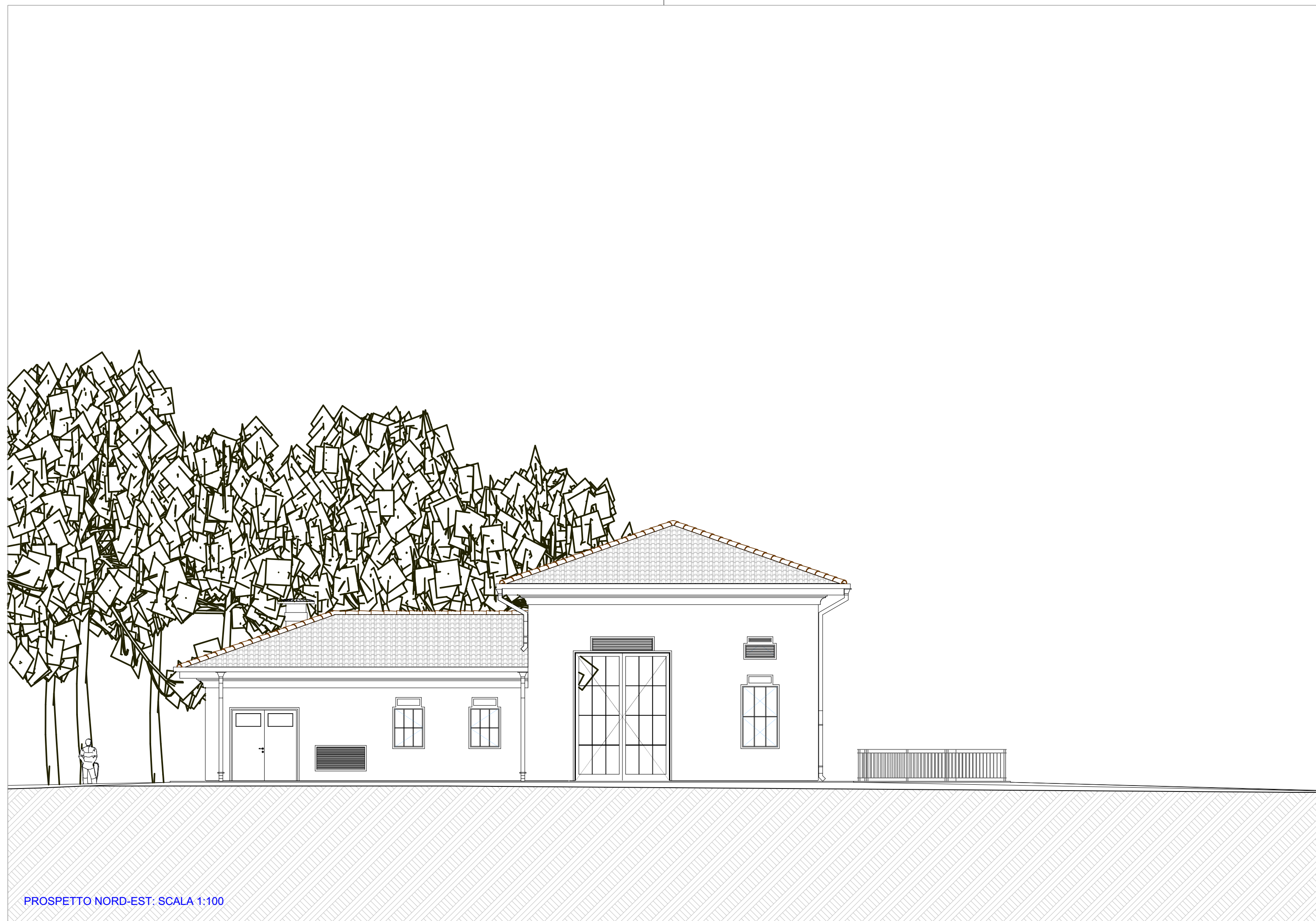
PROSPETTO NORD-EST. SCALA 1:100