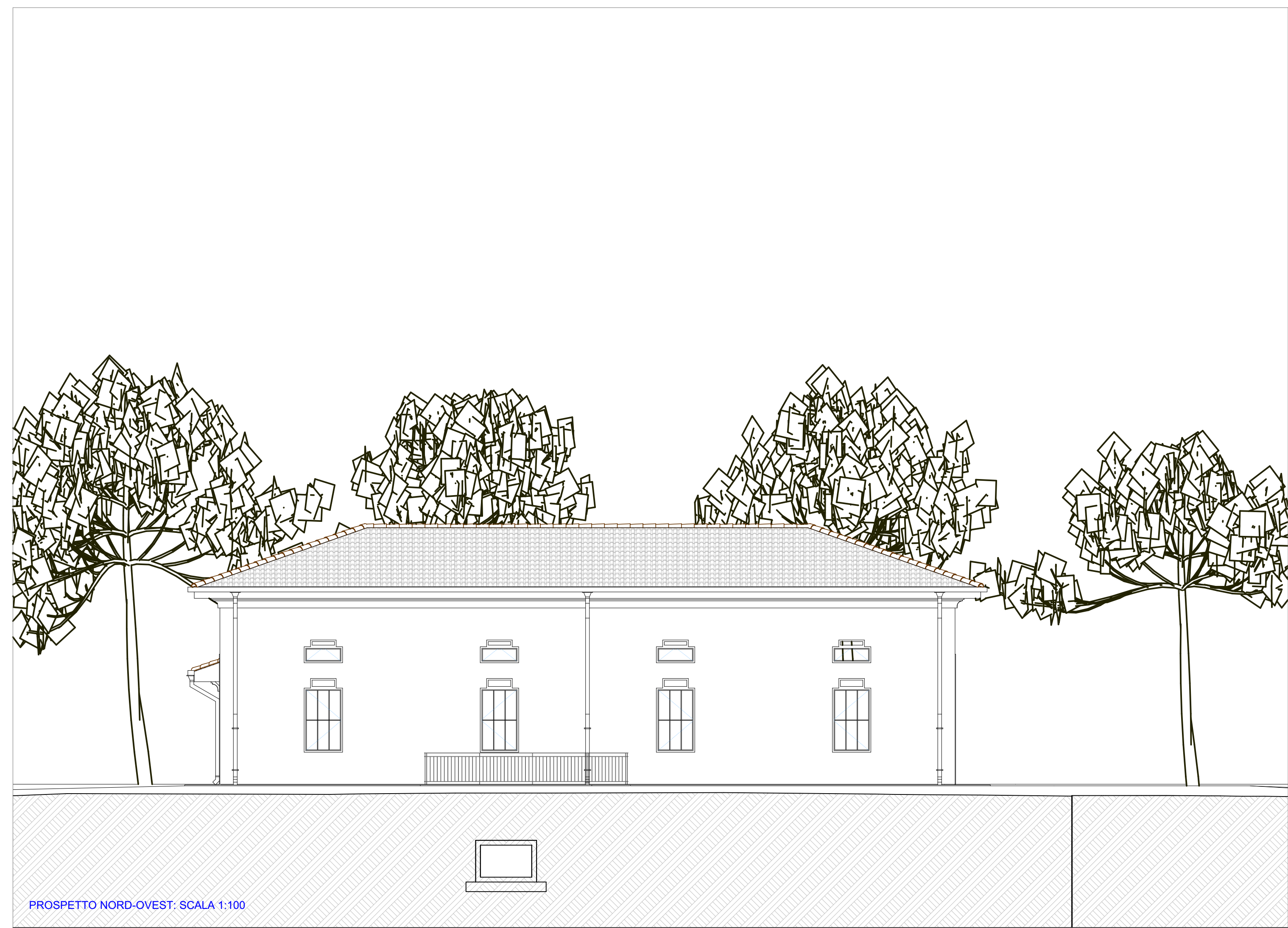
PROSPETTO NORD-OVEST. SCALA 1:100

COMUNE DI BASSANO DEL GRAPPA PROVINCIA DI VICENZA