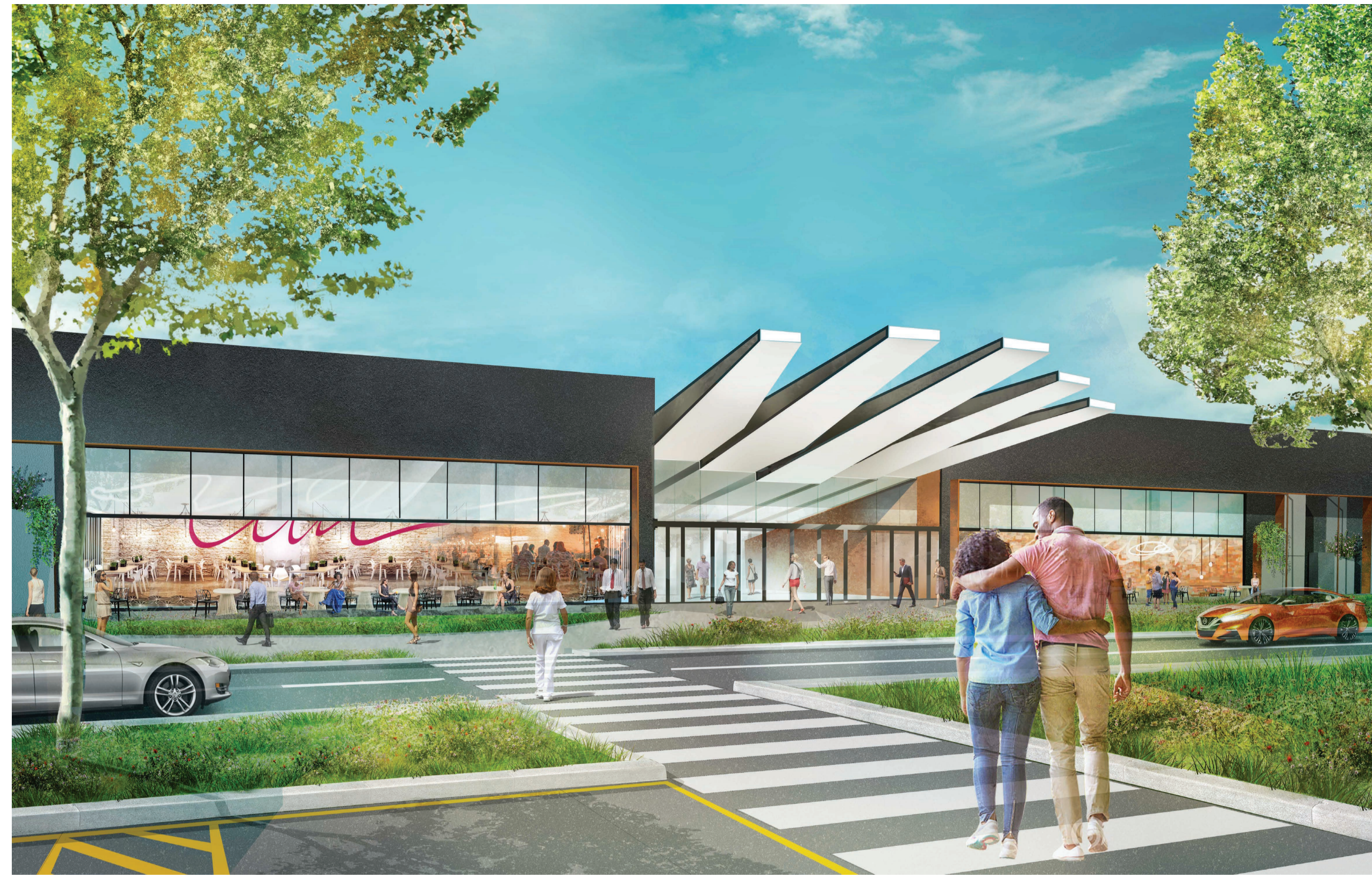
VISTA 1 - AMPLIAMENTO