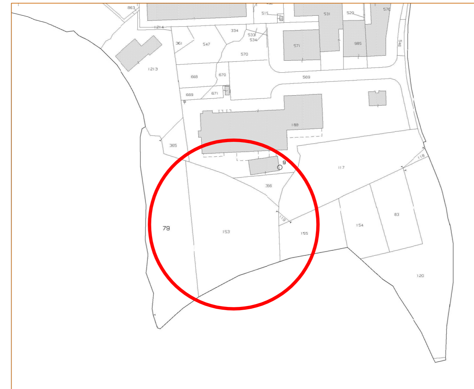
ESTRATTO N.C.T. Fig. 6, Mapp. 153