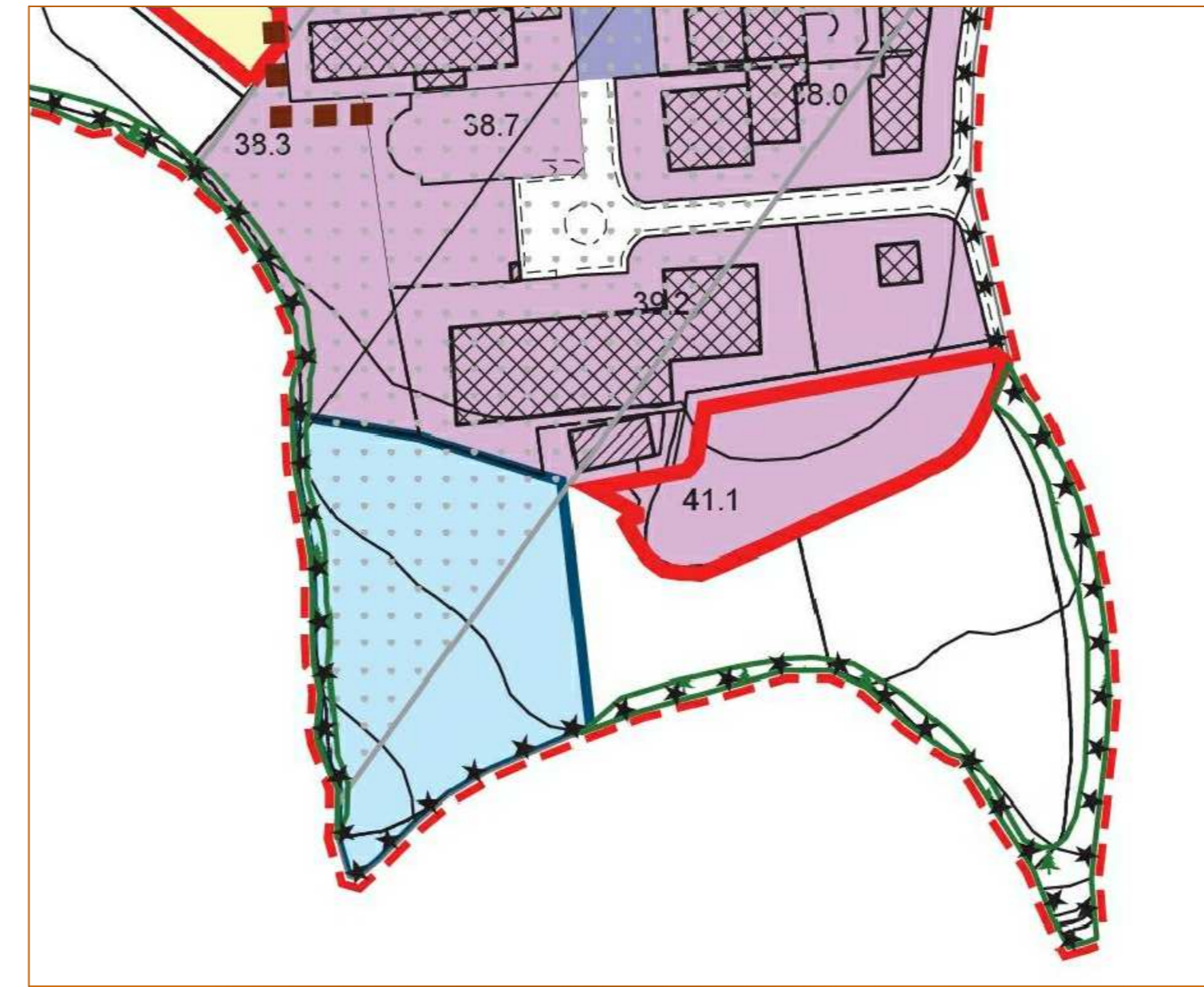
ESTRATTO PIANO DEGLI INTERVENTI