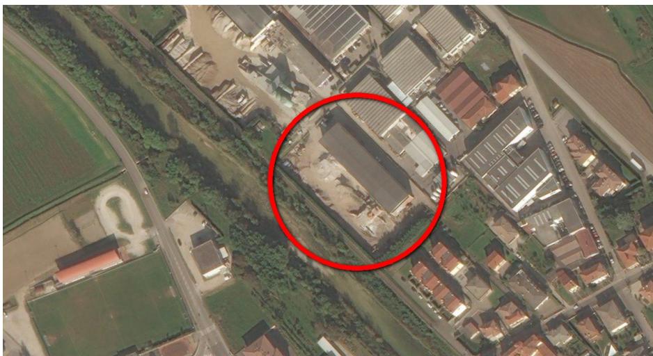
Ortofoto del sito