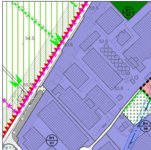
ESTRATTO di P.I. scala 1:5000