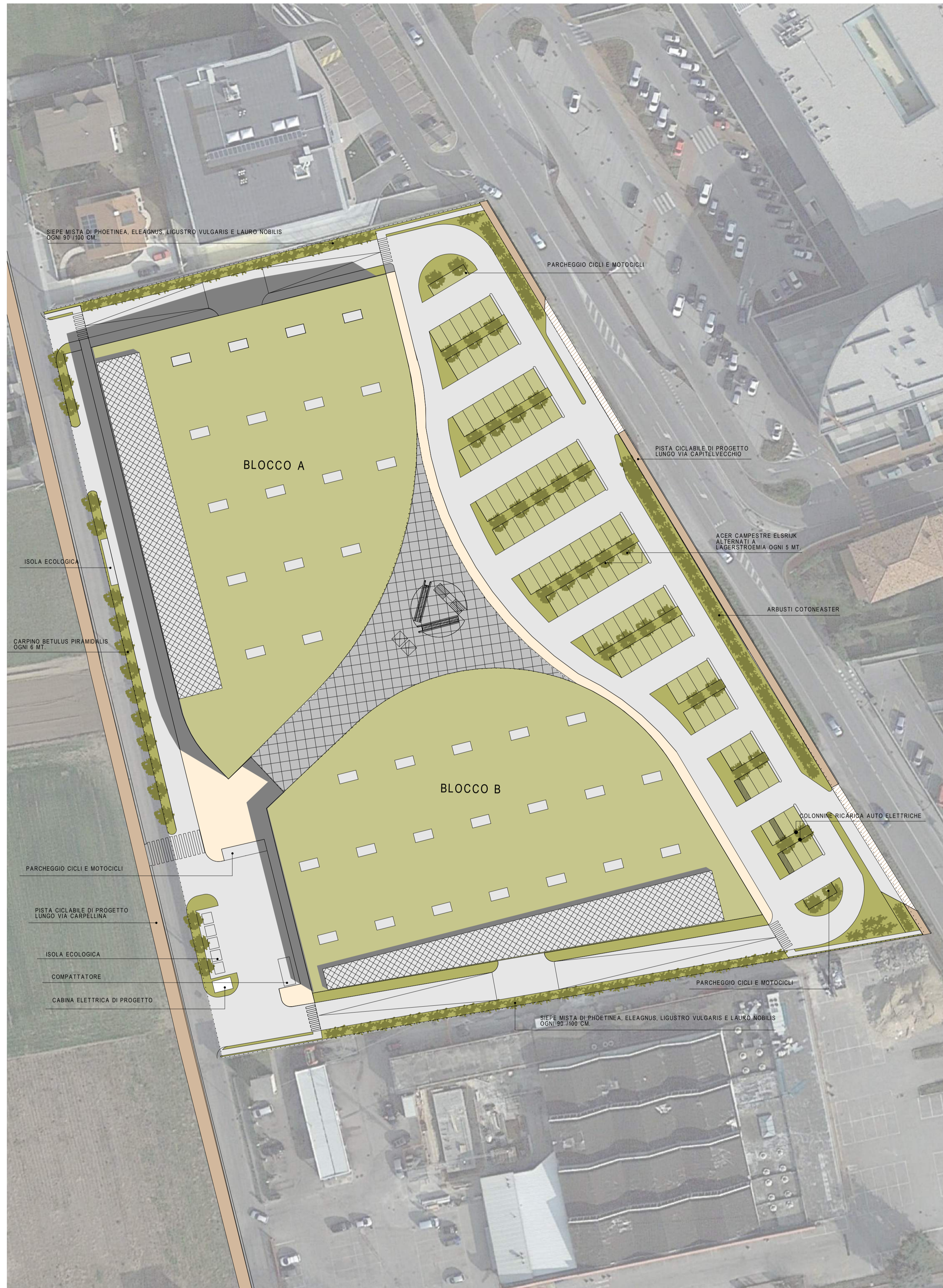
PROGETTO - PLANIVOLUMETRICO - SCALA 1:500