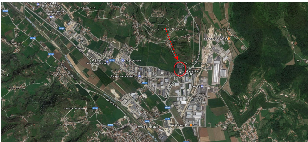
Figura 2 - Foto aerea dell'area - ditta Peripoli srl

Per eventuali vincoli ambientali si rimanda all'Elaborato 2 e all'Elaborato 4.