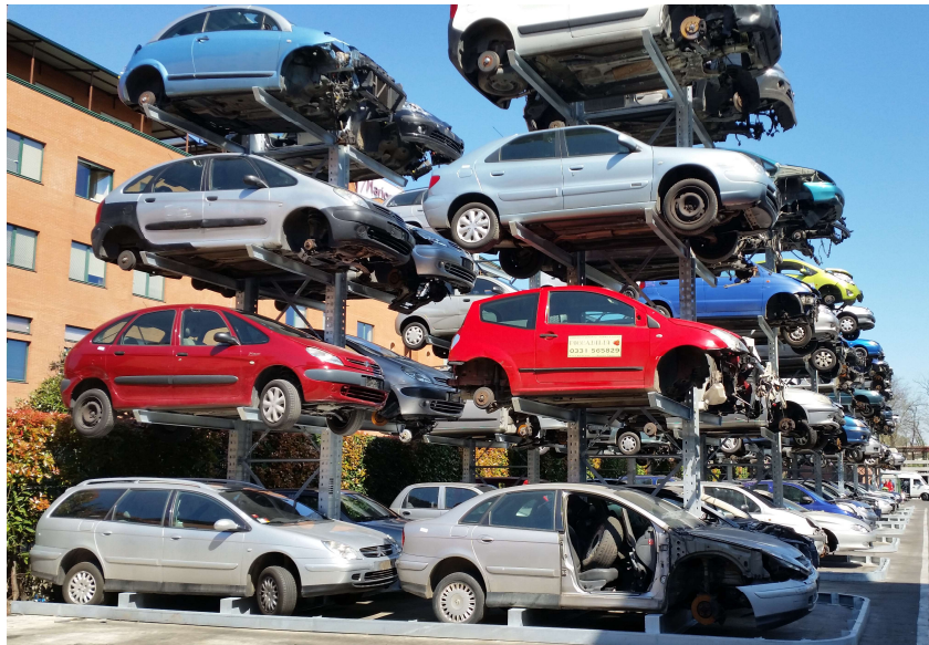
Figura 4 – Immagine esemplificativa della struttura "a cantilever"

Una volta ottenuti tutti i necessari permessi sarà cura della ditta richiedere il permesso edilizio agli enti competenti per la messa in opera delle strutture "a cantilever".