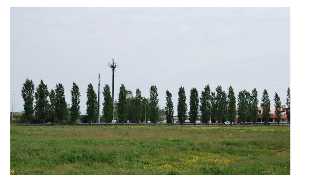
FOTO 10 QUINTA VEGETATIVA SU TANGENZIALE SUD