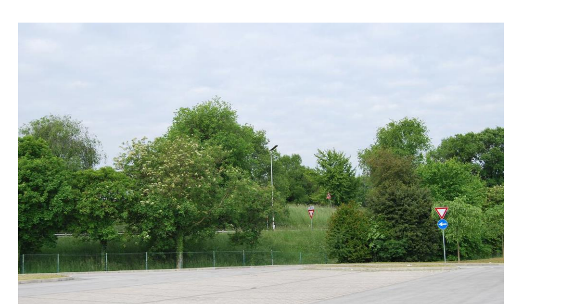
FOTO 11 MITIGAZIONE SU SVINCOLO AUTOSTRADALE