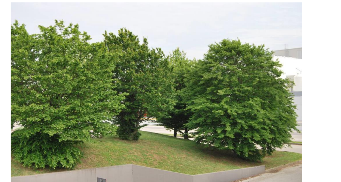
FOTO 8 AIUOLE VERDE DI MITIGAZIONE