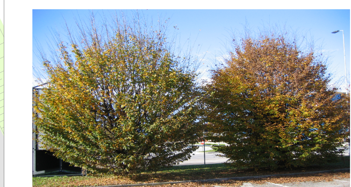
FOTO 4 QUINTA VEGETATIVA SU AIUOLE DI SEPARAZIONE TRA PARCHEGGI E VIABILITA' DI PIANO