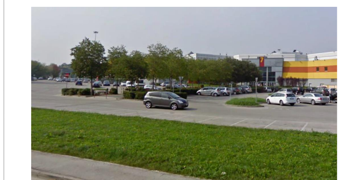
FOTO 3 FILARI A SCHERMATURA DEGLI INGRESSI E FASCIE VERDI DI SEPARAZIONE TRA VIABILITA' E PARCHEGGI