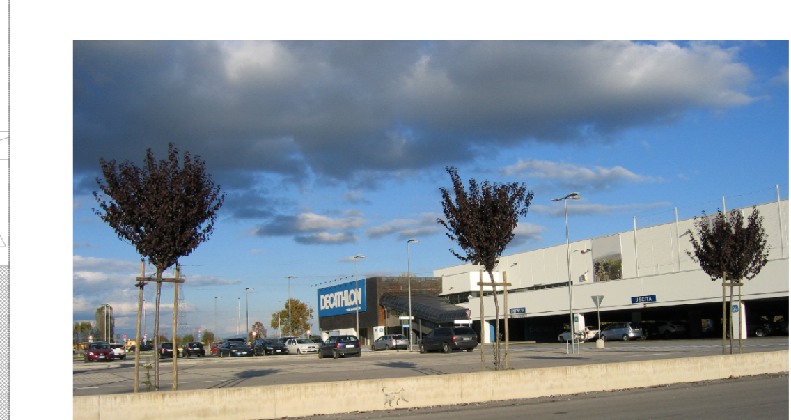
FOTO 6 NUOVE PIANTUMAZIONI SU LOTTO F