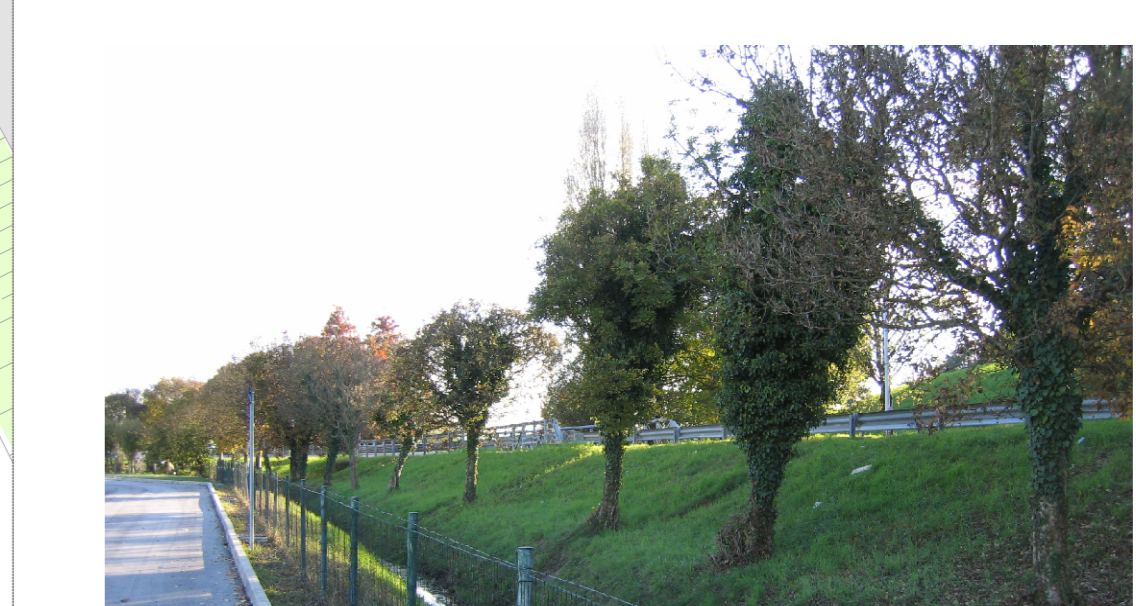
FOTO 5 QUINTA VEGETATIVA DI SEPARAZIONE CON RACCORDO AUTOSTRADALE