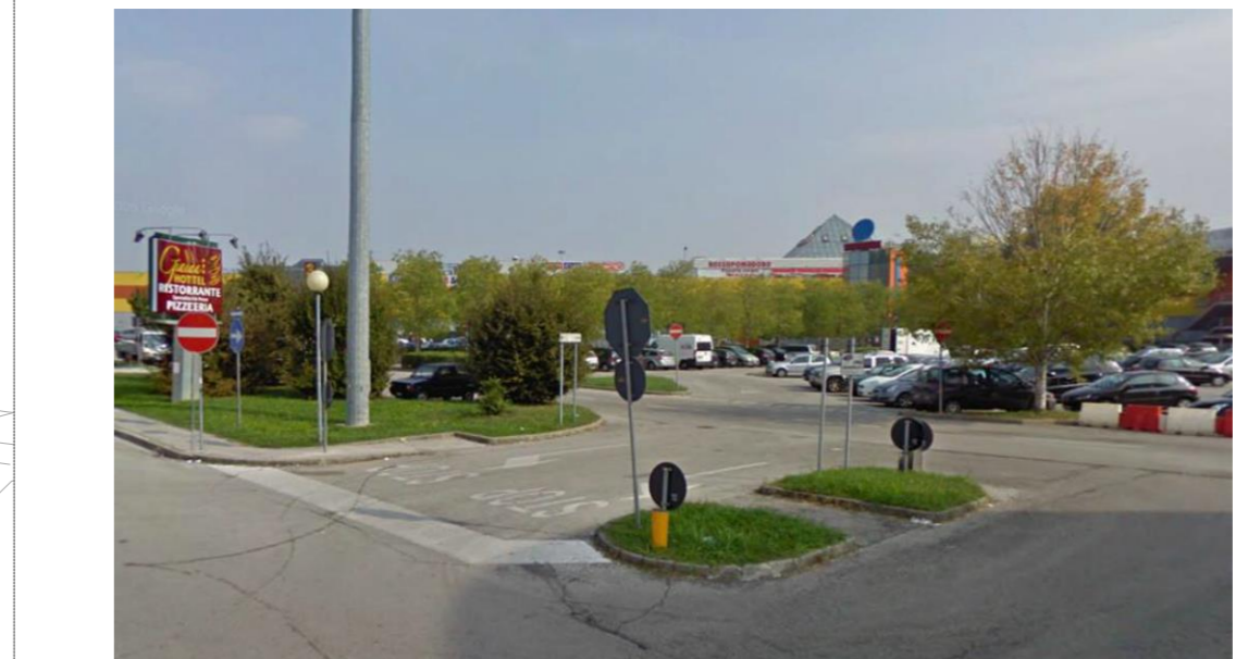
FOTO 2 FILARI E MACCHIA BOSCATI A SCHERMATURA DEGLI INGRESSI