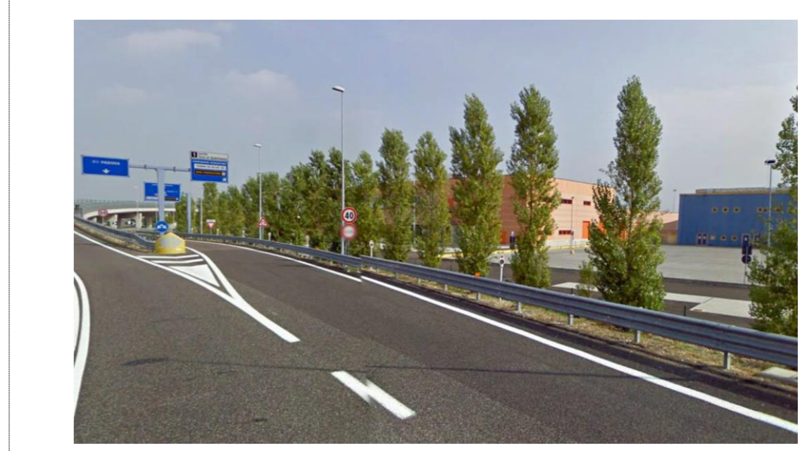
FOTO 1 QUINTA VEGETATIVA COSTITUITA DA FILARE DI ALBERI