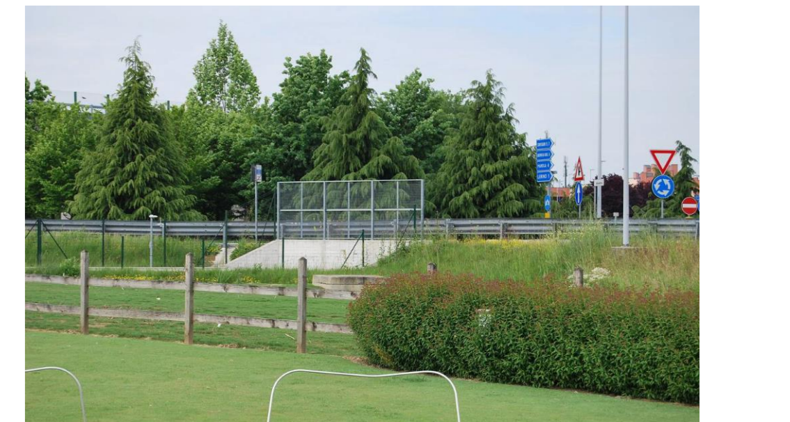
FOTO 9 SIEPI DI SEPARAZIONE DEL PERCORSO CICLOPEDONALE