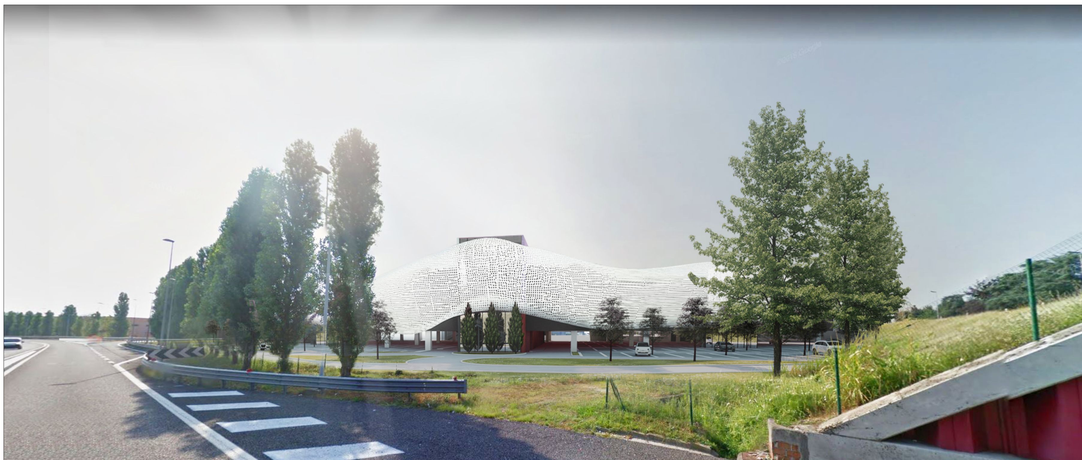
VISTA DALLA TANGENZIALE SUD