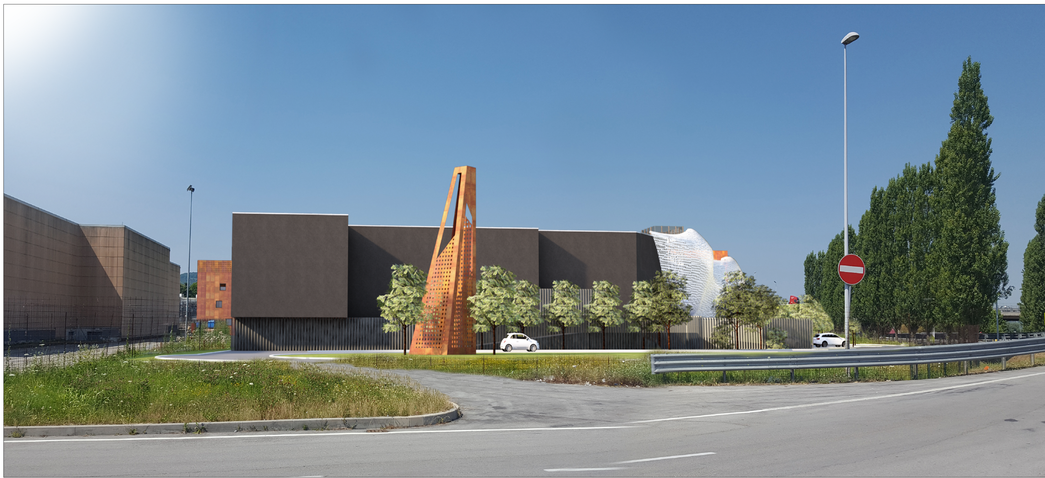
VISTA DA VIA VERCELLI