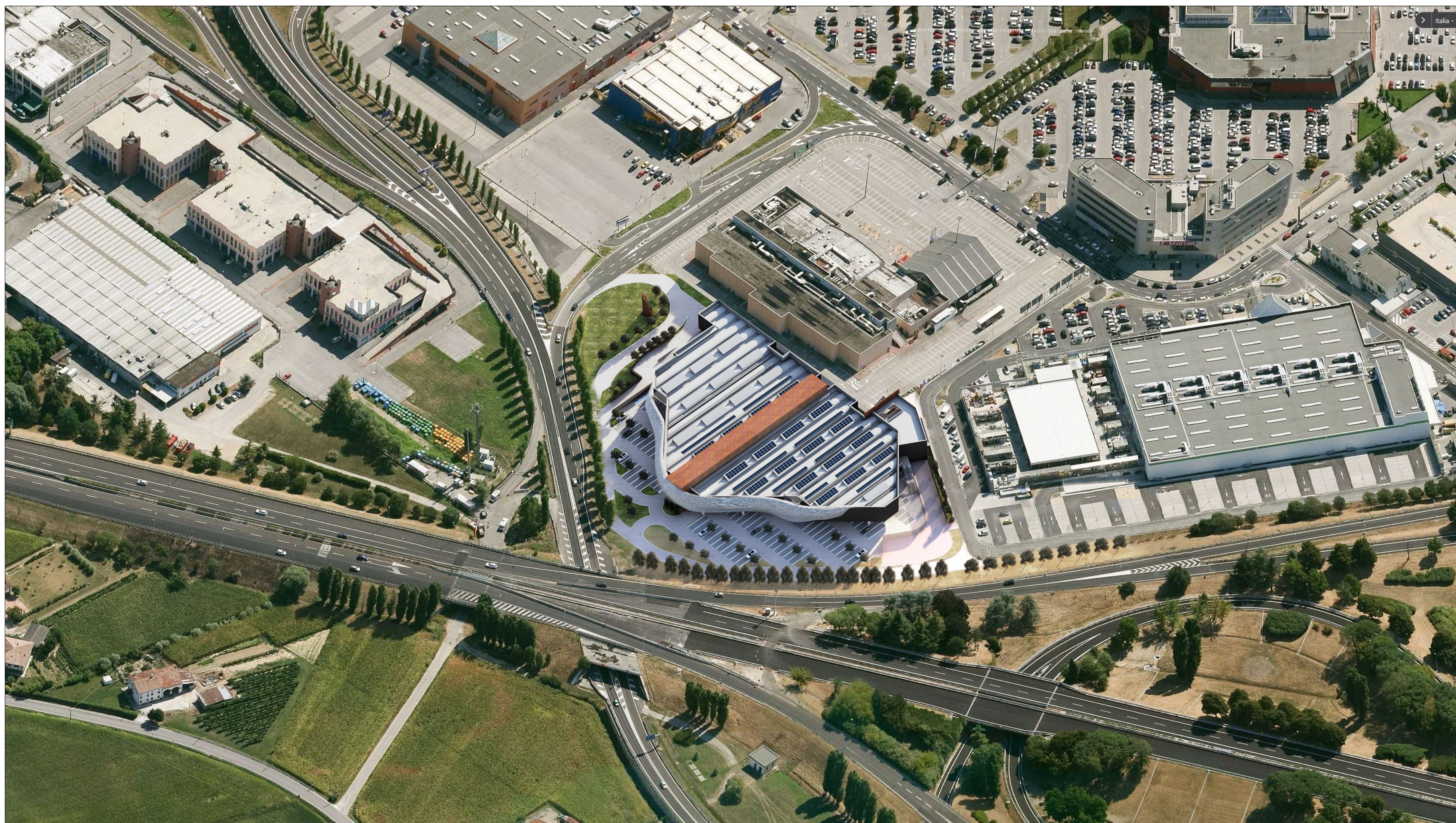
VISTA AEREA DELL'INTERVENTO E DEL CONTESTO