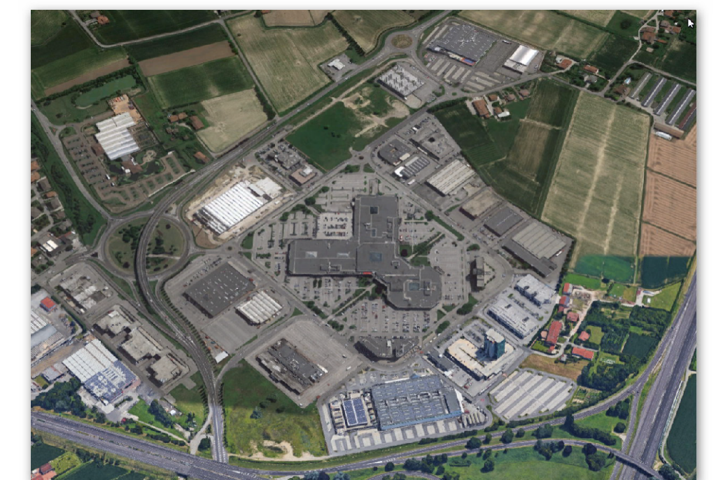
ELABORATI PROGETTUALI EDIFICIO "E"

D.Lgs. 3 Aprile 2006 n. 152 e ss.mm.ii. Legge Regionale del Veneto 18 Febbraio 2016 n. 4