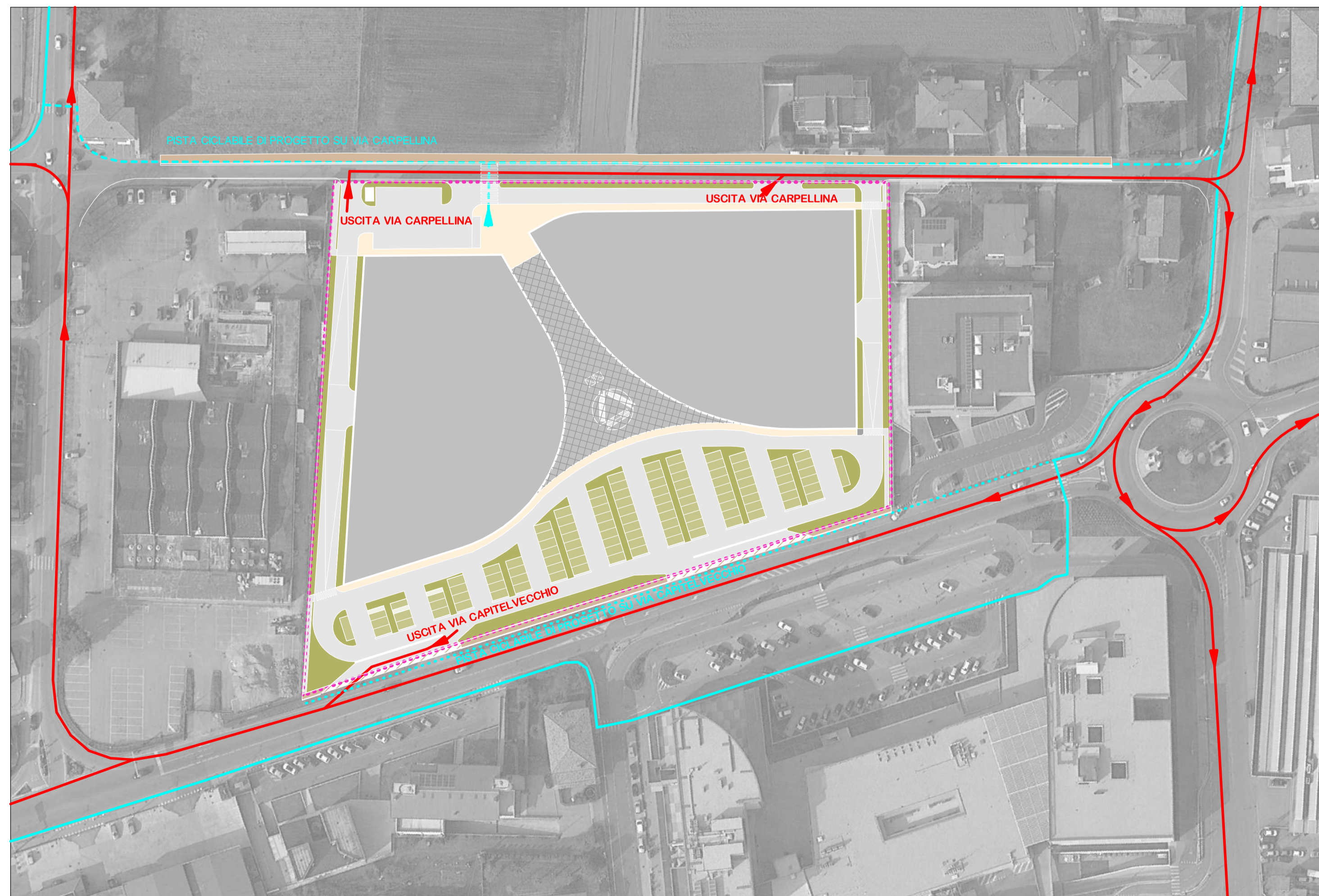
PLANIMETRIA CON INDICAZIONI VIABILITA' IN USCITA - SCALA 1:1000