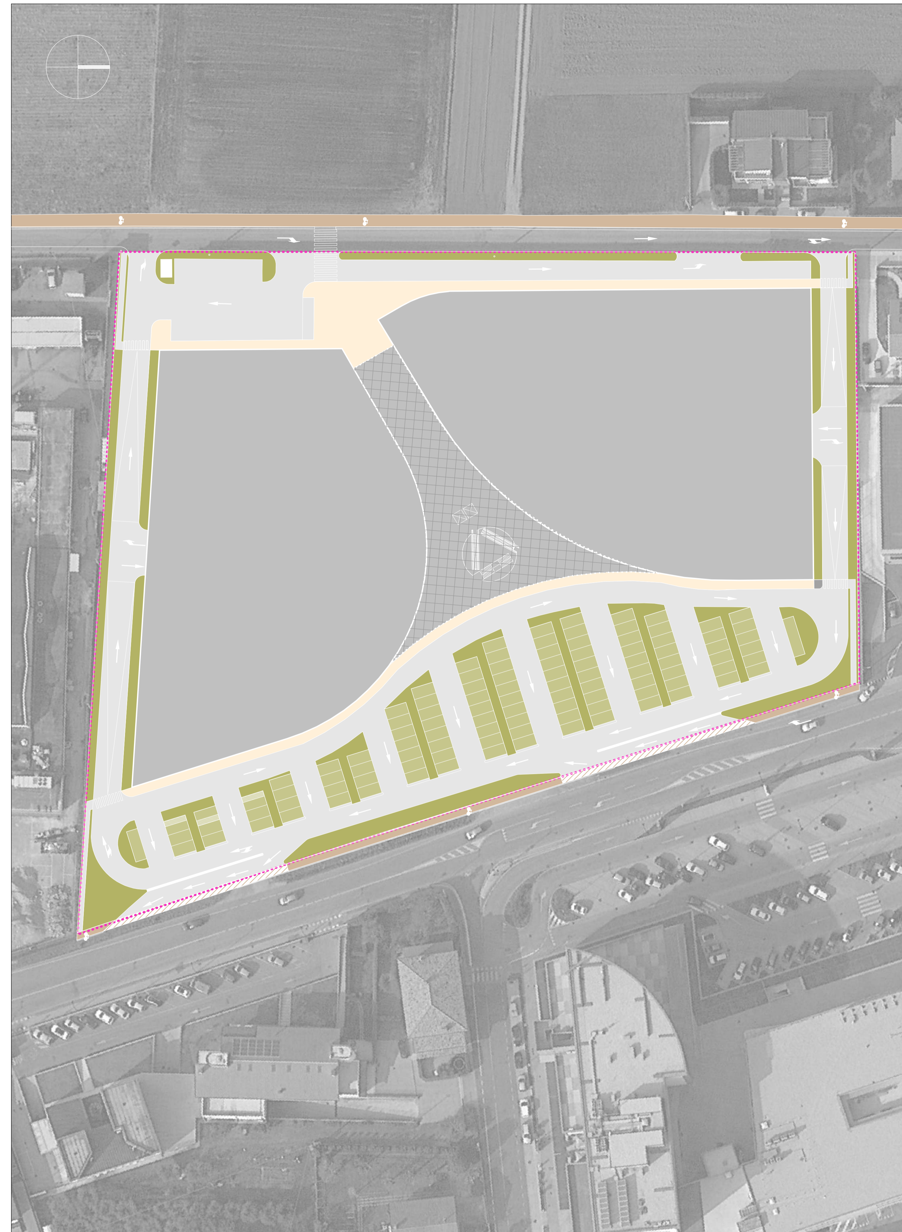
PLANIMETRIA CON INDICAZIONI VIABILITA' INTERNA - SCALA 1:500