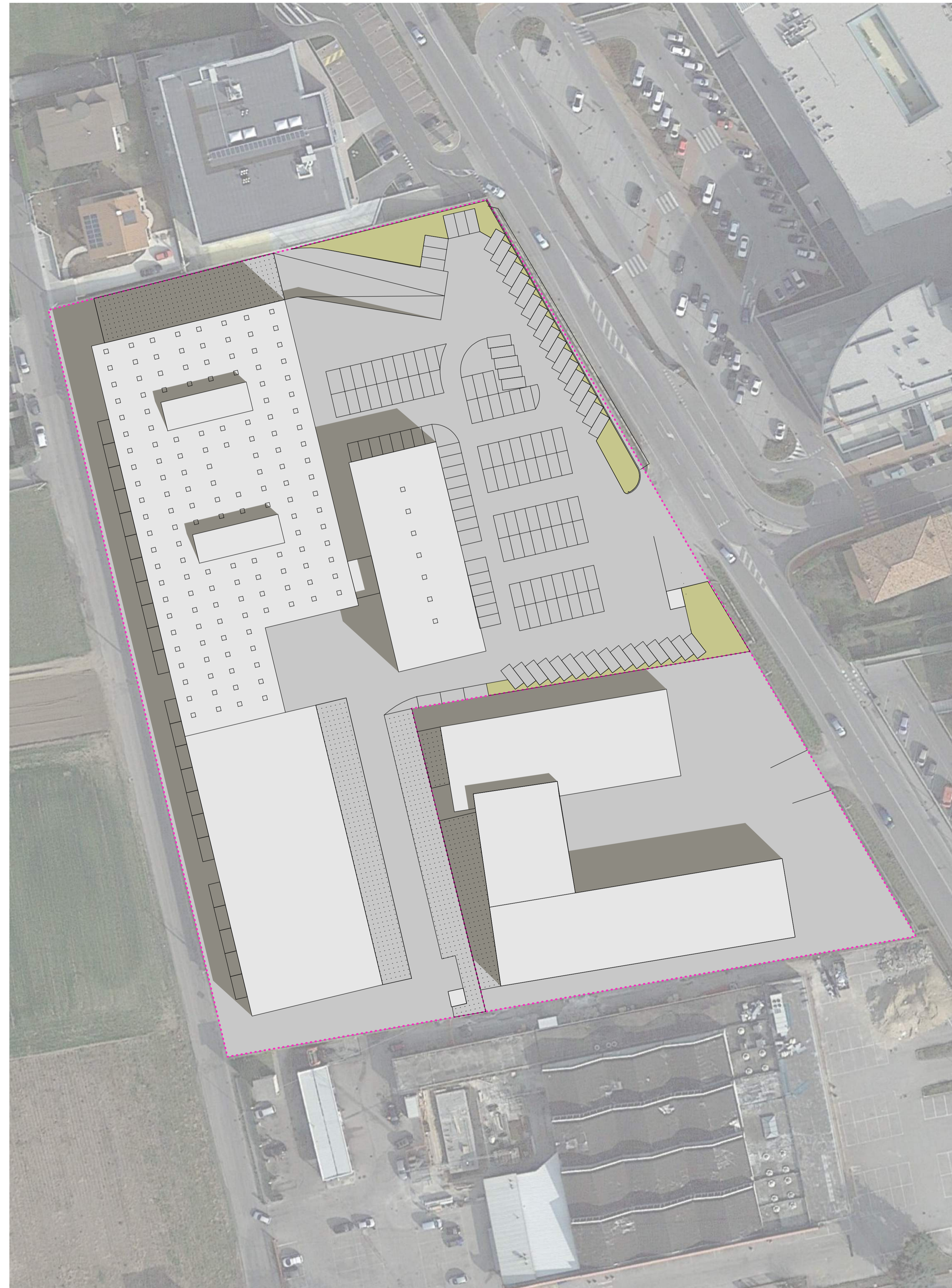
STATO DI FATTO - PLANIVOLUMETRICO - SCALA 1:500