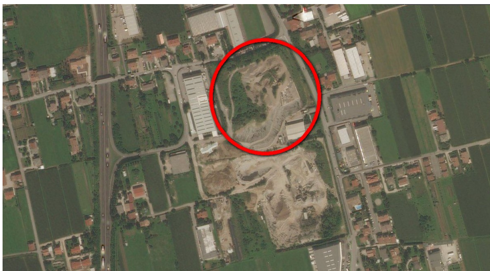
Ortofoto del sito