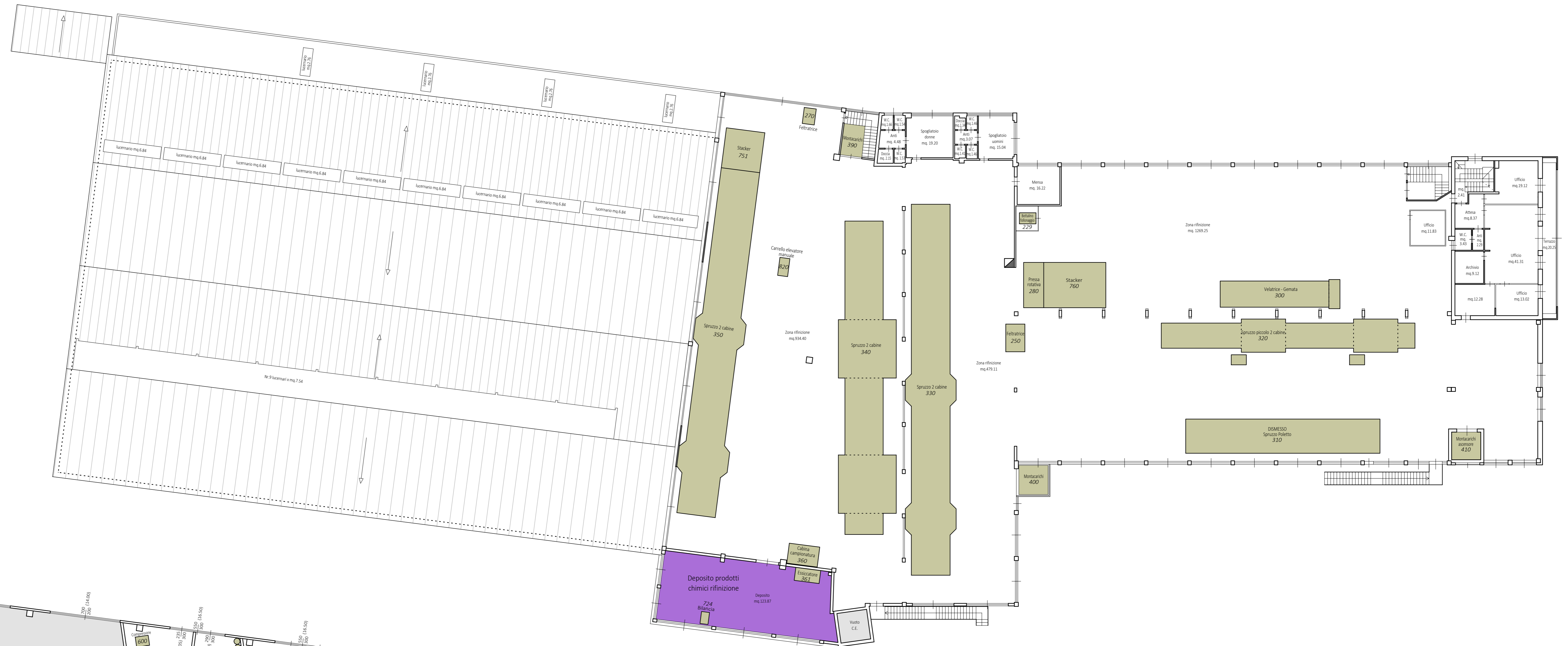
Pianta piano PRIMO con materie prime e finite scala 1:200