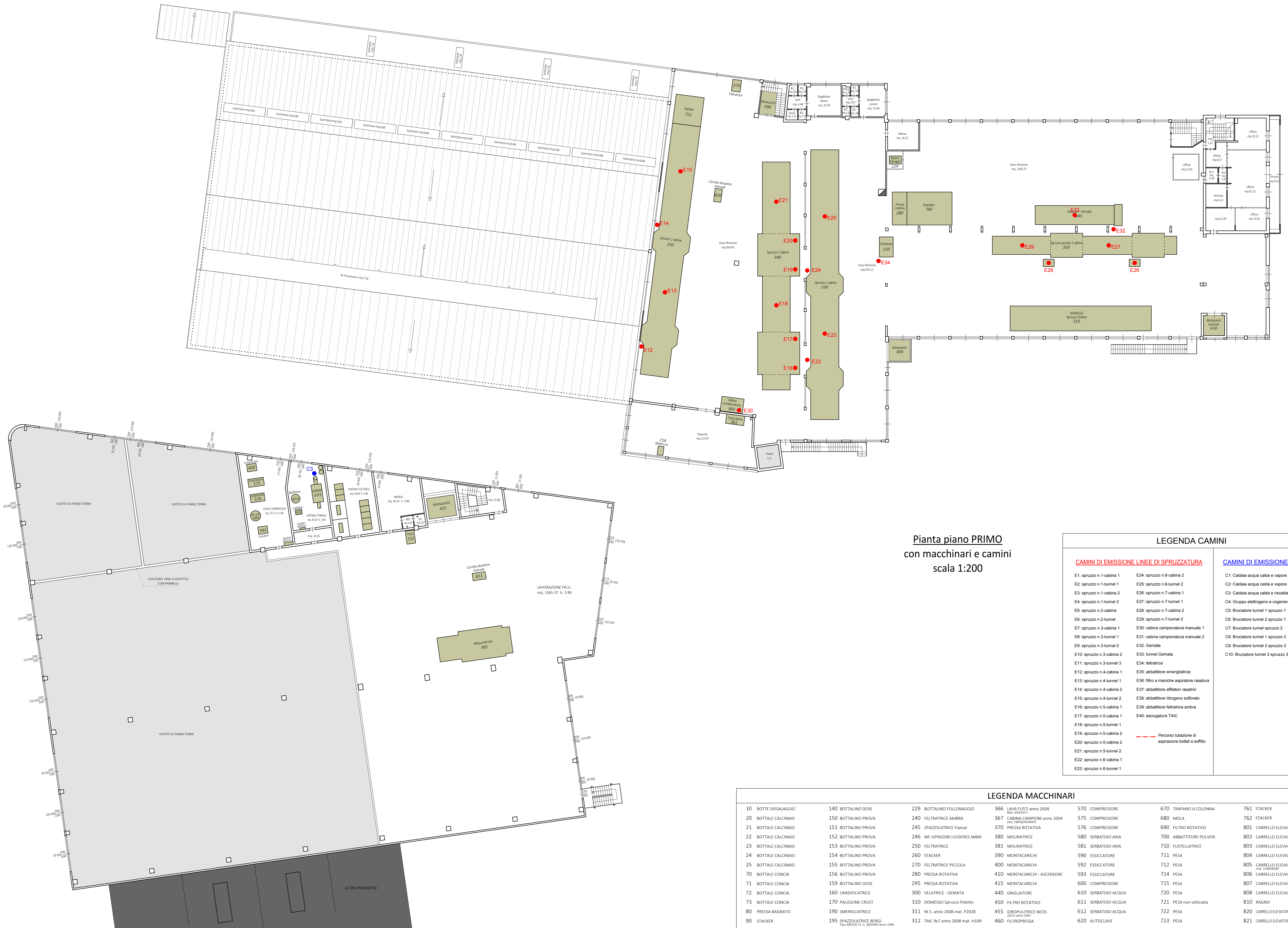
Pianta piano PRIMO con macchinari e camini scala 1:200