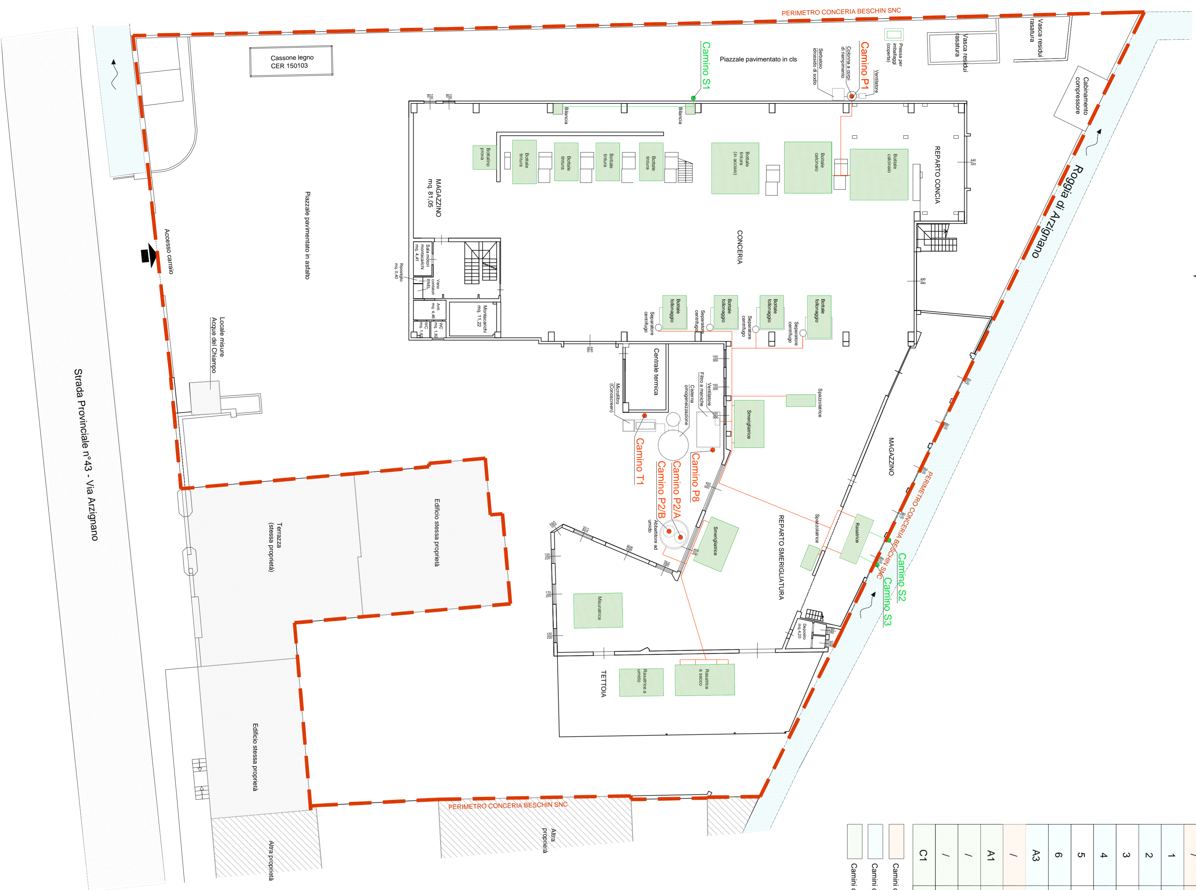
PIANTA PIANO TERRA Scala 1:200