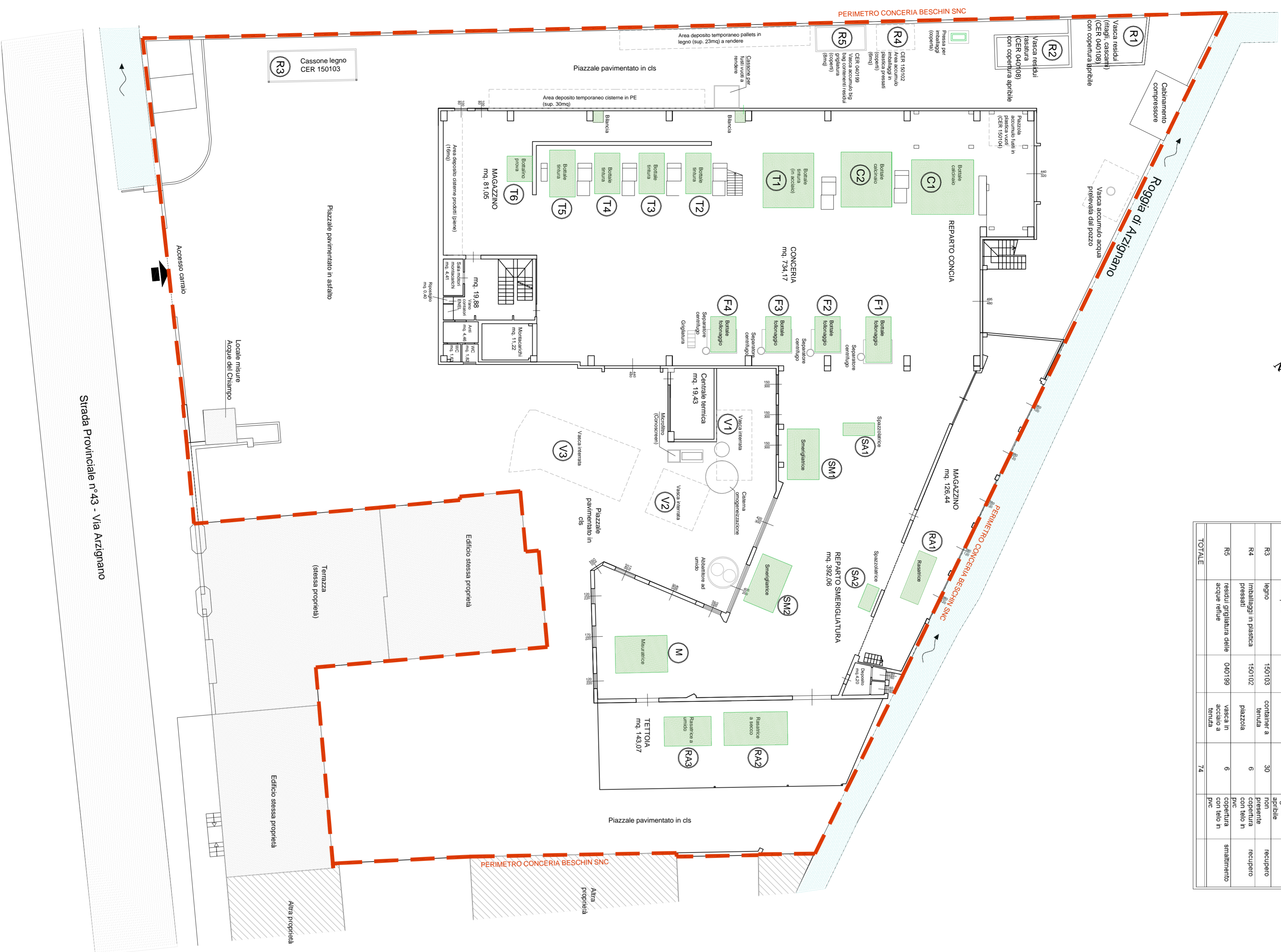
PIANTA PIANO TERRA Scala 1:200