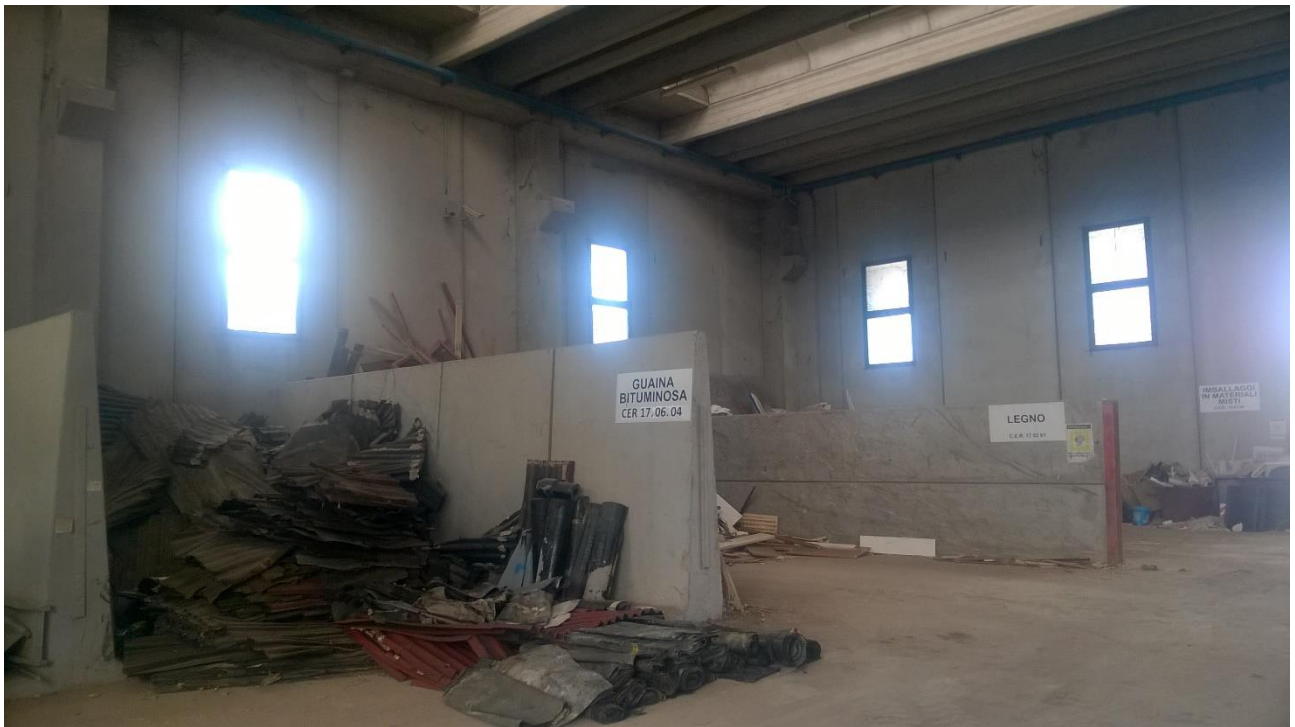
Figura 2 Area messa in riserva guaina bituminosa