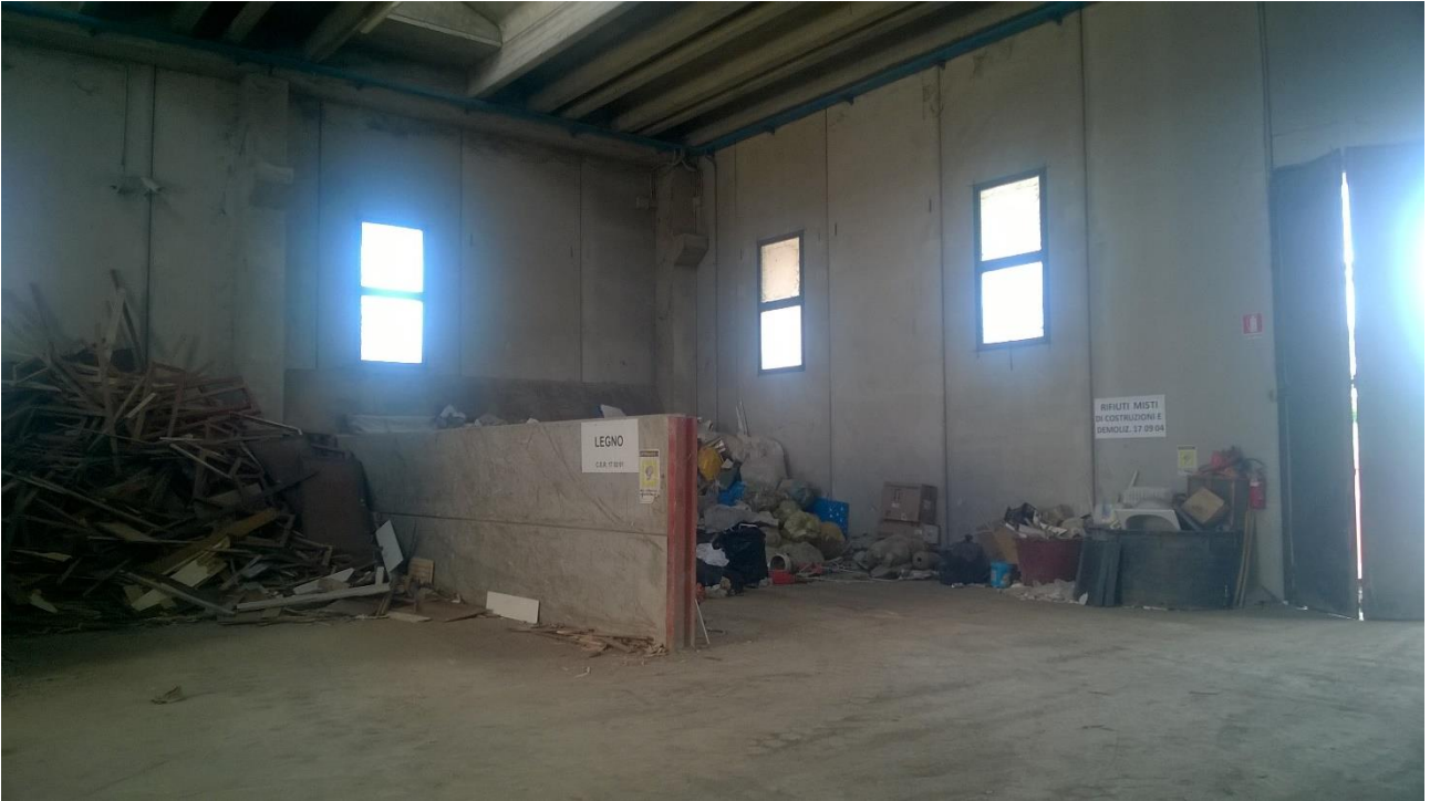
Figura 3 Area messa in riserva legno