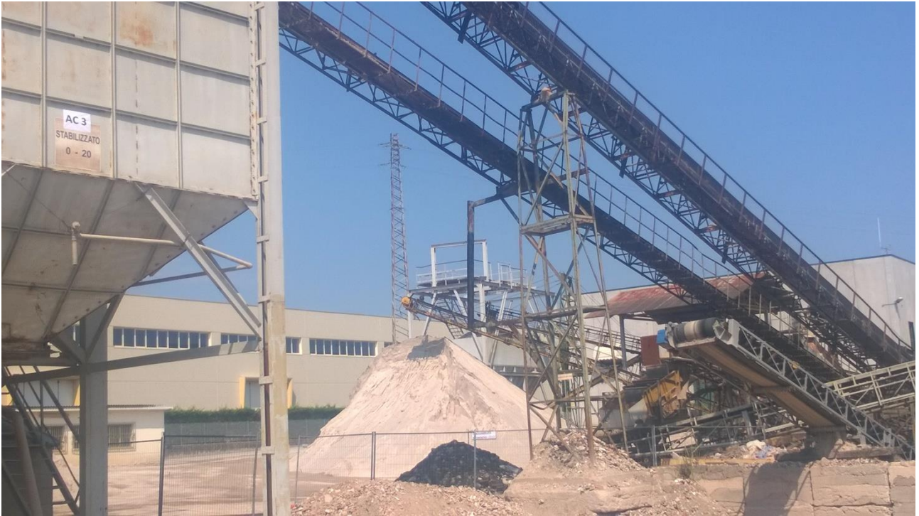
Figura 13 Vista silos di caratterizzazione AC3 stabilizzato riciclato (derivanti dal trattamento dei rifiuti della tipologia 7.6)