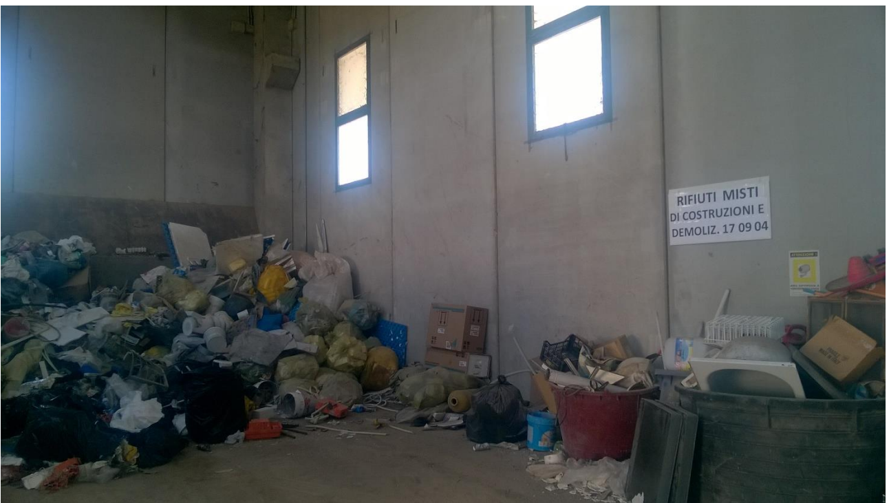
Figura 4 Area messa in riserva rifiuti misti da costruzione e demolizione