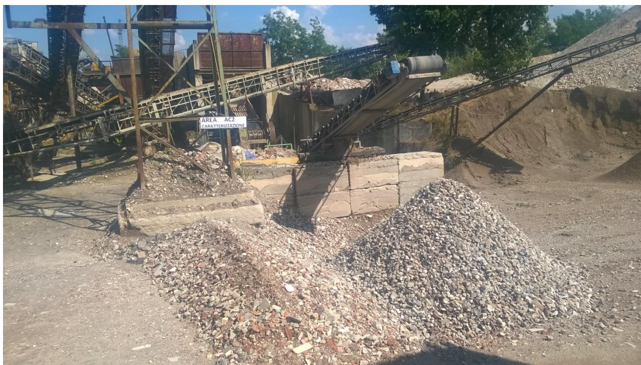
Figura 12 Area di caratterizzazione AC2 pietrisco riciclato (derivanti dal trattamento dei rifiuti della tipologia 7.1)