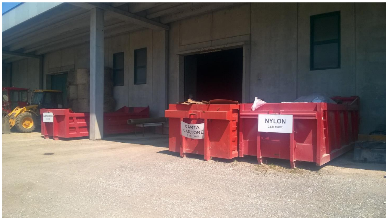
Figura 5 Area messa in riserva Carta/Cartone e Nylon