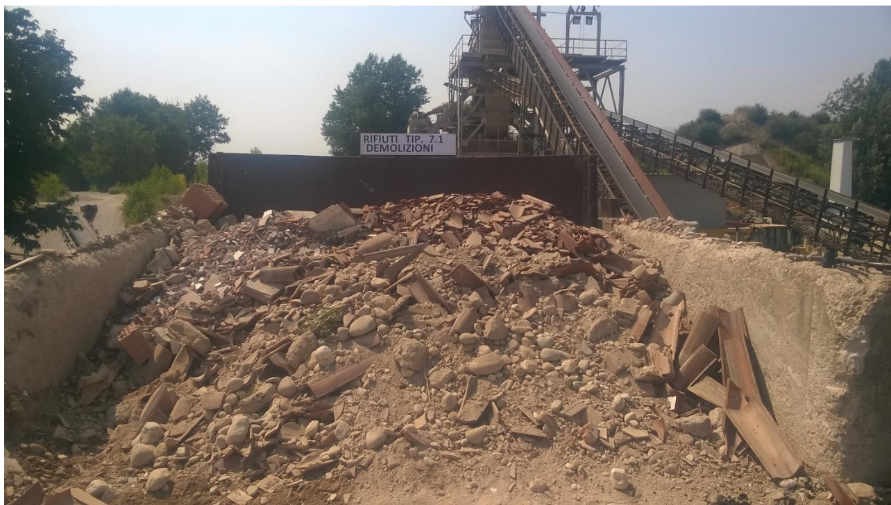
Figura 9 Area di messa in riserva rifiuti della tipologia 7.1