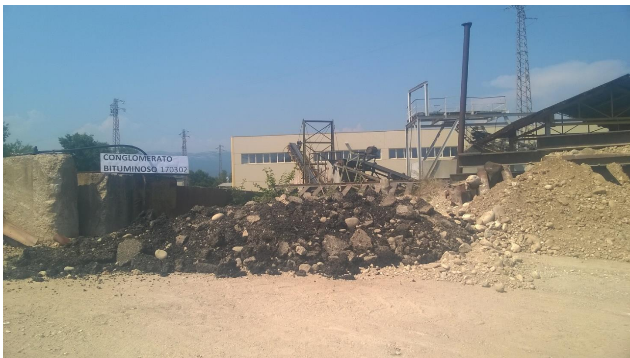
Figura 10 Area di messa in riserva rifiuti della tipologia 7.6