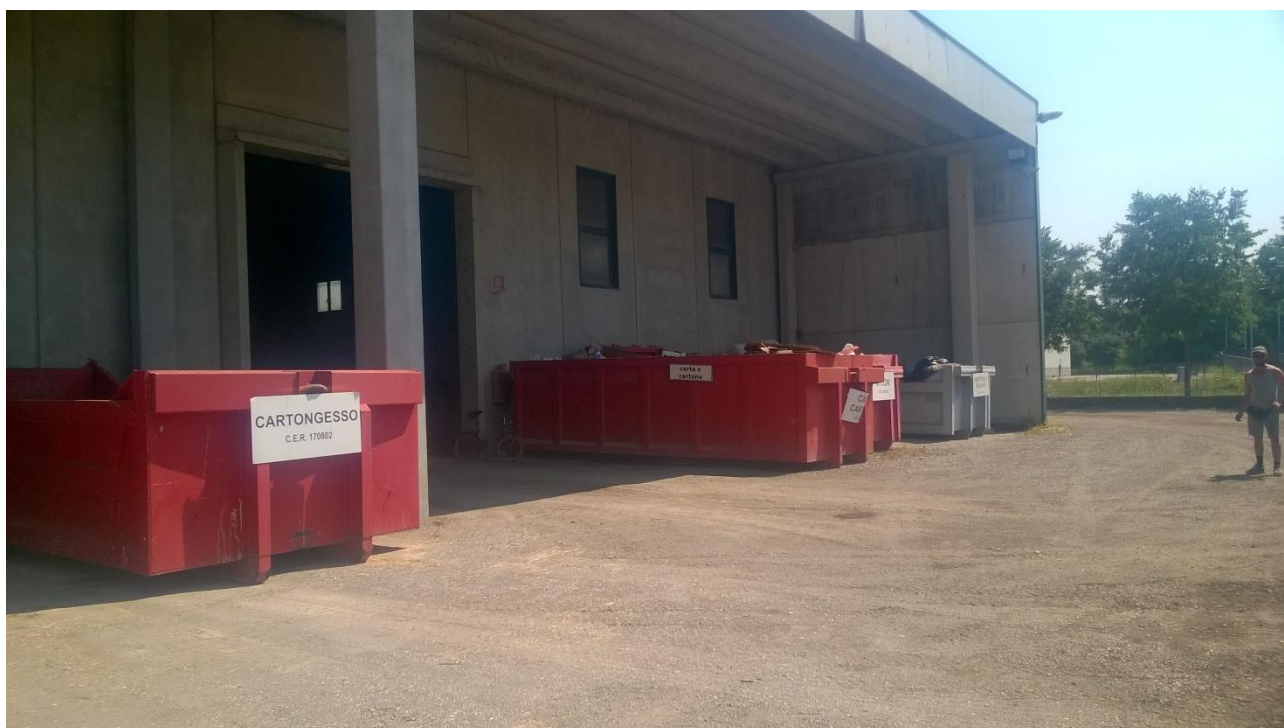
Figura 6 Area messa in riserva cartongesso