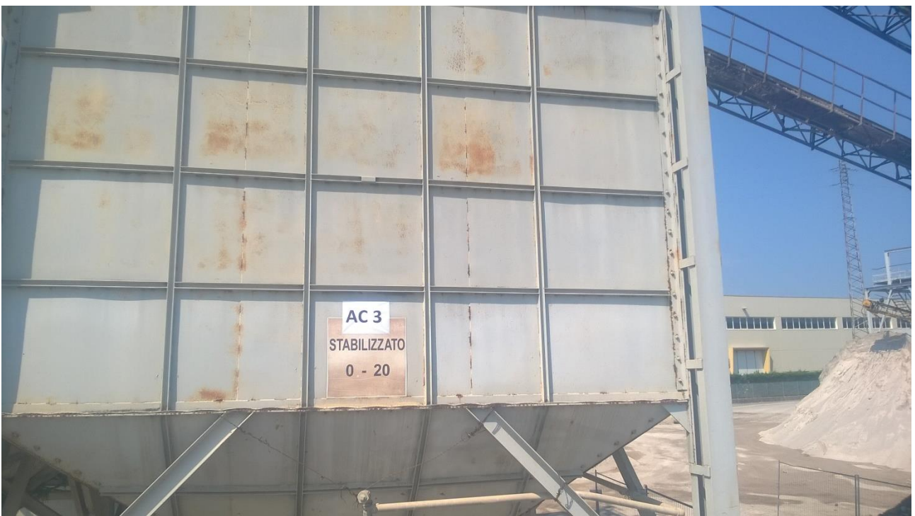
Figura 14 Silos di caratterizzazione AC3 stabilizzato riciclato (derivanti dal trattamento dei rifiuti della tipologia 7.6)