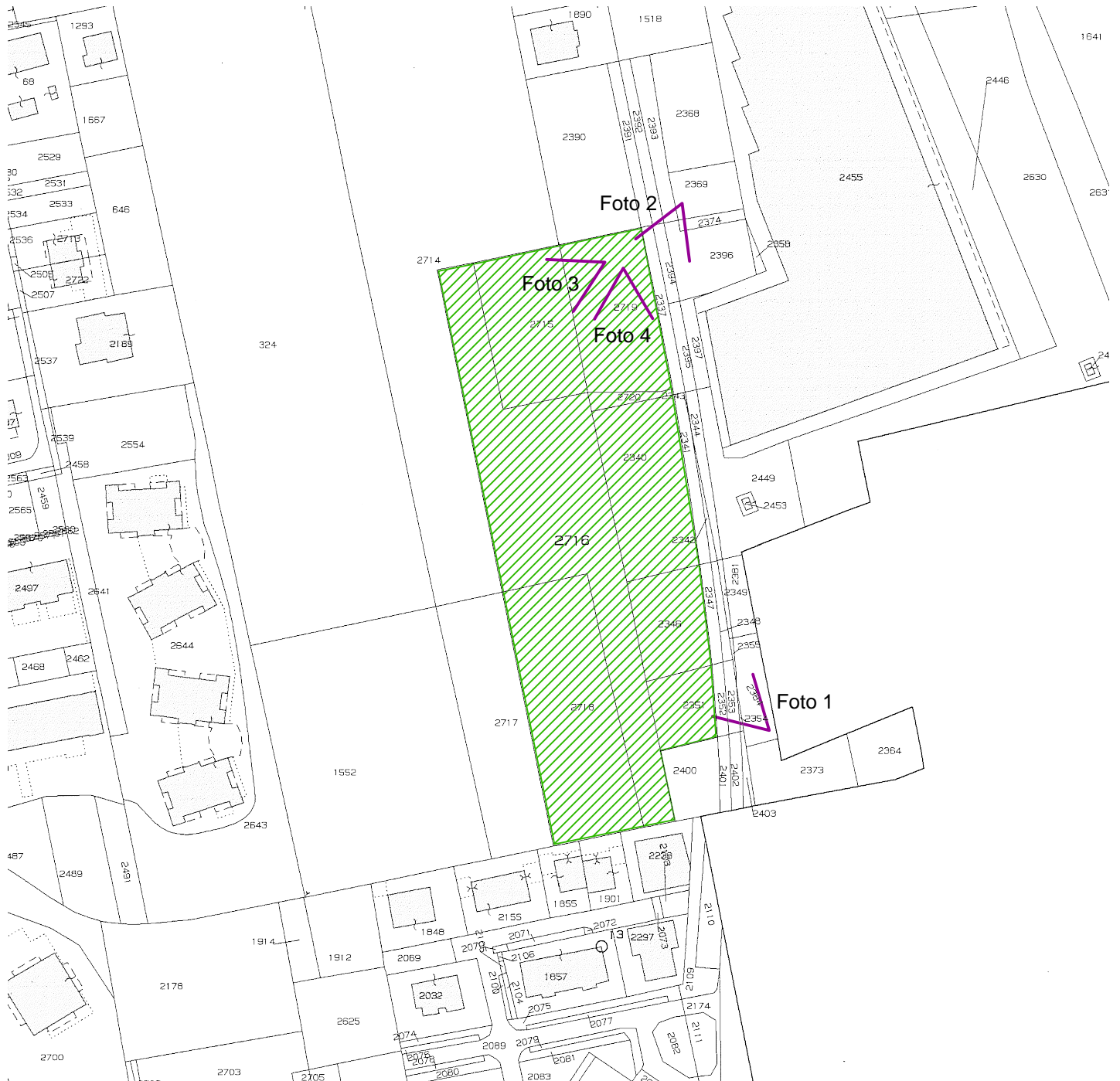
Fig. 7 - mapp. 2340-2346-2351-2715-2716-2718-2719-2720