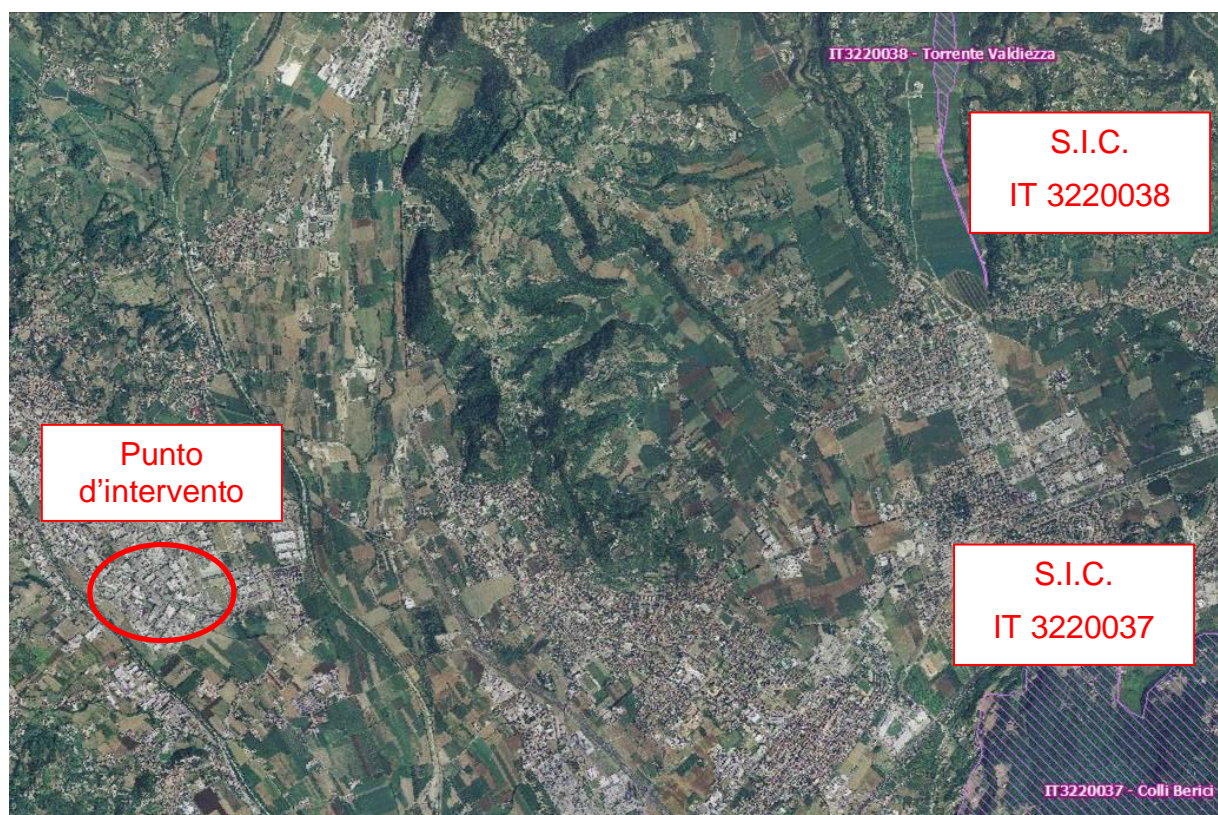
Immagine 1: Punto d'intervento e individuazione dei S.I.C. presenti

L'impianto oggetto d'intervento dista in linea d'aria dalla porzione più proximale di detti S.I.C. circa 7,7 km da "Torrente Valdiezza" e 7,5 km da "Colli Berici".